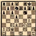
№ 8 (после 10. g2-g4)

Белые угрожают 11. С: f6 К: f6 12. g5 с выигршем пешки. В одной из партий Ботвинника с Алаторцевым черные ответили 10... К: g4, на что последовало 11. С: h7+ Kрh8 12. Cf4 с выигранным положением; напр.: 12... g6 13. С: g6 fg 14. Ф: g6 Kgf6 (Или 14... Kdf6 15. h3!) 15. Ke3 Фе8 (Если 15... К: e5 16. С: e5 Фе8, то 17. Фh6+ Kpg8 18. Лg1+ Kpf7 19. Лg7+ Kpe6 20. Фh3+) 16. Фh6+ Kh7 17. Kg6+ Kpg8 18. Лg1.