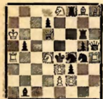
Мат в 2 хода (1. Ла3)