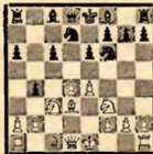
№ 2 (после 9. ... b5—b4)

ложение встретилось в трех партиях турнира (Чеховер—Пирц, Рагозин—Левенфиш и Рагозин—Пирц). Белые здесь следующим образом добиваются преимущества: 10. Ке3—a4! (He 10. Ке2? в партии Чеховер—Пирц последовало: 10. ... e5 11. e5 Kd5 12. 0—0 Сb7 13. Кg3 ed 14. Ке4 h6 15. Cd2 g5! 16. К: d4 К: e5 17. Се2 Феb1 18. Ca4+