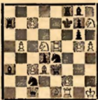
Мат в 2 хода (1. Сс4)

Задача Даниэля, отмеченная на этом конкурсе первым призом, по своей идее не представляет ровно ничего особенного. Матовые комбинации, встречающиеся в основных вариантах, скучны и известны. Но зато, как художественный комплекс, задача является мастерским произведением. Ее построение, первый ход, отсутствие дуалей — заслуживают вельской похвалы.