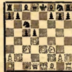
№ 7 (после 6. e2—e3)

Партия Ботвинник—Штальберг развивалась далее 6... e5—e4 (Черные избирают систему развития, для которой характерны ходы e4, Сb6 и Ке7; эта система развития может, однако, иметь успех лишь в случае пассивной тактики белых. Следовало предпочесть 6... Kf6 7. Се2 Cd6.) 7. Ce1—e2 Cf8—b4 8. 0—0 Kg8—e7 (Если черные предпочитают прорыв e3—e4 посредством 8... f5, то 9. Ке5!, имея в виду f4, Сf3 и Cd2, а в некоторых вариантах также Фb4 или b3.) 9. e3—e4! d5: e4 (Если 9... С: e3, 10. be de, то 11. Kg5±.) 10. Ке3: e4 0—0 (Лучший шанс: черные отдадут пешку, но зато переходят в контр-атаку; если же 10... Се6, то 11. e3; так как теперь невыгодно для черных 11... Са5 в виду 12. Ке5, то им приходится играть 11... Сd6, на что следует 12. Фa4, и если 12... a6, то 13. С: e4 b5? 14. К: d6+ Ф: d6 15. С: b5.) 11. Ce2: c4 Се8—g4 12. a2—a3 Сb4—a5 13. Сc4—a2! (Правильная тактика: белые не защищают свою слабую пешку d4, а жертвуют ее в целях атаки.) Са5—b6! (Если 13... С: f3 14. Ф: f3 К: d4, то 15. Фh5 с угрозой Kg5.) 14. b2—h3! Сg4: f3 15. Фd1: f3 Ке6: d4 16. Фf3—h5 с явным превосходством у белых (2 слона).