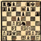
№ 5 (после 9. Фd1—c2)

систему защиты без хода h6, а в дальнейшем (после равна на e3) развивают слона e8 посредством b6 и Сb7 с послужающим e6—e5. Этот план проводили, например, черные в партиях Авлаторцев—Капабланка и Левенфиш—Штальберг. Партия же Штальберг—Ласкер развивалась следующим образом: в позиции, изображенной на диаграмме № 5, черные сыграли 9... Ке4—f6, на что последовало 10. Сf1—d3 d5: e4 11. Cd3: e4 e7—e5 12. 0—0 Kb8—e6 13. Af1—d1 Се8—d7=. Еще своеобразнее развивалась партия Левенфиш—Ласкер (см. диаг. № 5): 9... Ке4: e3 10. Фс2: e3 e7—e6 11. Сf1—d3 Kb8—d7 12. 0—0 Af8—d8 13. Af1—c1 Kd7—f8 14. Kf3: e5 Се8—d7 15. f2—f4 f7—f6 16. Ке5—f3 d5: e4 17. Cd3: e4 Cd7—e8 18. Af1—f2 Се8—f7 19. Ce4—b3 Лс8—e8 20. Фс3—a5 b7—b6 21. Фа5—b6 Лс8—c7 22. Af2—c2 Лd8—e8 23. Лс2—e3 б6—e5 24. Фb6—a3 g7—g6(!) и т. д.