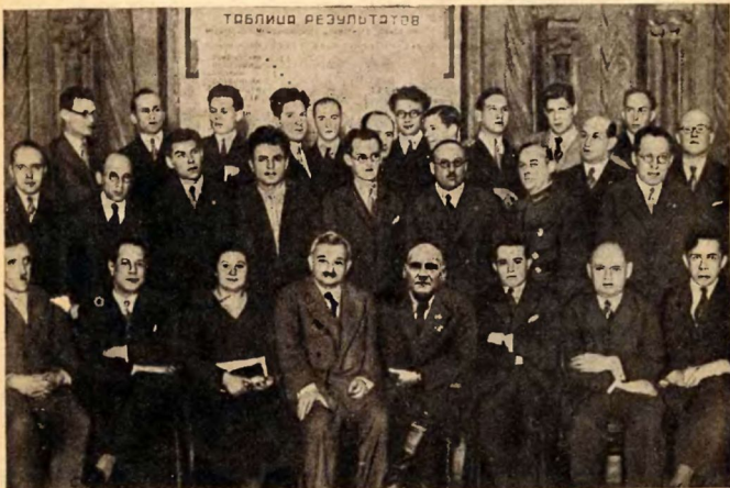
Участники международного турнира и члены оргкомитета во главе с тов. Н. В. Крыленко.