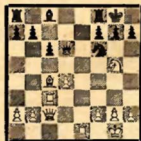
№ 4 (после 16. Kf3—g5)

Положение черных тяжелое. На 16. ... Ф: d4 белые отвечают 17. Le7, а если 16. ... g6, то 17. Фb3 Kd5 (Или 17. ... Фe7? 18. Леc3.) 18. C: d5 с последующим Леc5; если же 16. ... h6?, то 17. K: f7 Л: f7 18. Фg6! Фd7 (После 18. ... Фe7 приводимая далее комбинация решает еще быстрее.) 19. Af3 Kрf8 (Или 19. ... K: d5 20. Л: f7 Ф: f7 21. Le8+.) 20. Л: f6! g4 (Или 20. ... Л: f6 21. Фh7.) 21. Ф: h6+ Kрg8 22. Le3, и белые выигрывают.