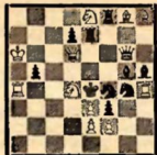
Мат в 2 хода (1. Ла3)

Задача Гвиделли — хорошее произведение в стиле „Good Companion“. В следующем примере эта задача улучшена мною на основе усложнения, сделанного в 1927 году Гартманом. Наконец, композитор Лошинский пошел по пути тематического усложнения механизма Гвиделли еще дальше.