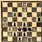
Мат в 2 хода (1. Кг6)

Задача № 5 содержит еще 2 новых варианта с развешиванием ферзя, но, очевидно, что это усложнение темы уже излишне. Оно не стоит того, чтобы на доске было устроено такое столпотворение, как в № 5. Между тем сам Лошинский считает эту задачу одним из лучших своих произведений (!?)