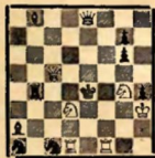
Мат в 2 хода (1. Фс2)

№ 2. Ф. Симхович федерации, 1934. Поч. отам.