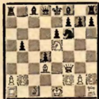
№ 1 (после 13. Фd1—f3!)

Черные поставлены теперь перед трудной задачей. После 13. ... Фd5 14. Ф: d5! К: d5 15. С: b5+ Кр~ 16. Кс6+ и 17. К: d4 белые остались бы с лишней пешкой в видушле, а на предложенный