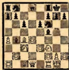
№ 3 (после 8. ... 0—0)

Партия Чехов — Рабинович развивалась далее в соответствии с анализом Кмоха, а именно: 9. Фd1—e2 e6—c5 10. Af1—d1 Kc8—c6 11. d4: c5 (Если 11. d5, то 11. ... e2. K: d5 K: d5 13. C или Л: d5 Фf6.) Фd8—e7 12. e3—e4 Cf5—g4 с хорошей игрой у черных; однако, согласно анализу Белавенца, этот вариант может быть усвоен за белых следующим образом: (9. Фe2 c5 10. Ad1 Kc6) 11. Ke3—a2!; если теперь 11. ... Cb4—a5, то белые добиваются решающего преимущества посредством 12. d4: c5 Фd8—e7 13. Kf3—d4! Фe7: c5 14. b2—b4!!