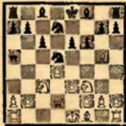
№ 6 (после 8... f7—f6)

Это положение создавалось в партии Штальберг—Шпильман. Белые ответили 9. Сg5—h4, на что последовало: 9... Cf8—b4 10. Лa1—c1 0—0 11. Cf1—A (Лучше все же 11. e4 К: e3 12. be Ca3 13.