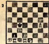
Мат в 3 хода