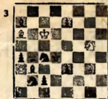
Мат в 3 хода