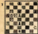
Мат в 3 хода