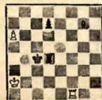
Белые делают ничью