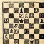
Мат в 3 хода

— Кроме турнира в Швевингене, приводим также таблицу чемпионата Чехословакии, в котором на первое место выиграл Флор и Покорный. Последний отказался от решающего матча, поэтому звание чемпиона присуждено Флору. Весьма любопытно в этой таблице небольшое расстояние между первыми и последними — всего 2½ очка; (в процентах 64 и 41), что показывает весьма ровный состав и вместе с тем высокий класс чехословацких шахматистов.