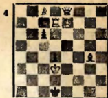
Мат в 4 хода

№ 1 в 1. Лh5 угроза 2. С~ и 3. Ad5×. № 2 в 1. Фe7+ Кrb5 2. b! 1... Кrb4 2. Фe6 1... Кrb3 2. Фe5 1... Кpd5 2. d4 1... Кpd4 2. Фe6, № 3 в 1. Cf4 (шугунг) e6 2. Фd6+ 1... Сb6 2. Ф:b6+ 1... Са2 2. Ф:b2+ 1... e2 2. Фd2+ 1... Kd1 2. К:b3+. № 4 в 1. Фh5 С:h5 2. e8Ф С:e8 3. Лf7