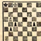
Ход черных. Белые выигрывают