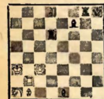
Белые делают ничью