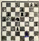
Мат в 3 хода