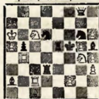
Мат в 3 хода