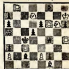
Мат в 2 хода