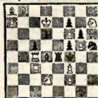
Мат в 3 хода