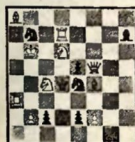
Мат в 2 хода