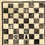
№ 1. М. С. Либуркин Печатается впервые

Выигрыш 1. Kd3 Cb4 2. Kf5+ Kрf6 3. Ke3 e1Ф 4. K:e1 C:e1 5. Kd1, и выигр. 1. Kf5+? Kрf6 2. Kd3 cf2! — ничья