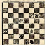
№ 2. Л. И. Куббеля Magyar Sakkvilag

Ничья 1. Kd7+ Kрd6! 2. Cf4+ Kр:d7 3. Cg4+ Kрe8! 4. Ch5 Ф:h5 5. Kf6+ Kрf7 6. K:h5 Kрg6 7. Cg3? K:g3 8. Kf4+ Kр ~ 9. Kd3 Kc4 10. Kcb3! Ka5+ 11. Kрe2!