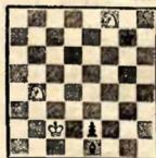
№ 3. М. С. Либуркин

Выигрыш 1. Kf6+ Kрf6 2. Kd3 Cf2 (b4~) 3. Kf4 e1Ф 4. K:e1 C:e1 5. Kd3, и выигр. 1. Kd3? Ch4! 2. Ke6+ Kрf7! ничья.