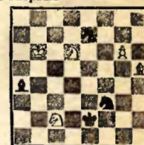
№ 4. М. С. Либуркин Печатается впервые

Выигрыш 1. Kd4+ Kрe3 2. K:f3 K:g6 (2... Cdl 3. g7 C:f3 4. C:f3 6. Kр7 5. Kрe7 Kрf4 6. Kрd8 Kg8 7. Kрe8) 3. Ke4+ Kрf4 (f2) 4. C:g6 Kр:f3 5. Кра5, и выигр. 1... Kрf2 2. K:f3 K:g6 3. Ke4+ Kрe3 4. C:g6 Kр:f3 5. Ke5! и выигр.