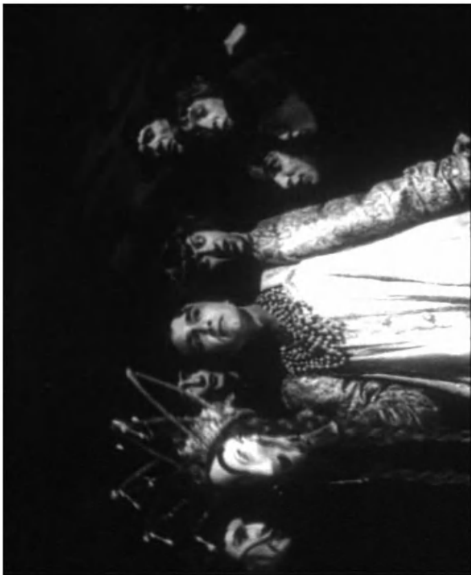
Рис. 1. Кадр из фильма. Федор Басманов в центре