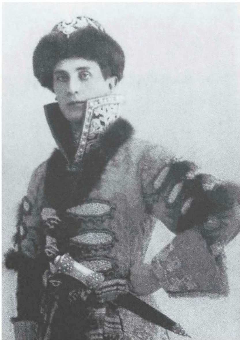
Рис. 3. Князь Феликс Юсупов в боярском костюме