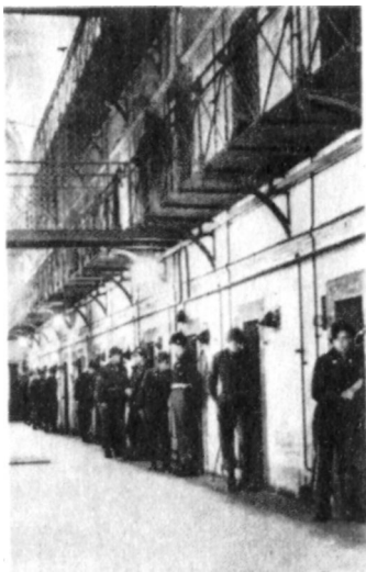
В коридоре Нюрнбергской тюрьмы