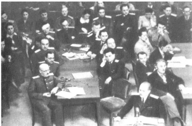
Выступает Главный обвинитель от СССР Р. А. Руденко