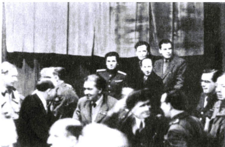
Представители прессы (в центре Илья Эренбург)