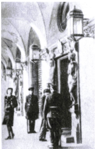
Советские солдаты охраняют вход во Дворец юстиции