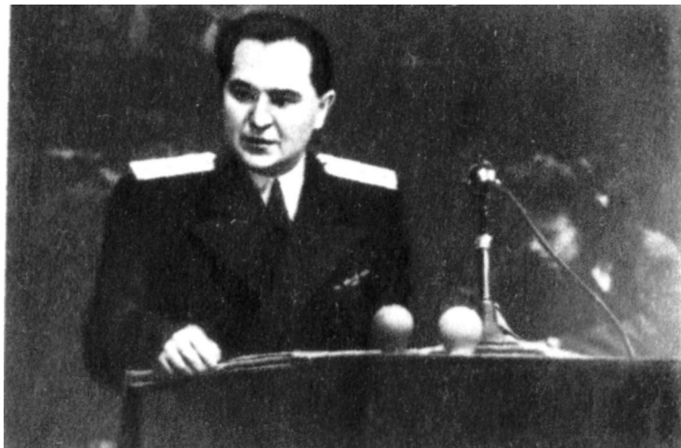
Выступает помощник Главного обвинителя от СССР М. Ю. Рагинский