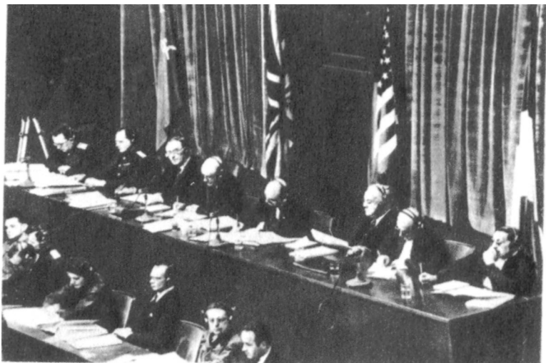
Судьи Международного военного трибунала