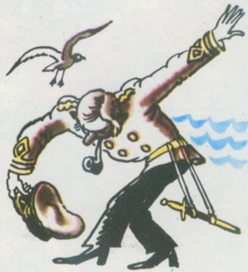
Рис. С. ТЮНИНА

И получить в ответ: «Благодарю вас, друг мой, превосходно! И погода сегодня прекрасная, не правда ли?!»