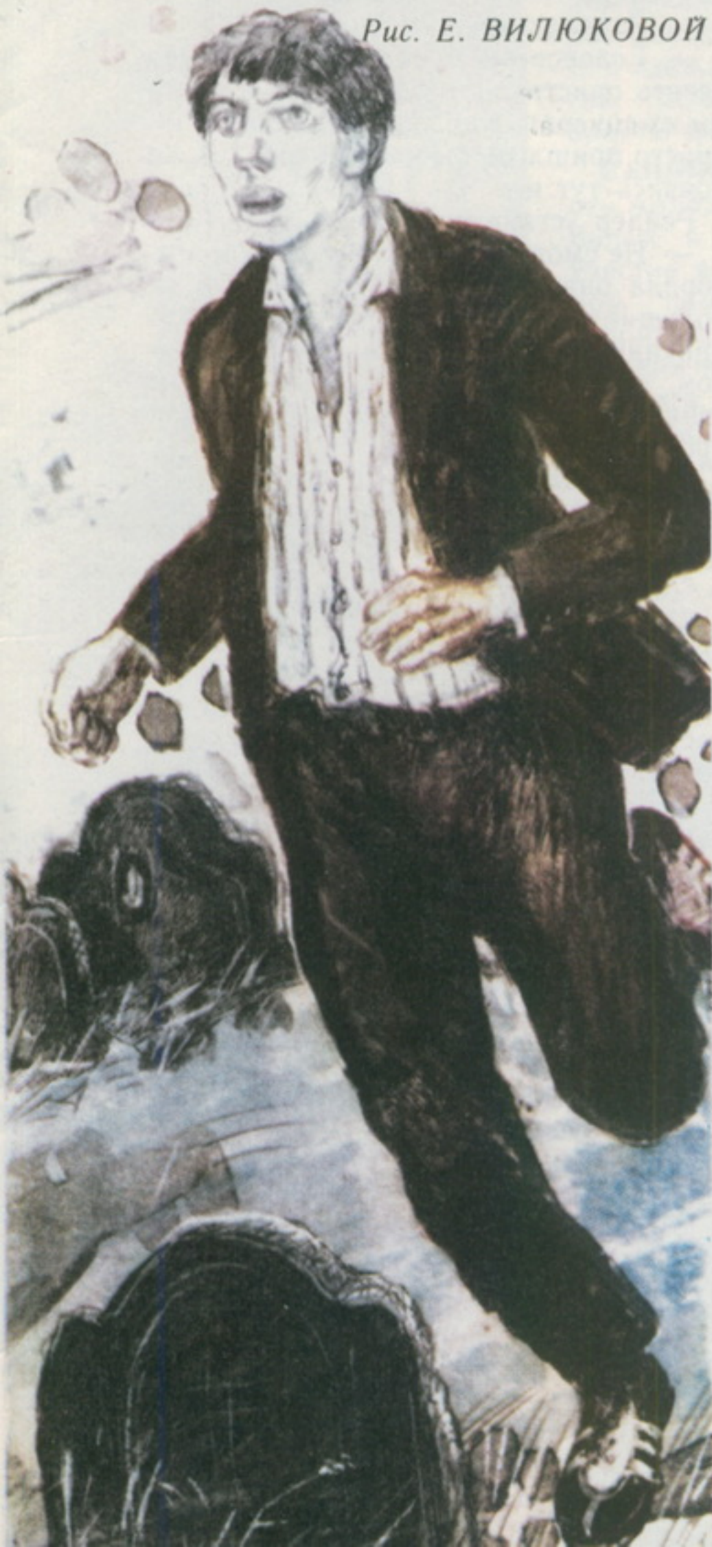
Рис. Е. ВИЛЮКОВОЙ

— Я перевяжу, — предложила миссис О'Делл.