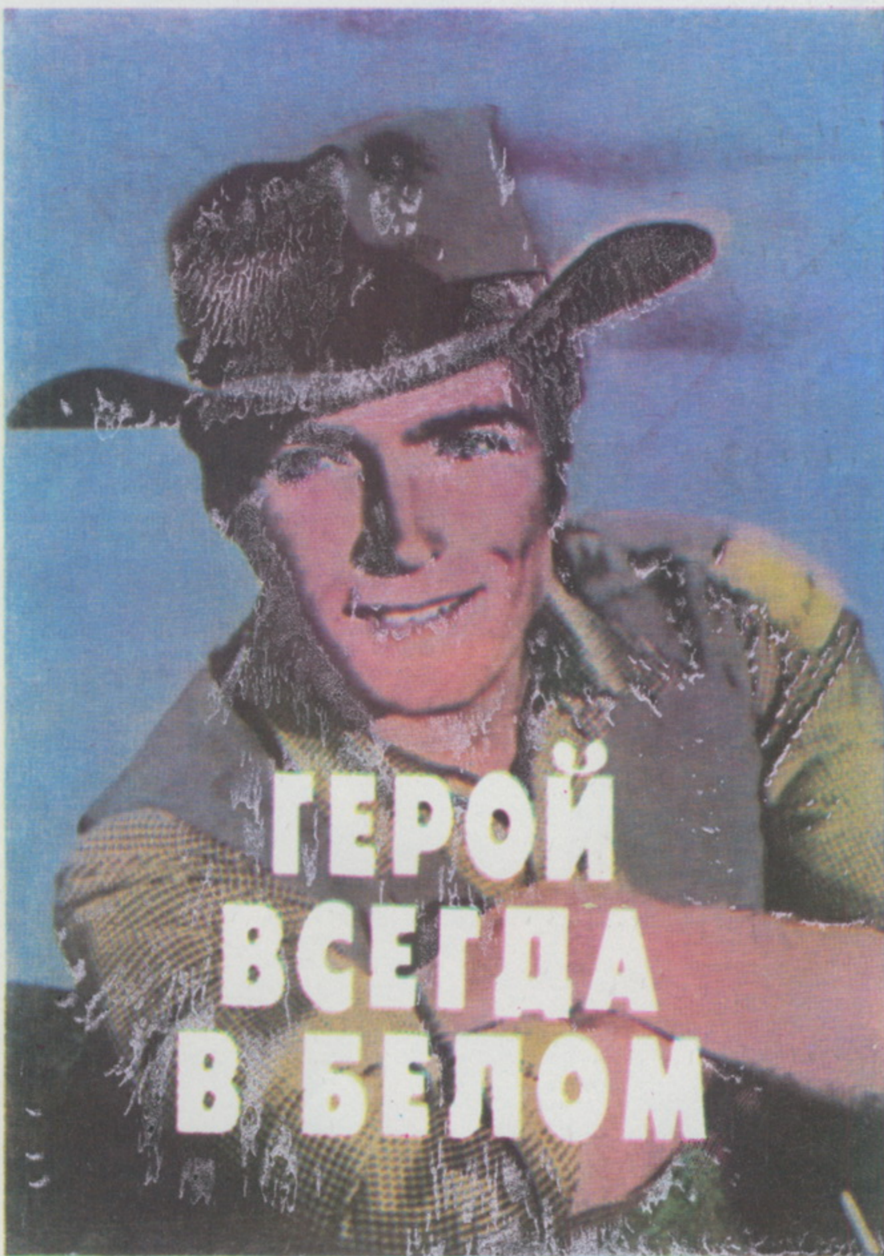
Пол РЭМБЕЛИ, американский журналист

Вот тут-то и начинается сбой от мифа к реальности, к реализму: Шэйн не вознагражден, он уезжает, и не в закат, как положено, а в темную, паршивую ночь.