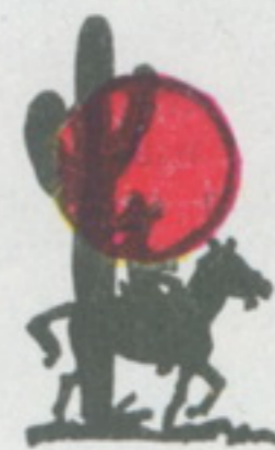
Перевела с английского Н. РУДНИЦКАЯ

А не кажется ли вам, что каждые четыре года вся Америка участвует в колоссальном общенациональном вестерне? Хорошего парня в белом зовут Президент.