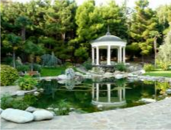
Вечер информантников проходил в беседке, расположенной в реликтовой маслиновой роще

ми лесистые холмы сменяются горами. Выходите и понимаете, что вы в раю. Над головой шумят листья, шелестит бамбук, под вашими окнами – кактусы и агава, а вдалеке пенные волны глядят морду Медведь-горы.