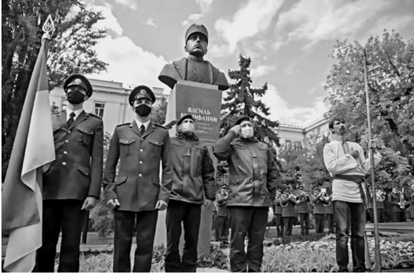
Торжественное открытие памятника Василю Вышиваному (Вильгельму Габсбургу) 20 мая 2021 г. в Киеве у станции метро «Лукьяновская».

ской армии и командиром так называемого легиона Украинских сечевых стрельцов 2 .