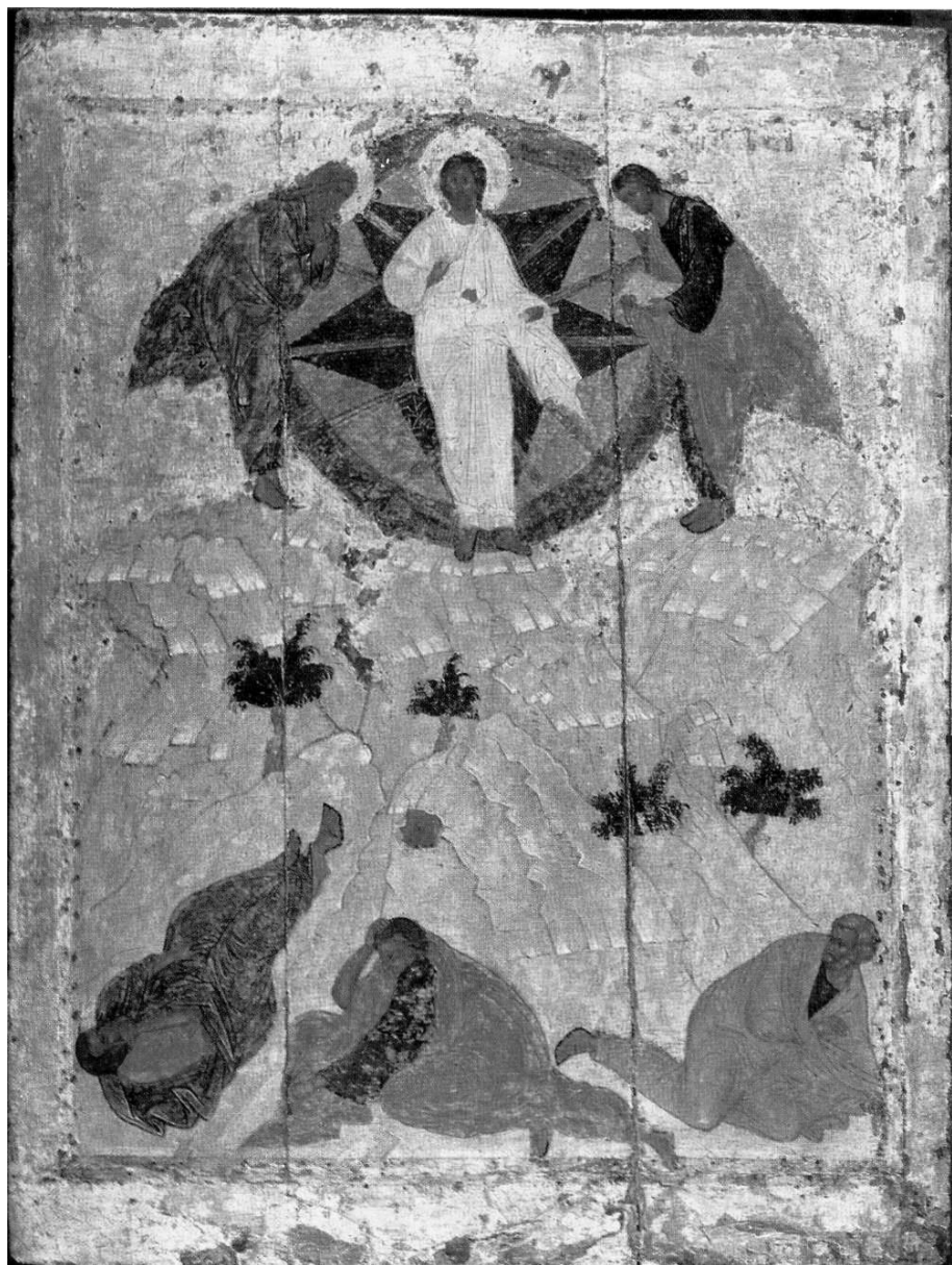
Рисунок 3. Андрей Рублев. Преображение.

Хотя пространственно эти две группы людей находятся совсем рядом, уже видно, что одни Небесные, пришедшие свыше, а другие — земные. Апостолы как будто прижаты к земле и не могут от неё оторваться. Но они лишь временно не могут взойти к Горним,