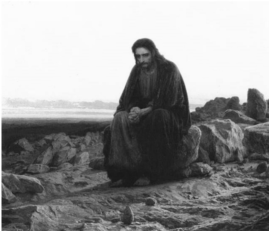
Рисунок 1. Крамской И.Н. Христос в пустыне.

Сатана спешил в личном поединке одолеть человека Иисуса Христа. Он самоуверенно надеялся на быструю победу в самом начале служения Мессии. Надеялся, исходя из того, что до сих пор ни один человек не смог противостоять его напору и соблазнам. Но он ушёл посрамлённым – и это была первая победа человека над дьяволом.