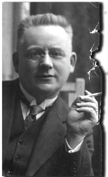
Единственная сохранившаяся фотография моего горячо любимого дяди.