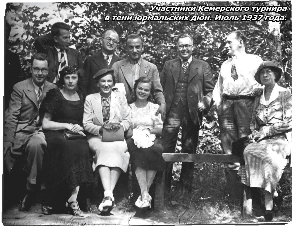
Участники Кемерского турнира в тени юрмальских джун. Июль 1937 года.

Более близкое знакомство с Паулом произошло таким образом: Петров был занят отложенной партией, а я, взяв книгу, отправилась в парк, который расстилался сразу за гостиницей. Это был роскошный громадный парк, переходящий в густой лес. Гуляя, я наткнулась на секретаря Кереса, который озабоченно всюду его разыскивал. Узнав, что Кереса я не встречала, он шмыгнул в боковую аллею, а я пошла дальше и, зайдя почти в гущу леса, вдруг увидела в укромном месте на скамейке Кереса. Он как будто прятался от всех. Я вынуждена была сказать о секретаре, а он, мило улыбнувшись, просил его не разоблачать, хочет отдохнуть один.