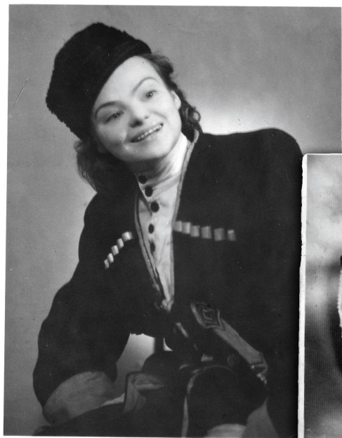
В корпорации я была «magister-cantandi» и звали меня «певунья-плясунья».

пройденных путей-дорог, и «щепоточкой соли» кто-то преждевременно украсил волосы. Мои слова о том, как хорошо живется на свете, напонила через много лет, вернувшись с далекого севера инвалидом, моя горячо любимая, когда-то красавица мать.