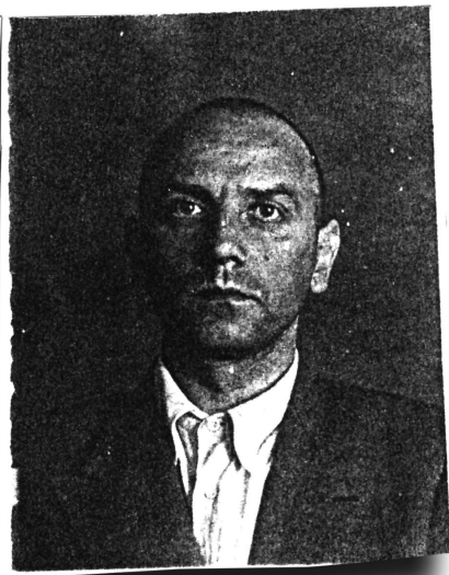
Фотография из дела...

Оказывается, он был известнейший шахматист Латвии — гроссмейстер. В 1920–1939-е годы выступал на многих турнирах: в Париже, Гааге, еще где-то. После вхождения Латвии в СССР служил переводчиком в армии (знал несколько языков). Во время войны участвовал в турнирах в Свердловске, в Поволжье. В общем, следователь имел «бескрайнее поле деятельности», чтобы обвинить его не только по статье 58.10, но и в контактах с иностранцами, и в шпионаже в армии, и в чем хотите... При минимальной его фантазии хватило бы на десятерых.