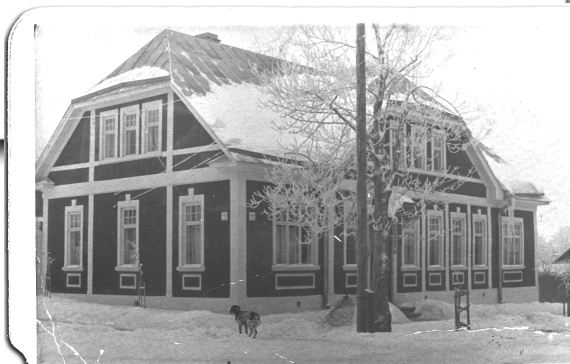
Отчий дом на Дарзу, 18 в Резекне.

сам он любил шутить и посмеиваться — но на шутки, даже безобидные, над ним самым реагировал болезненно.