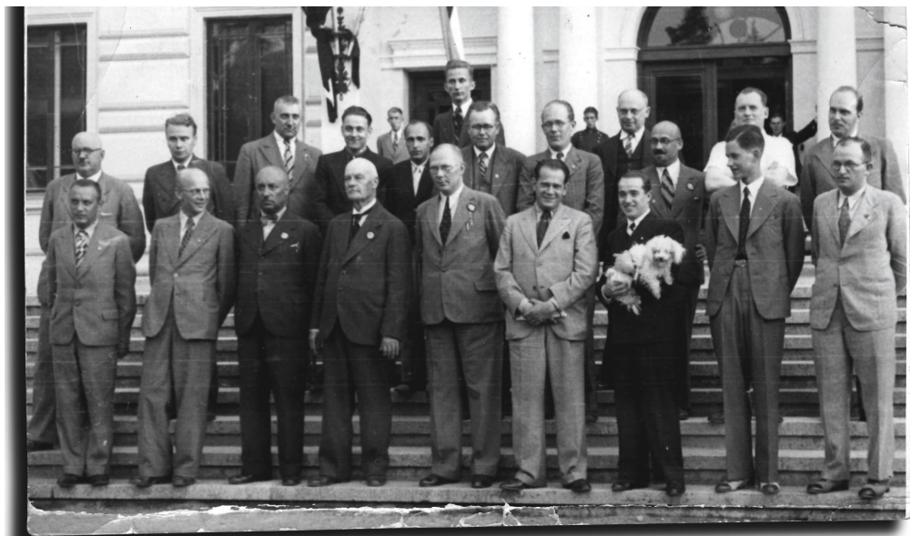
Организаторы и все участники турнира в Кемери. Июнь 1937 года.