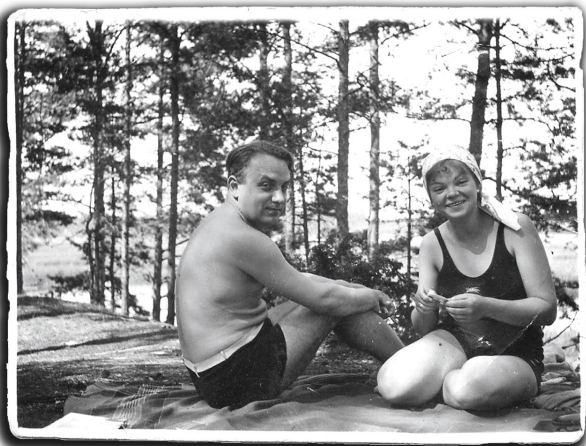
На отдыхе в августе 1938 года.