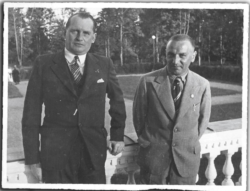
Алехин и Петров до начала Кемерского турнира на террасе гостиницы «Кемери». Лето 1937 год.