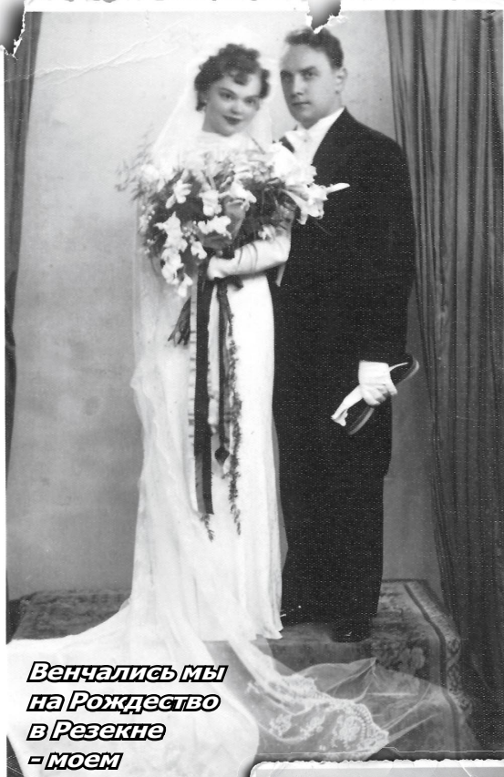
Венчались мы на Рождество в Резекне - моем родном городе.

Эту Олимпиаду в Стокгольме, по словам Володи, нельзя было считать особенно ценным мероприятием в шахматном смысле: огромное количество участников заставляло организаторов придерживаться такого темпа игры, который фактически полностью исключал творческий момент, и установленное время на обдумывание — два с половиной часа на 50 ходов — в большинстве случаев не способствовало участникам показать идейно богатую и обдуманную игру. Так что состязания в «Метрополе» Швеции проходили в очень трудных условиях. Каждый день участники турнира играли по две