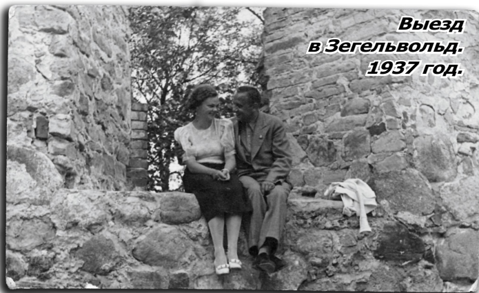
Выезд в Зегельвольд. 1937 год.