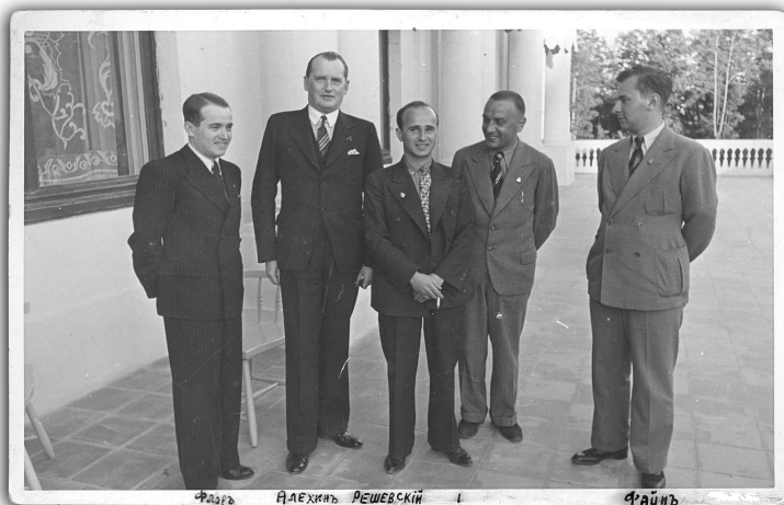
Фавориты Кемерского турнира.