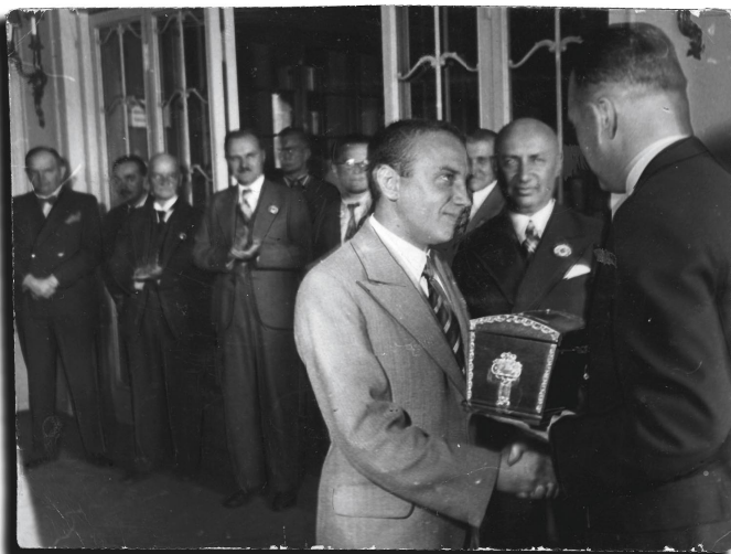
Вручение призов: серебряный кубок от семьи Нимцовича, инкрустированные янтарем шахматы - от президента Латвии Карлиса Улманиса.