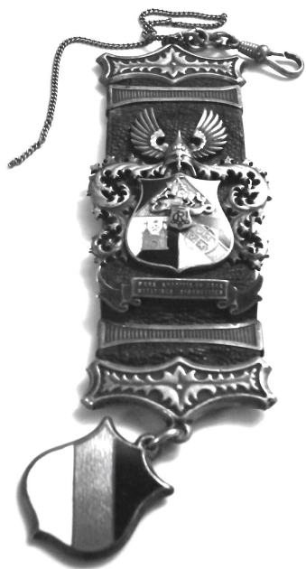
Берципфель - широкая кожаная подвеска для карман- ных часов.

уже играют в шахматы. Иллюзию эту необходимо рассеять, ибо шахматы — особенное искусство. Оно обильно насыщено элементами борьбы. Шахматы как искусство имеют свои законы и основы, которые необходимо постоянно изучать. Если же рассматривать шахматы как эстетическую борьбу, то им свойственна необычная интуитивная логика. Шахматная интуиция — это что-то необъяснимое, своеобразное, но в то же время она может руководить каждым при условии, что обучением шахматному искусству руководит высококвалифицированный тренер».