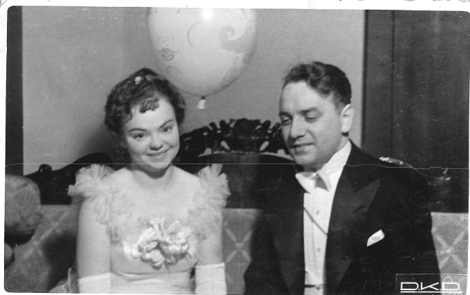
На главном событии студенческого 1936 года - Татьянинском балу.

Особенно в памяти остались русские студенческие Татьянинские балы. В их устройстве деятельное участие принимали корпорации. Мы, все корпорантки, должны были быть в белых длинных платьях, длинных лайковых перчатках. Студенты — во фраках и тоже в белых перчатках. Бал открывался полонезом, которым