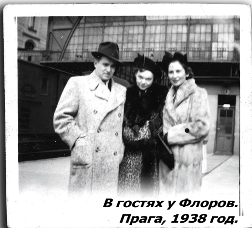
В гостях у Флоров. Прага, 1938 год.