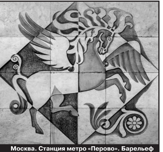
Москва. Станция метро «Перово». Барельеф

весьма загадочных обстоятельствах — председателем Совета Министров СССР Косыгин, главный идеолог ЦК КПСС Сусллов, Генеральный секретарь ЦК КПСС Брежнев, члены Политбюро ЦК КПСС Пельше и Рашидов, министр обороны Устинов, четыре министра обороны других стран Варшавского блока, министр внутренних дел Щёлков и, наконец, председатель КГБ СССР и Генеральный секретарь ЦК КПСС Андропов. Черненко в этот список не входит, так как его явно избрали только для того, чтобы выиграть время и подготовить из-