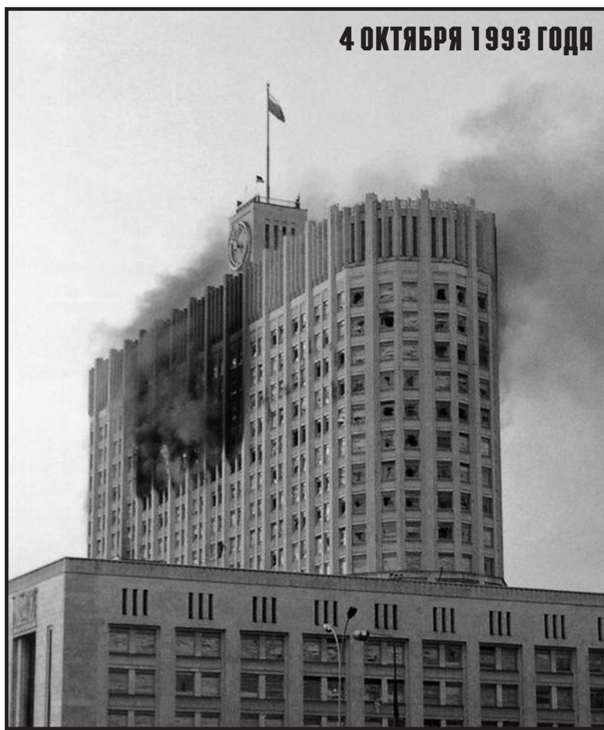
4 ОКТЯБРЯ 1993 ГОДА