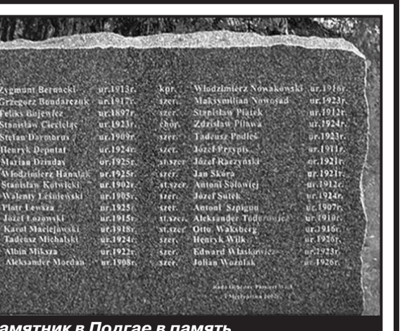
Памятник в Подгале в память о сожжённых заживо 32 польских солдатах