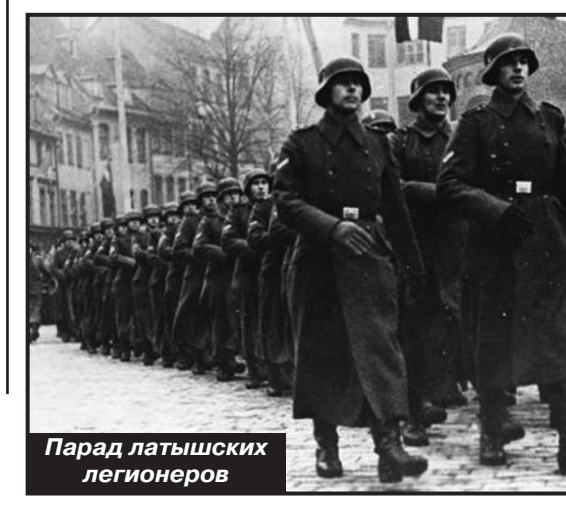
Парад латышских легионеров

Сами гитлеровцы никогда не считали членов национальных формирований СС равными чистокровным немецким эсэсовцам. Современные западные историки любят использовать этот аргумент, доказывая, что подразделения вроде Латышского легиона СС или