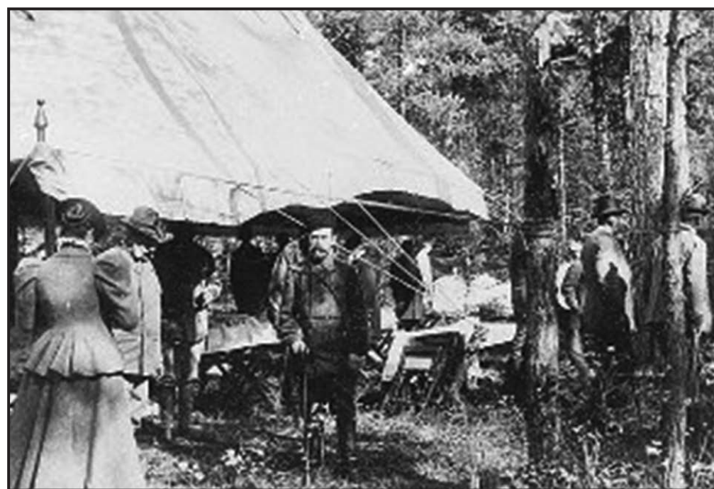
вещании. Последнее вполне соответствовало взглядам и желанию Гурко. Так совещание и было Государём закончено. На нём было решено провозвести весной 1917 года общее наступление, причём главный удар предполагалось нанести армией генерала Брусилова.

А просто: «Затем Государь сообщил генералу, что он предполагает сказать в виде заключительного слова на со-