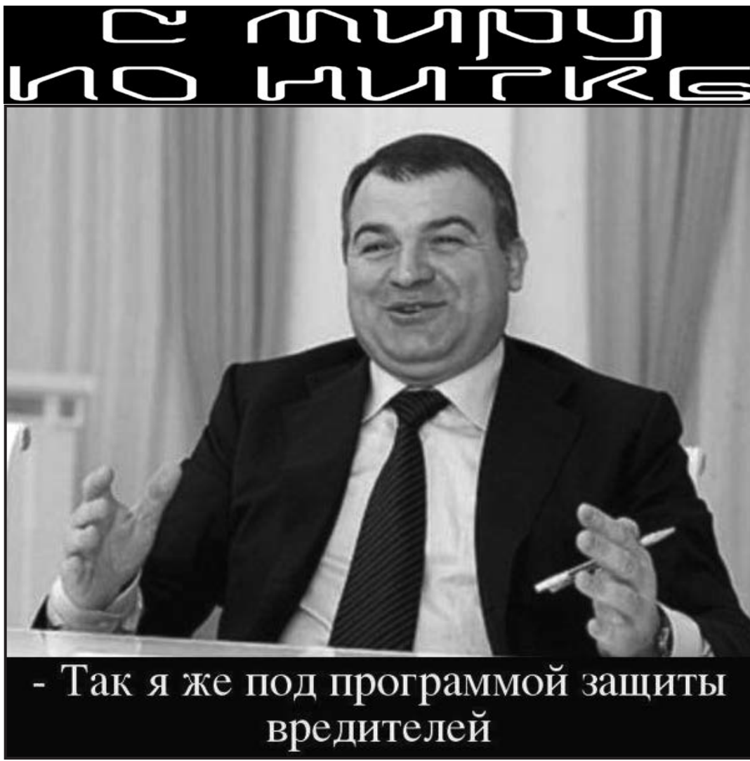
- Так я же под программой защиты вредителей

А Медведев при этом торжественно, как он уже научился, утверждает, что правительство ни на йоту не ухудшит социальное положение народа.