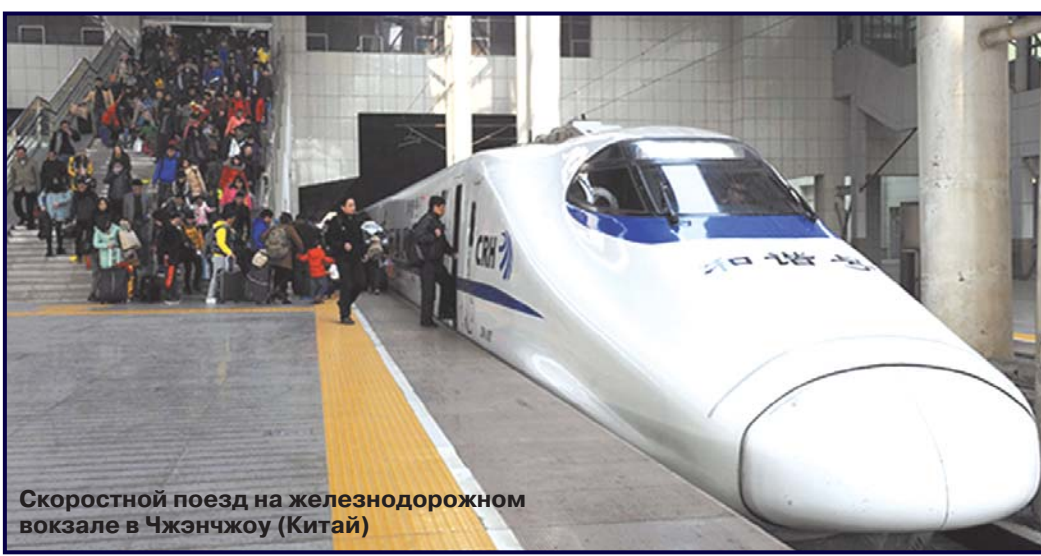
Скоростной поезд на железнодорожном вокзале в Чжэнчжоу (Китай)

пример, в виде доступа к дешёвым государственным кредитам; остальные же платят штраф и дешёвые деньги не имеют. Такое сочетание позволяет получать максимальные выгоды от преимуществ как плановой, так и частной систем при взаимном нивелировании их недостатков.