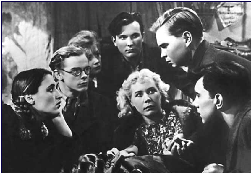
ВОТ ЭТО — МОЛОДАЯ ГВАРДИЯ!

Всем смущённым сериалом предлагаю озабиться здравым смыслом и подумать над фактами, которые я почерпнул не откуда-нибудь, а из этого же кино. Фальсификаторы истории даже работу, за которую им платят, не могут выполнить без проколов.