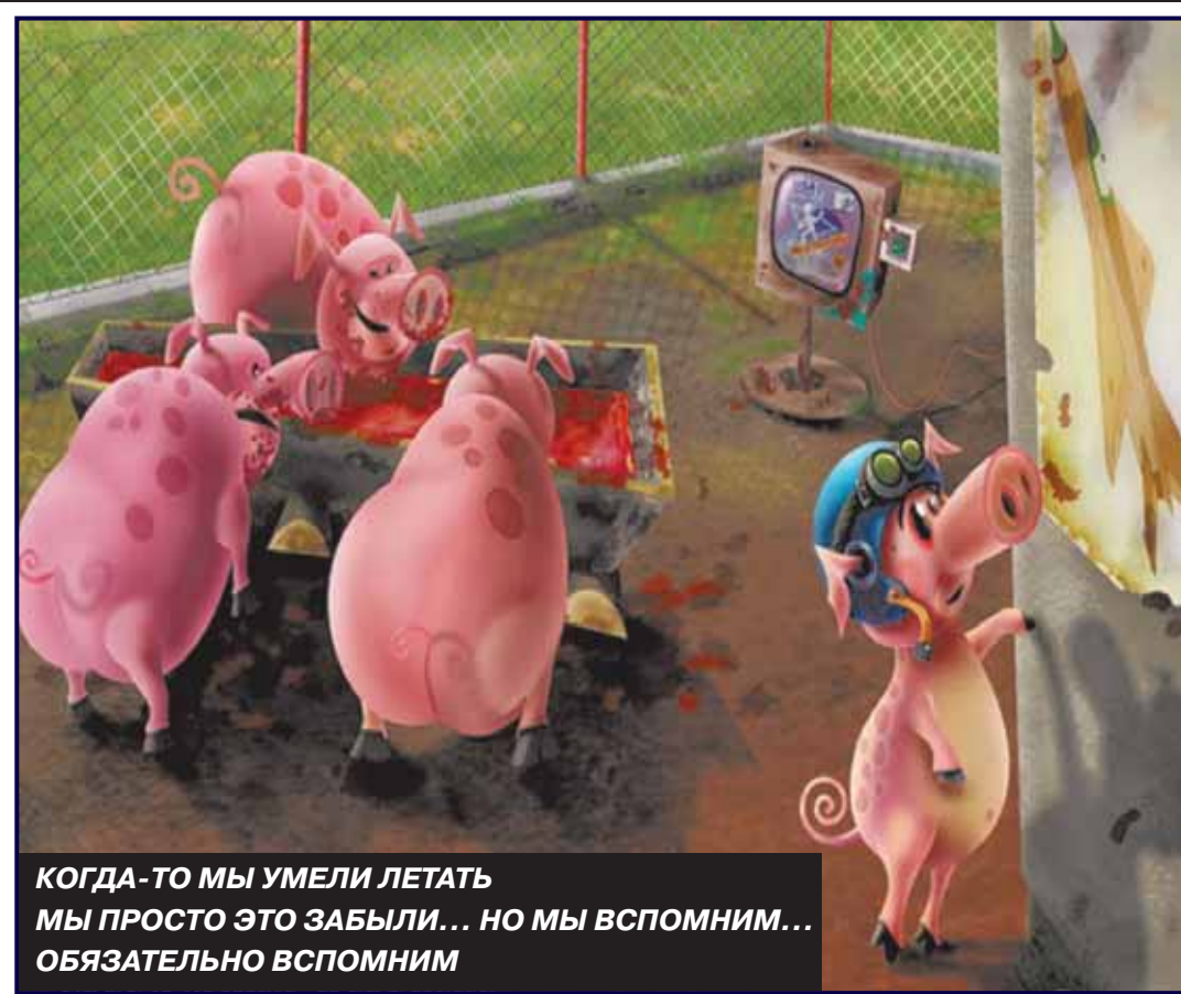
КОГДА-ТО МЫ УМЕЛИ ЛЕТАТЬ МЫ ПРОСТО ЭТО ЗАБЫЛИ... НО МЫ ВСПОМНИМ... ОБЯЗАТЕЛЬНО ВСПОМНИМ

Теперь вынужден прокомментиовать этот «приговор» автор. Могла бы настоящая мать сказать такое в адрес своих пропажающих детей? Тем более катастрофическое убывание россиян - это следствие таковой жизни, которую устроили новые хозяева своему народу, а не причина! По Новодворской же выходит ещё круче: власти не надо беспокоиться, чтобы мешать «своему» народу: одним спиваться, другим - спавивать, третьим - воровать, четвёртым - убивать, пятым - охмурять... Кто победит в такой свободной и беспредельной борьбе за спасение и выживание? Конечно же, зубастый, лысый, подлый, коварный и озверевший!..