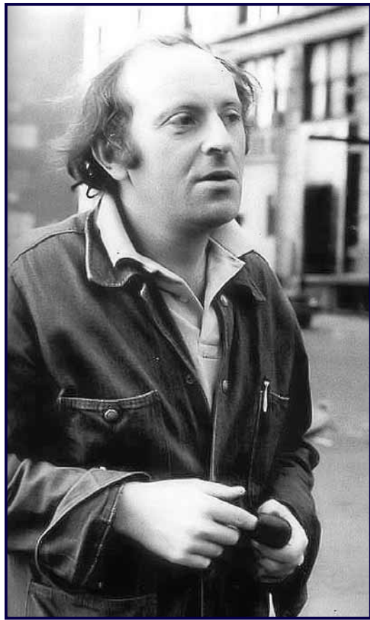
Чёрного кобеля не отмоешь до белая Поговорка Вы, что, с ума сошли, что ли? Владимир Путин, президент Российской Федерации