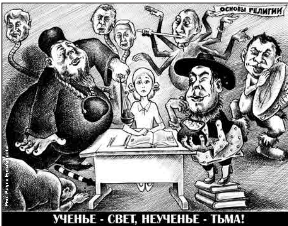
УЧЕНЫЕ - СВЕТ, НЕУЧЕНЫЕ - ТЬМА!

2. Какова роль академиков. В упрощенном смысле эта роль понимается как положение в научной иерархии, достигнутое при карьерном научном росте. Однако это субъективный подход к проблеме. Развивая его, можно со стороны брачного рынка