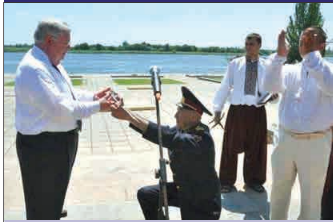
Украинский генерал преподносит американскому послу шашку. В подобных случаях на колена должен стоять получающий оружие.