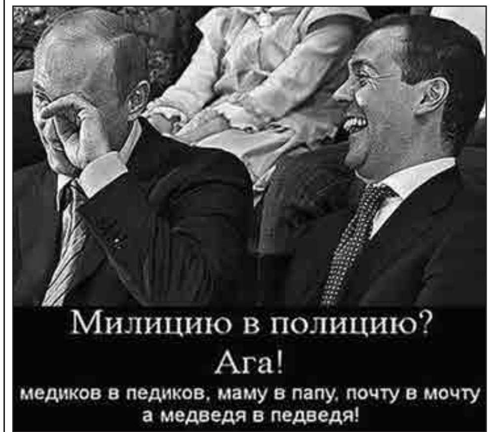
Милицию в полицию? Ага! медиков в педиков, маму в папу, почту в мочту а медведя в педведя!

Коломойского в России возбуждено уголовное дело. Международный аэропорт «Бельбек» в Севастополе также принадлежит Коломойскому («СР», 5.08.2014). «Шоколадный король» Порошенко, называемый на Донбассе Потрошеном, имеет в Лисецке кондитерскую фабрику и другой бизнес в Эрэфии. А возглавляемый Германом Грефом Сбербанк успешно работает на Украине и