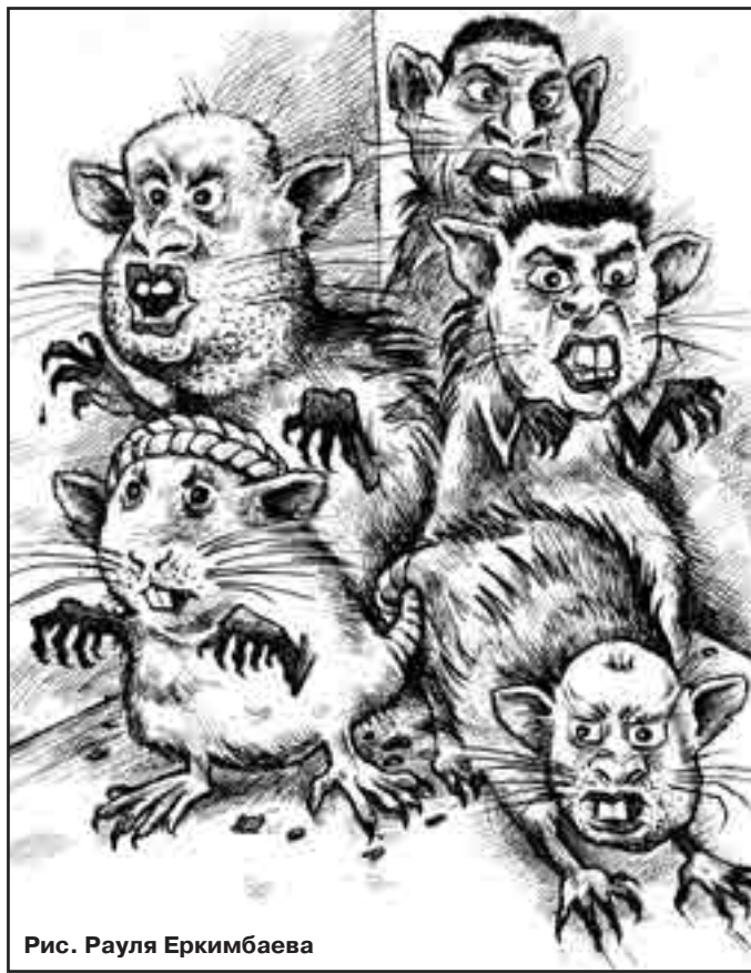
Рис. Рауля Еркимбаева