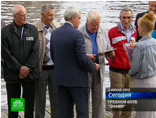
Советские гребцы: все они были уничтожены репрессивной машиной в 1952 году

Встреча футбольных команд СССР и Югославии проходила достаточно драматично для спортсменов СССР. К концу первого тайма был зафиксирован счет 4:0 в пользу команды Югославии. Второй тайм советские футболисты бились до последнего, и вот уже счет 5:0 в пользу Югославии, но команда СССР не сдаётся. Удача не оставила советских футболистов, и на 75-й минуте гол забивает Василий Трофимов, затем на 76-й минуте удачно проводит комбинацию Всеволод Бобров, на 78-й минуте снова отличился Всеволод Бобров, и на последней минуте комбинация проведена Василием Трофимовым и Александром Петровым, который и забил пятый гол в ворота Югославии. Матч закончился ничьей, было выделено дополнительное время — 10 мин., в течение которых ни одной команде не удалось провести решающий гол. Через сутки была назначена переигровка, в которой преимущество показала футбольная команда Югославии. Проигрыш для команды имел очень серьезные последствия... ВСЕ ФУТБОЛИСТЫ БЫЛИ РАССТРЕЛЯНЫ!