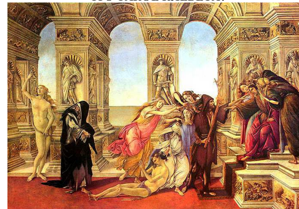
Сандро Боттичелли. Аллегория клеветы