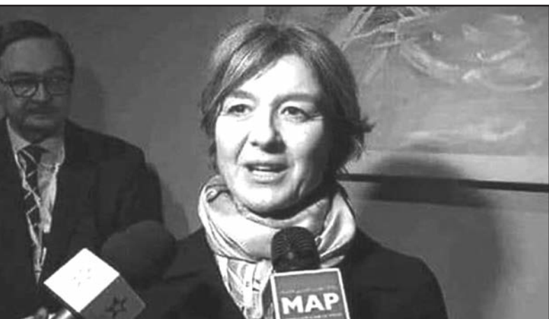
Испанский биолог: вы даёте футболисту миллион евро в месяц, а учёному-биологу 1800 евро. Теперь вы ищите лечение. Идите к Роналдо и Месси - они найдут вам лекарство.

Тем не менее ситуация далека от благополучной: в 2018 году туберкулёзом заразился около 10 млн человек. При этом около 3 млн больных туберкулёзом не получают необходимого лечения и ухода. В большой степени это связано со слабостью систем здравоохранения и дорогостоящей медициной. В странах с наиболее высоким уровнем туберкулёза 80 процентов населения тратят на его лече-