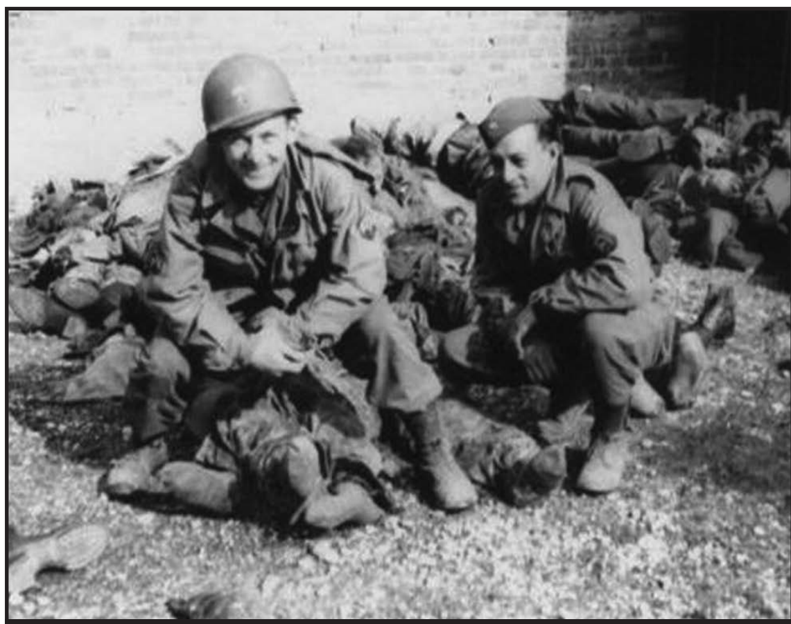
Американские солдаты из 45-й дивизии пехоты США позируют на трупах только что расстрелянных

Согласно лондонской «Международной Службе Новостей» от 31 января 1946 года, когда жёны американских солдат приехали в Герма-