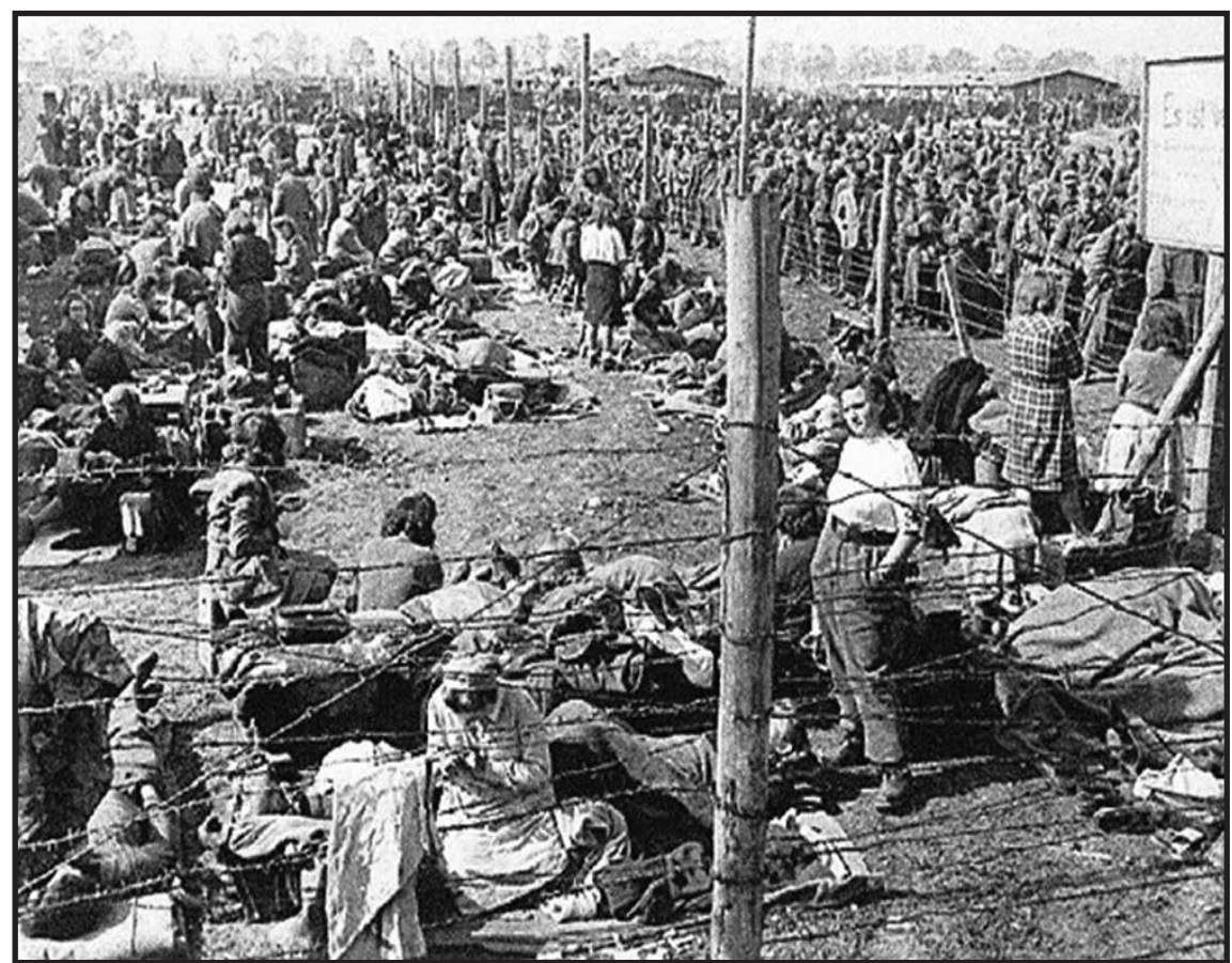
Пленные немцы и немки

что грабил в Париже союзные склады снабжения и обычных жителей.