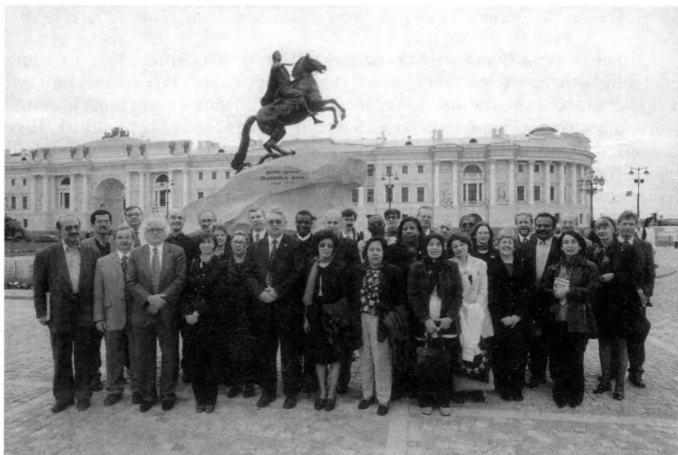
Участники заседания исполкома МСА на экскурсии по городу

Специально для участников встречи Российский государственный исторический архив организовал эксклюзивную выставку раритетов, по-