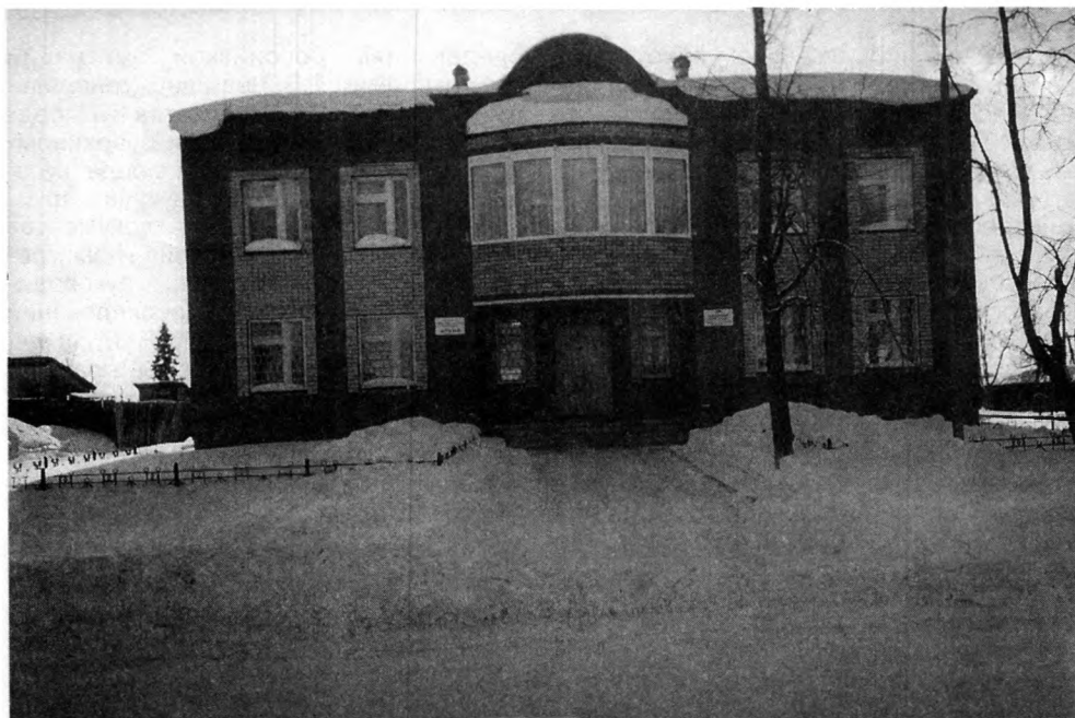
Новое здание муниципального архива и отдела ЗАГС

(1-й этаж) и отдела ЗАГС (2-й этаж). На торжественной церемонии выступили глава объединенного муниципального