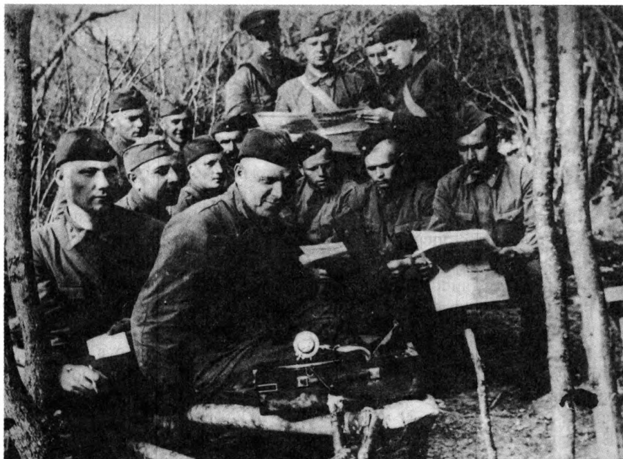
Личный состав 3-й минометной роты 31-го стрелкового полка 25-й Чапаевской дивизии в минуты затишья. Севастополь, апрель 1942 г. № 0 - 274637

В редкие свободные минуты солдаты писали письма домой, иногда пели свои национальные песни под нехитрый аккомпанемент. <...> Письма в эти дни приходили нечасто. <...> Если раньше почта доставлялась почти каждый день, то теперь - лишь два раза в неделю. В феврале - марте одиночные транспорты ходили под охраной лидеров, эсминцев и катеров, а сейчас только воен-