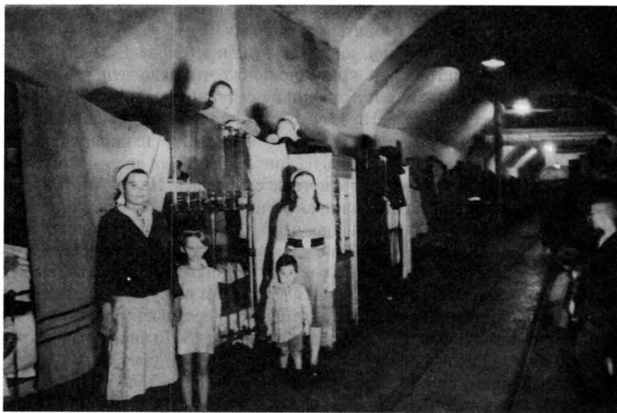
Подземное общежитие рабочих 2-го спецкомбината. Севастополь, май 1942 г. № 0 - 144400