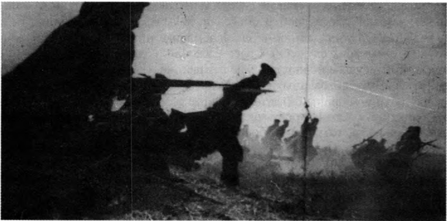
Черноморцы атакуют врага на подступах к городу. Севастополь, декабрь 1941 г.