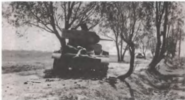
Разбитые советские танки БТ-7

В результате 8 июля 14-я танковая дивизия РККА с утра приводила себя в порядок, эвакуировала с поля боя и буксировала в ремонт подбитую технику (на сборные пункты аварийных машин армии и дивизии отправлено 23 танка) и готовилась к новым атакам в общем направлении на Лепель. Но в 14.00 дивизия получила приказ и выступила двумя колоннами на юго-запад, с задачей нанесения удара во фланг и тыл наступающих на Оршу немцев. Глубина задачи была 100 км. 8—9 июля дивизия с боями выдвигалась для исполнения этого приказа ( «14 ГАП уничтожил взвод мотоциклистов» ), но в 18.00 9 июля дивизию остановил новый приказ — немцы с севера ворвались в Витебск и вышли на дорогу Витебск — Смоленск за Витебском. Со стороны Лиозно это направление защищал только начавший сосредоточиваться и разгружавший свои дивизии 34-й стрелковый корпус.