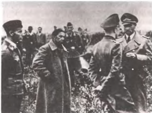
«Сына Сталина» показывают зевакам