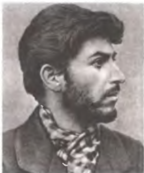
И.В. Сталин, 10-е годы прошлого века

в Москве». На самом деле немцы, переведя автобиографию из найденного ими личного дела Якова, не сумели понять разницу между инженерной специальностью Якова и его должностью на электростанции. На самом деле его специальность не «турбиностроение», а теплотехника, он инженер-теплотехник, поскольку закончил выделившийся из МИИТа Московский электромеханический институт инженеров железнодорожного транспорта им. Дзержинского, а на железной дороге турбины нужны, как корове седло.