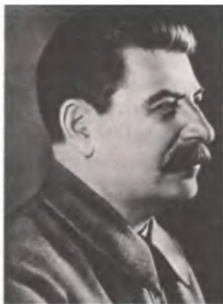
И.В. Сталин, 30-е годы

ного руководящего органа вопрос по металлургии (а Политбюро решало практически все вопросы страны), тебе нужно учебники брать или на заводы ехать разбираться с подробностями, чтобы принять нужное решение, а это время тратить, умственные извилины напрягать. А тут берешь и посылаешь вопрос Сталину — пусть он разбирается, пусть он тратит время, он же вождь, а ты в субботу — на охоту. А потом голосуешь за предложение Сталина, поскольку «веришь вождю», и, кстати, веришь не без оснований, поскольку Сталин действительно разобрался с твоим вопросом. Представляете, как удобно иметь вождя? Сколько сил это экономит и сколько славы приносит: мы! члены Политбюро! Решили!