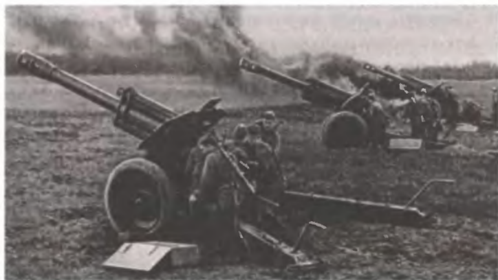
Огневая позиция батареи

Противник, видя, что по нему ведет огонь гаубичная артиллерия, начинает охотиться за НП командира батареи, и даже если сразу не найдет его, то начинает своими орудиями обстреливать все места, на которых может находиться НП. Делается это для того, чтобы осколками порвать телефонную линию, тогда командир батареи вынужден будет связываться с батареей по радио. А радио противник быстро запеленгует и будет бить уже точно по НП. То есть командир батареи должен иметь достаточно мужества, чтобы в условиях постоянно рвущихся вокруг снарядов противника наблюдать за полем боя, точно рассчитывать данные для стрельбы своей батареей