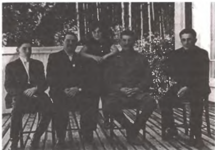
И. Сталин, А. Жданов и дети Сталина

все неумышленно. Но это был такой урок, что с тех пор я даже газету порвать не могу. И у Василия трепетное отношение к книгам сохранилось до конца жизни.