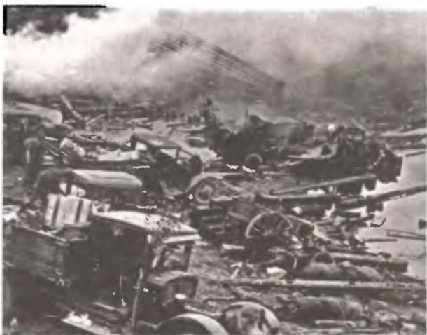
Разбитая колонна советской техники

по всему, они в этот же день вышли и из второго окружения, но много севернее 14-й танковой дивизии — в районе города Духовщина. По крайней мере о 14-м ГАП за этот же день 16 июля сказано: «В районе Духовщина уничтожил 3 автомашины с пехотой противника и 1 миномет» . Командованием 20-й армии второй батальон 14-го мотострелкового полка и часть тылов ГАП (7 автомашин) были переданы 153-й дивизии, а штаб мотострелкового полка с остальными подразделениями этого полка и ГАП прибыл в распоряжение дивизии только 23 июля.