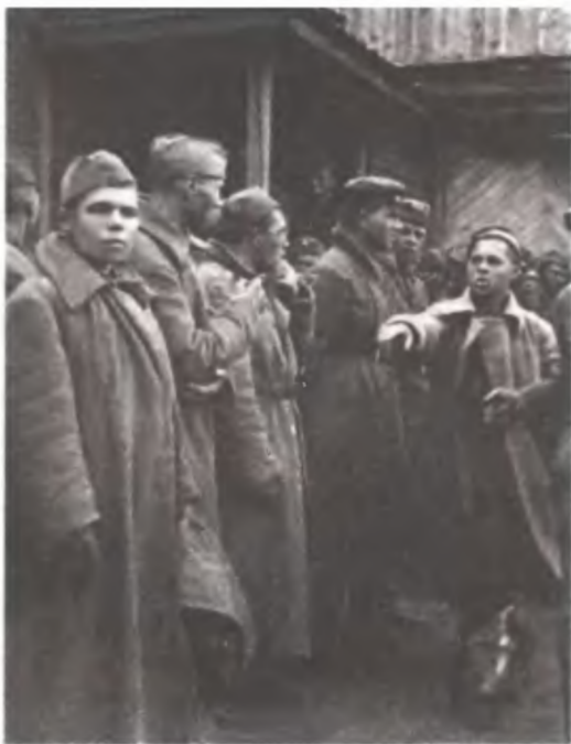
Ищут комиссаров и политруков

взятых в плен солдат. Комиссары в качестве солдат не признаются; никакая международно-правовая защита к ним не применяется. После произведенной сортировки их надлежит уничтожить».