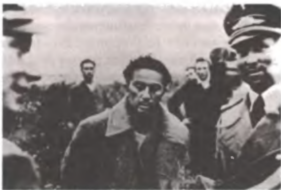
«Сын Сталина» в штабе Клюге

ды независимо от того, пленили они его или нет? Они ведь в штабе командующего разведывательной авиацией группы армий «Центр» устроили шоу с показом массе зевак «сына Сталина», а длилось это шоу два дня. Сотни немецких военнослужащих, воочию видевших «сына Сталина», разнесли эту весть по немецким соединениям лучше, чем берлинское радио. А с точки зрения пропагандистского эффекта уже этого было вполне достаточно. Ну, а когда выяснилась судьба Якова, то тогда немцам уже можно было начать эту пропаганду и на советские войска и население. Но о деталях этих шоу позже.