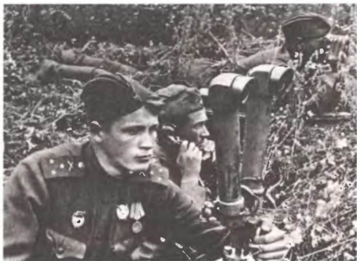
Командир батареи на наблюдательном пункте (НП)

реи бывают расположены не очень далеко, в результате с наблюдательного пункта могут быть видны сполохи от выстрелов и доноситься звук выстрела. По секундомеру (если вы помните, в последнем письме Яков просил жену прислать ему часы с секундной стрелкой) замеряется разница во времени между вспышкой выстрела и звуком выстрела, затем умножением этого времени на скорость звука получают расстояние до вражеских орудий и по карте определяют квадрат, в котором находятся огневые позиции вражеской батареи. Определив ее координаты, командир батареи направляет в этот квадрат огонь орудий своей батареи и этим давит вражескую батарею — либо уничтожает ее орудия, либо разрывами своих снарядов не дает вражеским расчетам из них стрелять.