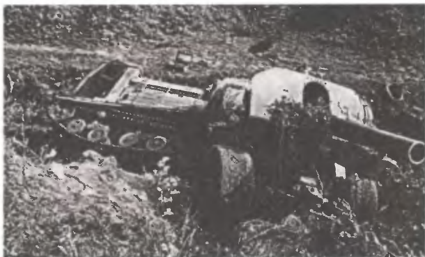
Гаубица М-10 с тягачом

14-я танковая построила оборонительные рубежи, когда сосредоточивалась там до 4 июля. Чтобы не дать немцам помешать этой передислокации, 10 июля «был отдан приказ 14 МСП и 14 ГАП с группой танков 28 ТП нанести короткий удар в западном направлении с задачей: отбросить противника в западном направлении и дать возможность главным силам корпуса отхода за р. Лучеса» . В этих боях 11—12 июля при отходе на новые рубежи в район Лиюзно 2-й дивизион 14-й ГАП, в котором служил Яков Джугашвили, потерял от бомбежек немецкой авиацией одну 152-мм гаубицу М-10 с трактором.