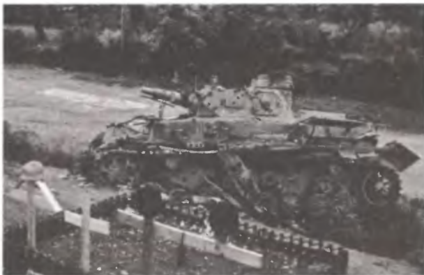
Уничтоженный немецкий танк Т-IV. На переднем плане могила экипажа