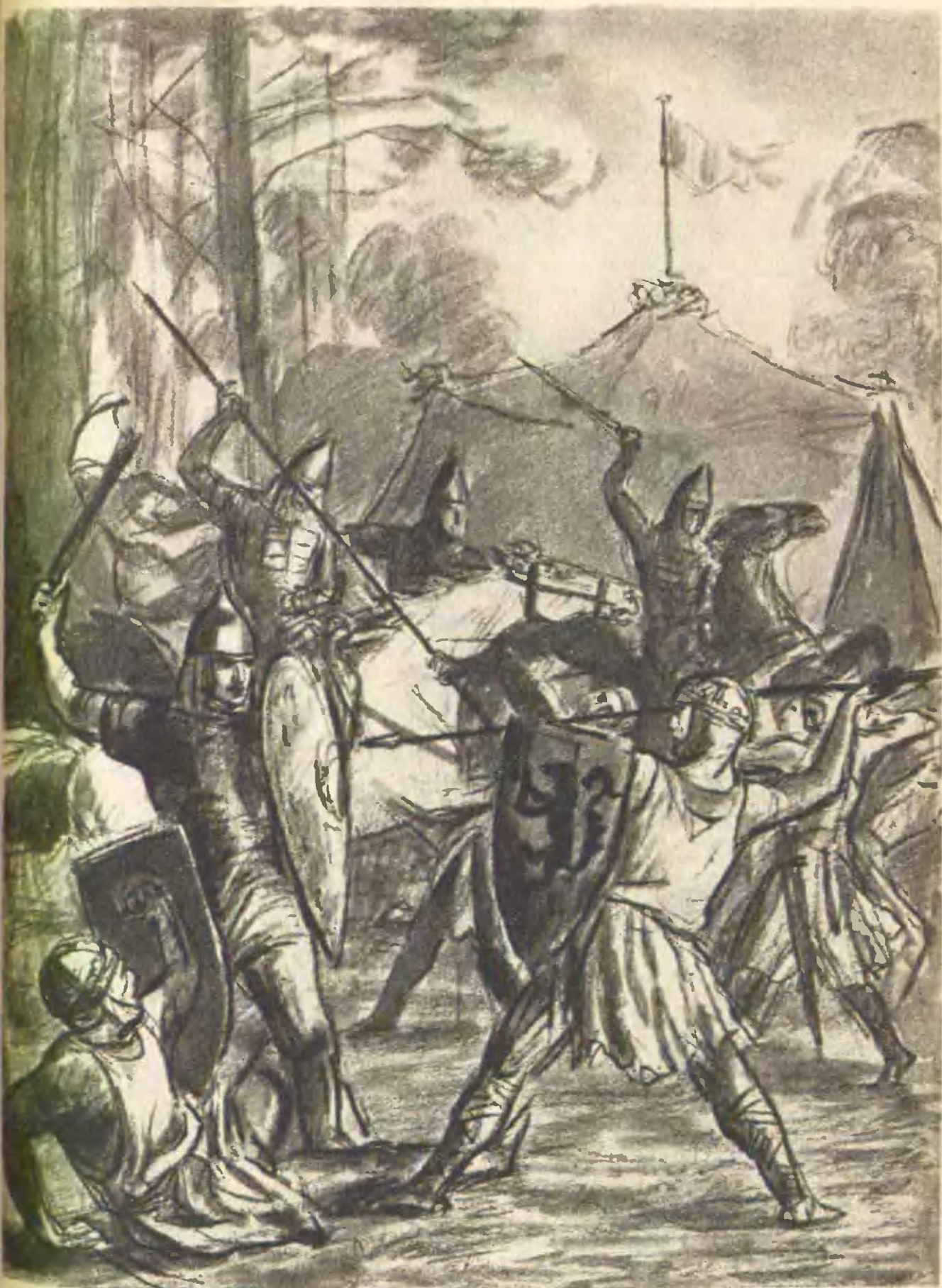
Новгородцы ворвались в лагерь...