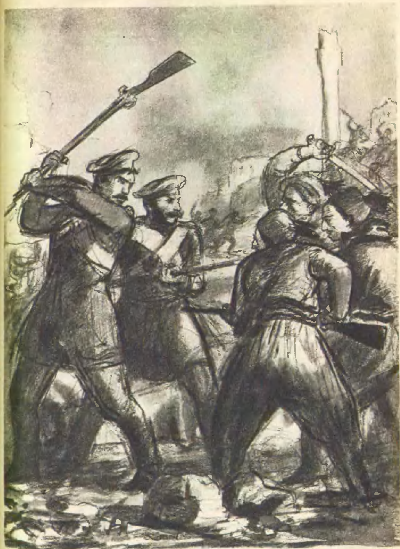
Рудаченко ударил одного из наседавших врагов прикладом.