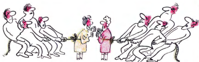
Рисунок В. ГУБЫ.