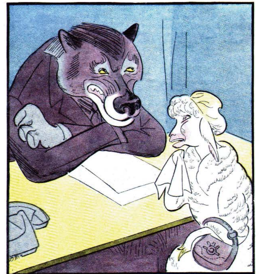
Рисунок М. БИТНОГО

— Ах, как я вас понимаю! Как-никак, сам был в вашей шкуре!