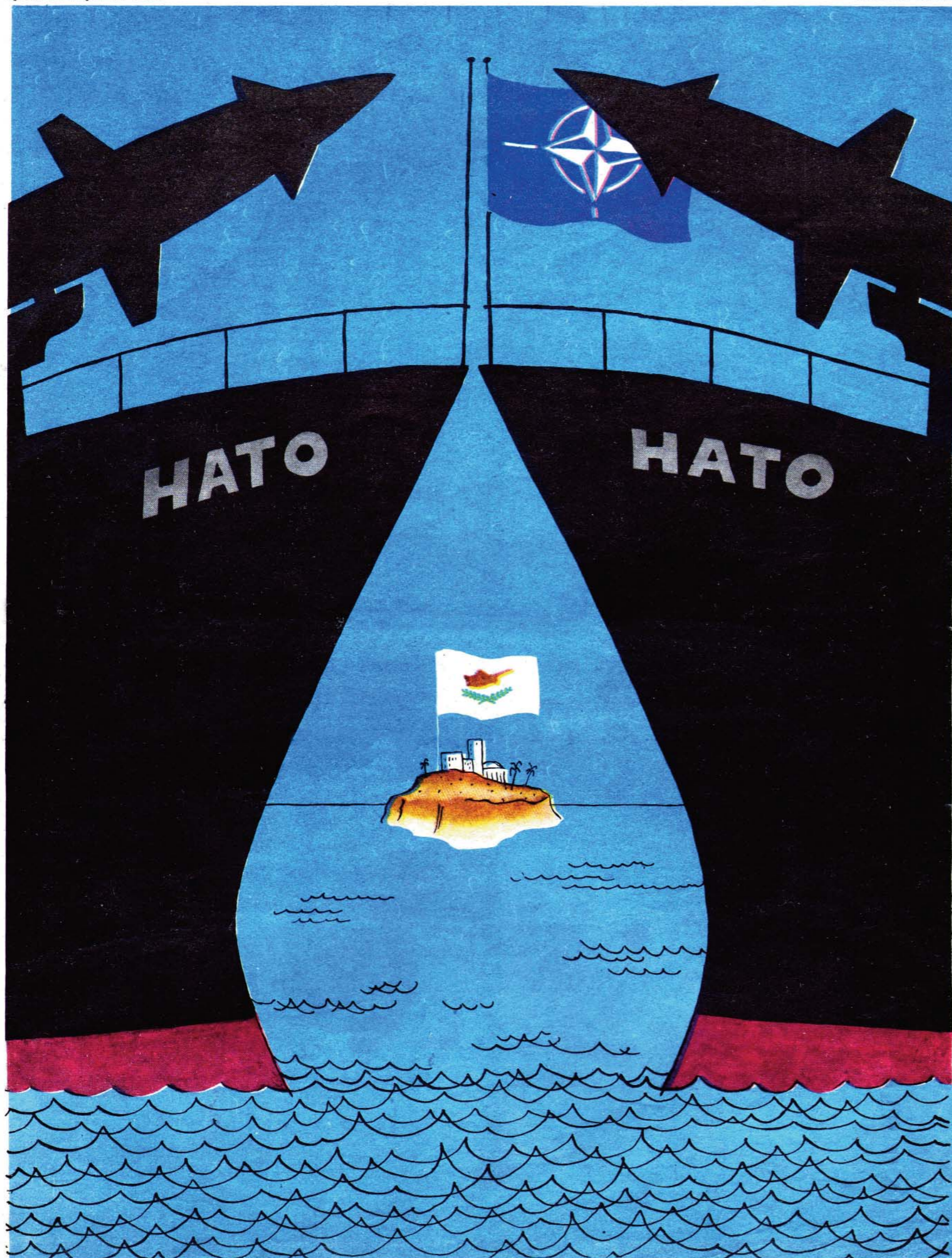
ТРИУМФАЛЬНАЯ АРКА В ЧЕСТЬ НЕЗАВИСИМОСТИ КИПРА (ПРОЕКТ НАТО)