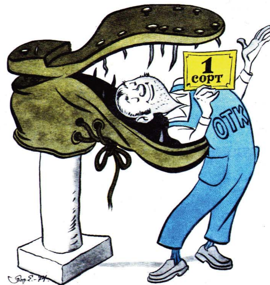
Рисунок Бор. ЕФИМОВА

ки, можно отлично выспаться — и воли не прибавится ни на грамм. Уж такие особые гвозди поставляет им Краснодарский за- вод стройматериалов: тупые, без шляпок, легко гнущиеся. Ах, если бы только волю нель- зя было закалять с помощью этих гвоздей! Беда в другом: для работы они еще менее пригодны, чем для волевого тренажа. В. КОНОВАЛОВ.