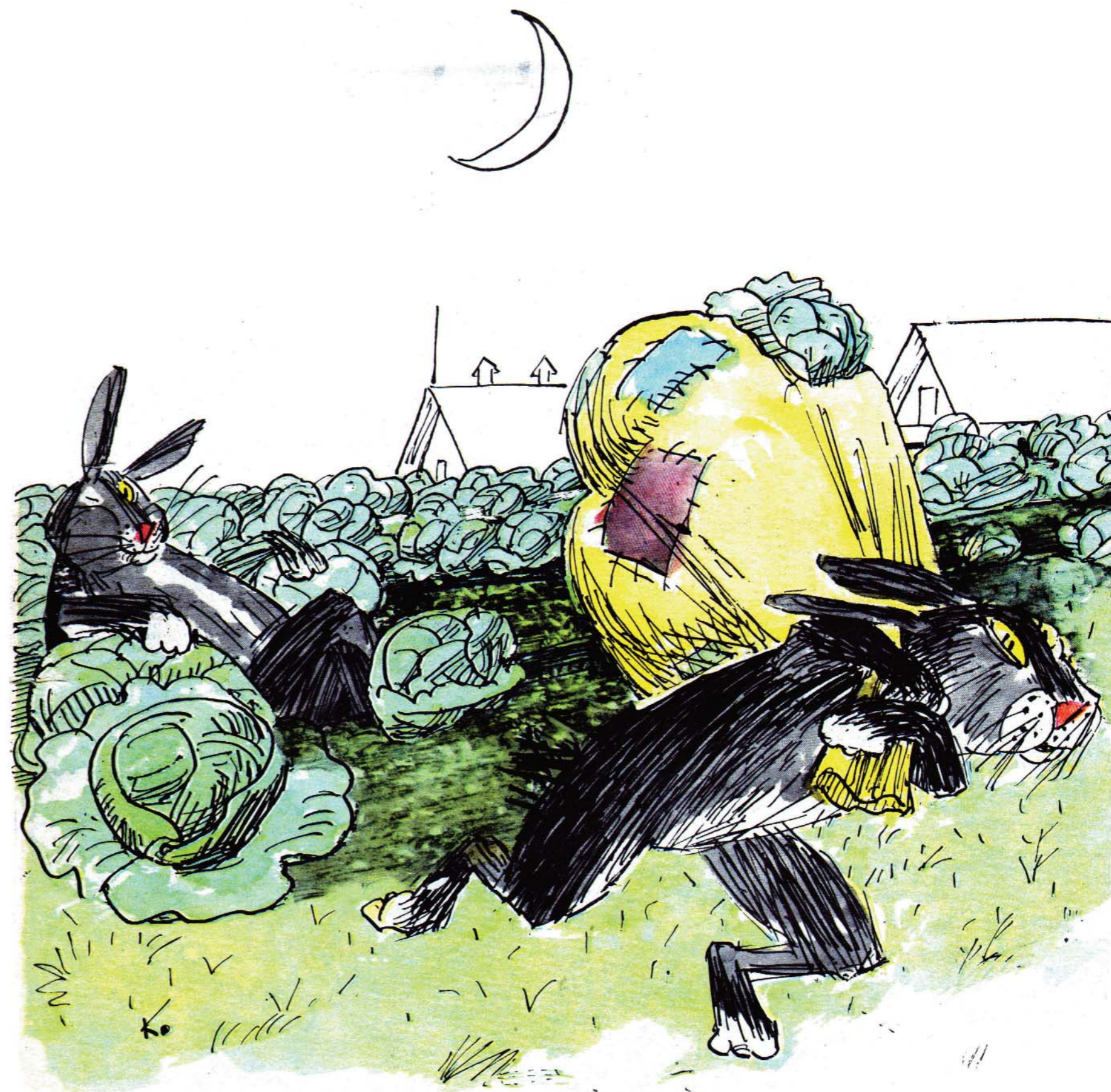
— Для чего запасешься? На зиму и так здесь все останется...