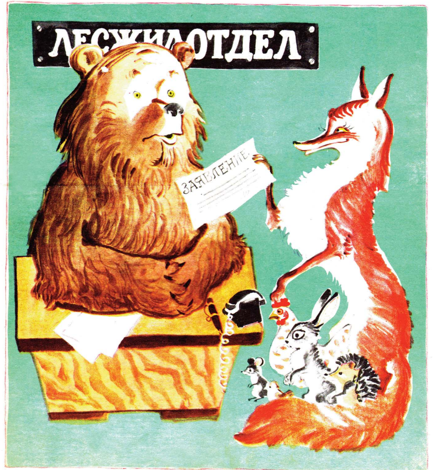
— Требую трехкомнатную: вот мои родственники, они у меня прописаны.