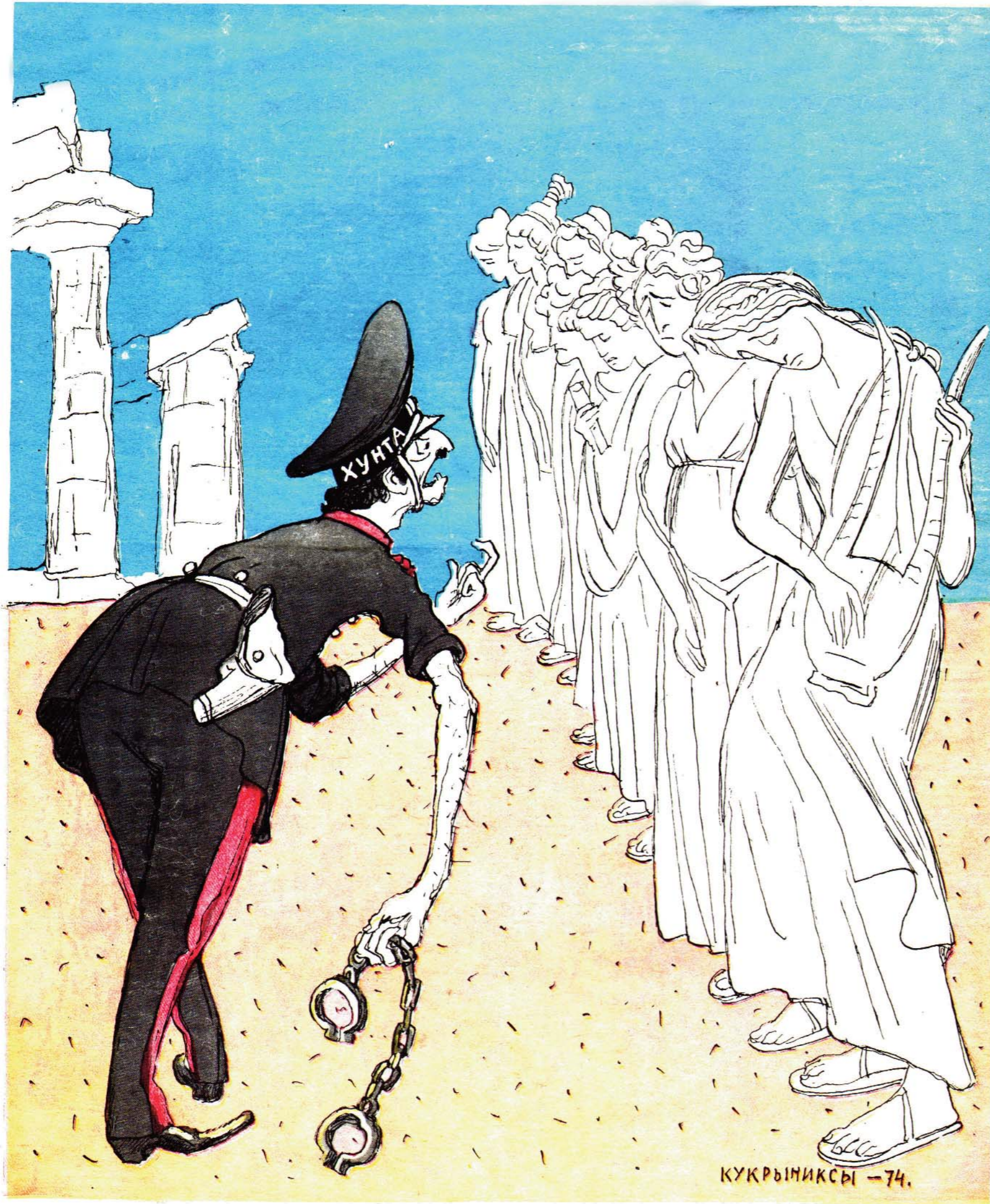
— А ну, которая из муз покровительствует печати? Шаг вперед!