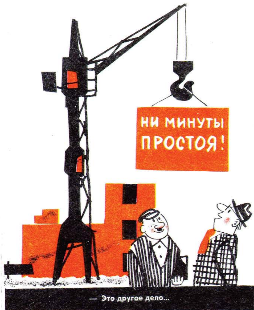
— Это другое дело...