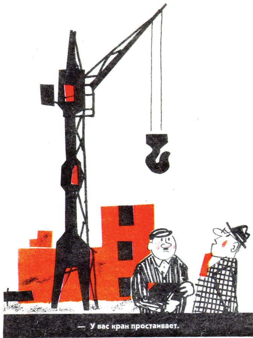
— У вас кран простаивает.