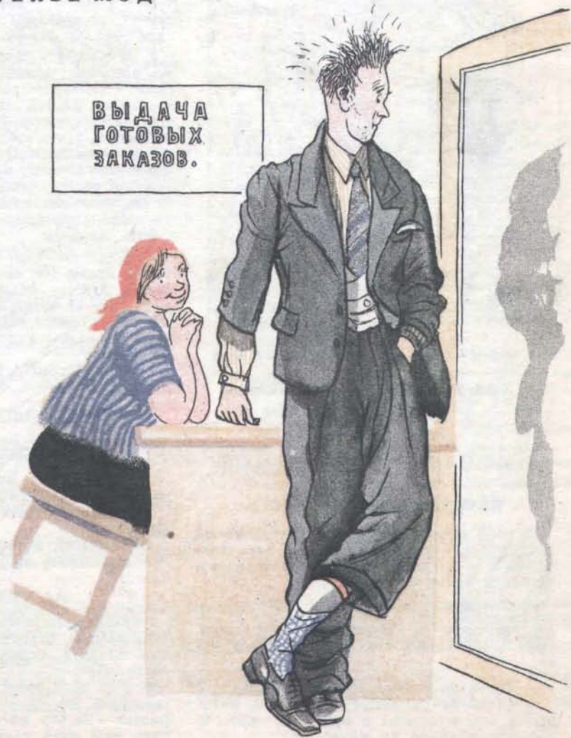
Костюм, а не картинка!!!