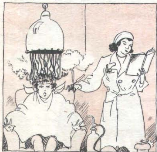
Рис. В. Клинка