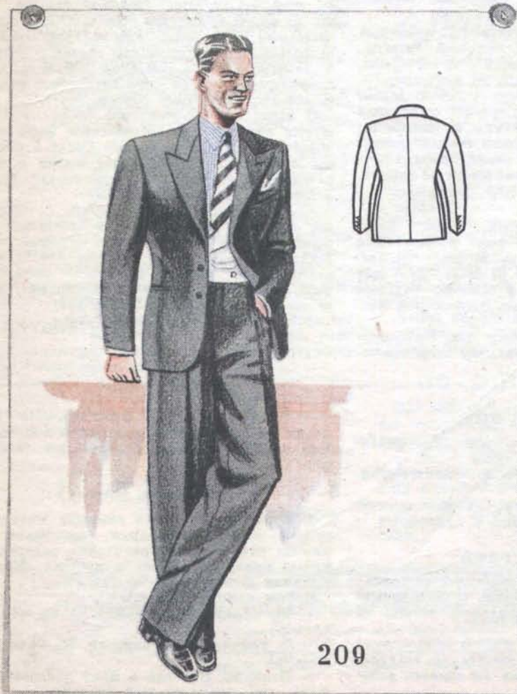
Картинка, а не костюм!