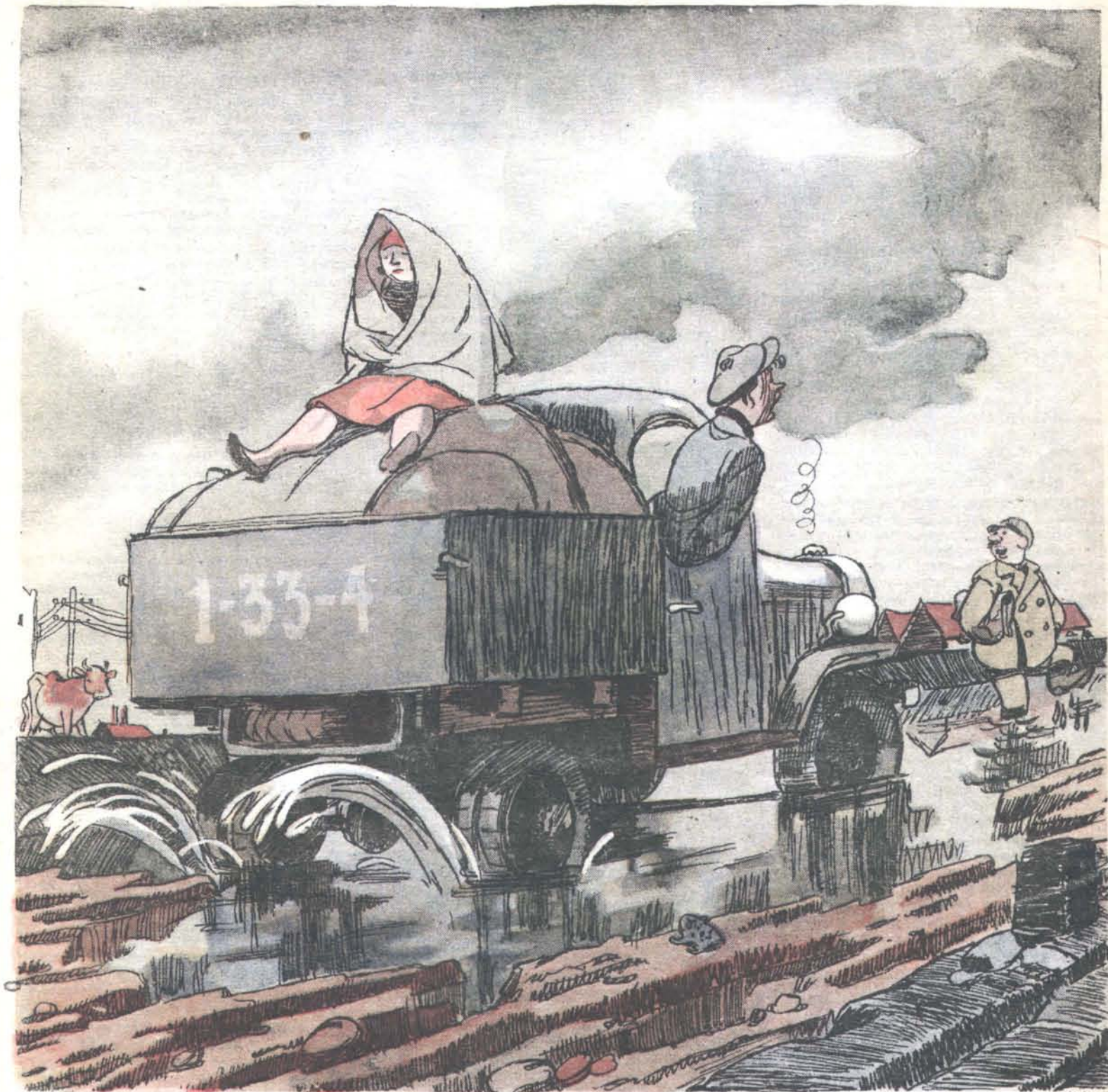
Рис. Ю. Гаффа

ШОФЕР: — Сходи с дороги — задавим! ПРЕДРАЙСПОЛКОМА: — Шутить, приятель: по моей дороге до меня не доберёшься!