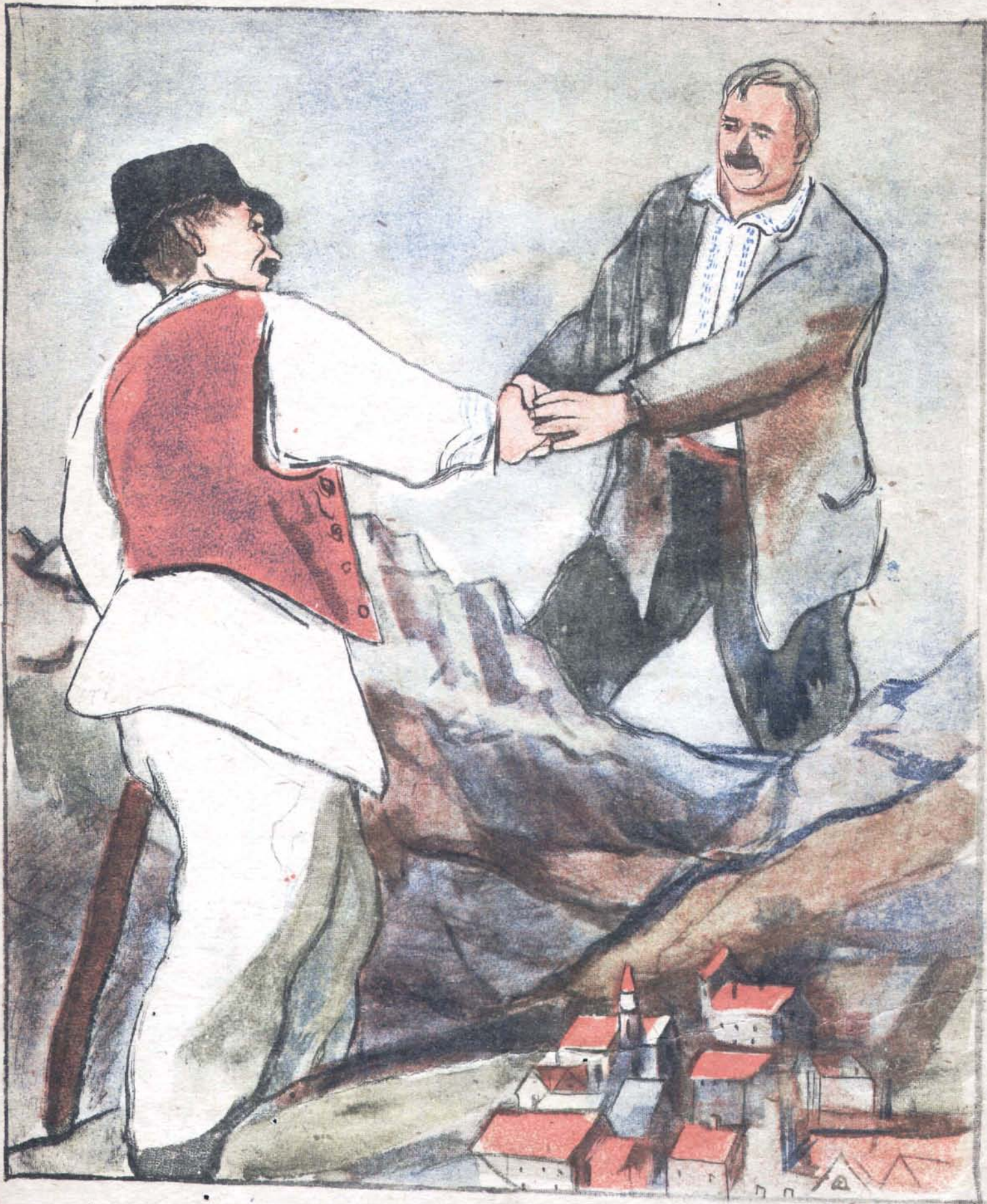
Рис. В. Горяева

— Гора з горою не зійдеться, а чоловік з чоловіком зійдеться.