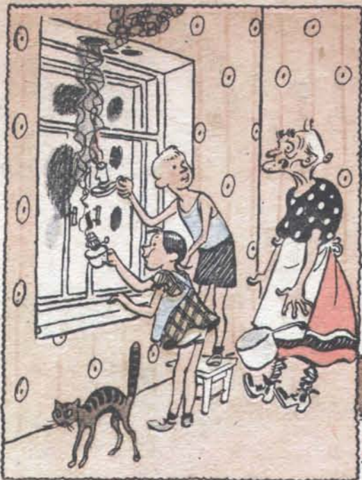
Рис. Ю. Гацфа

— Что вы делаете, безобразники? — Нам в школе говорили, что затмение надо смотреть через закопченные стёкла.