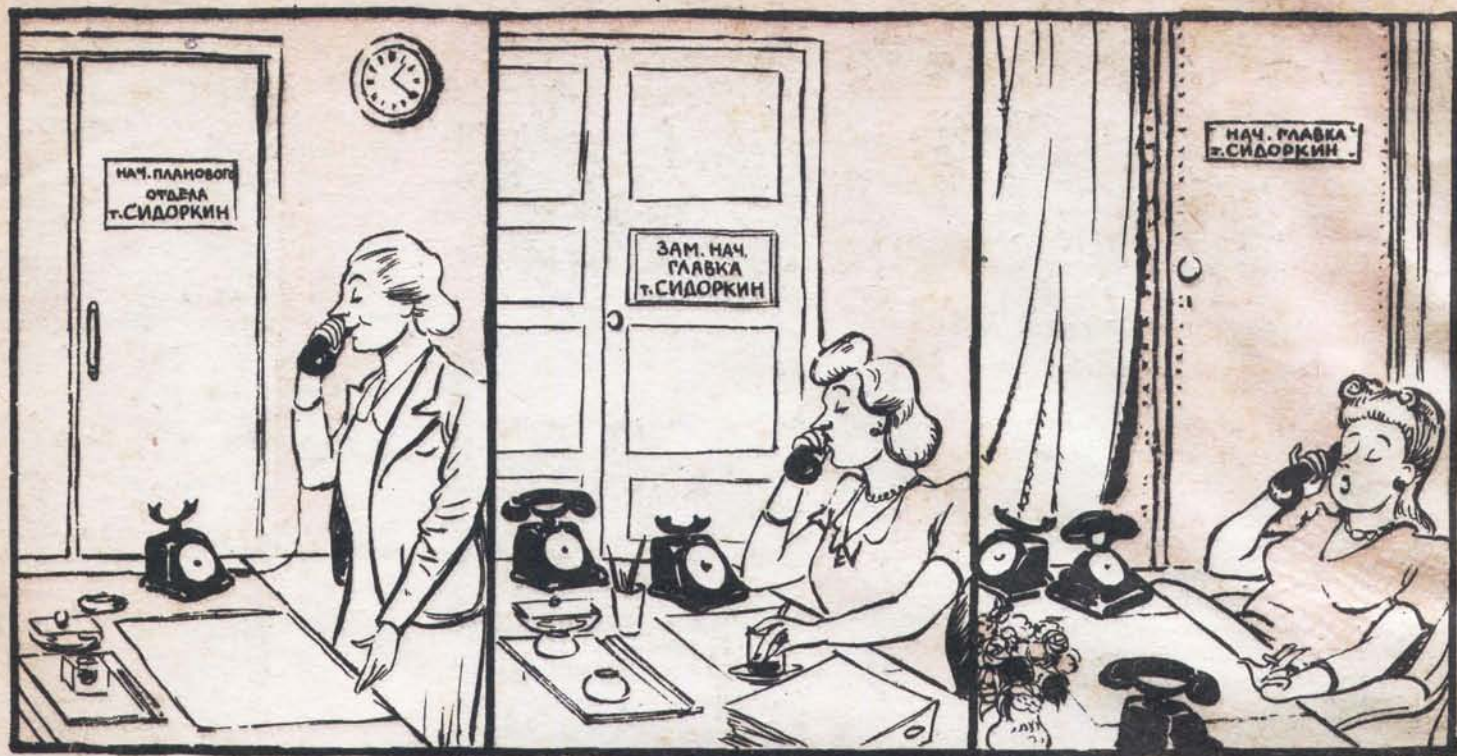
Рис. В. Клягча.