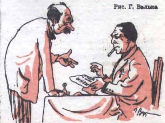
Рис. Г. Вальса

— Почему у вас в столовой нет выбора? — Выбор есть: можете есть или не есть.