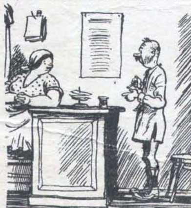
Рис. И. Семёнова

— Безобразие! Когда будут готовы мои брюки? Я уже четыре часа жду!