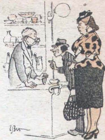
Рис. Г. Валька

— Вот хорошие чашки! Красивые, яркие, бросаются в глаза!