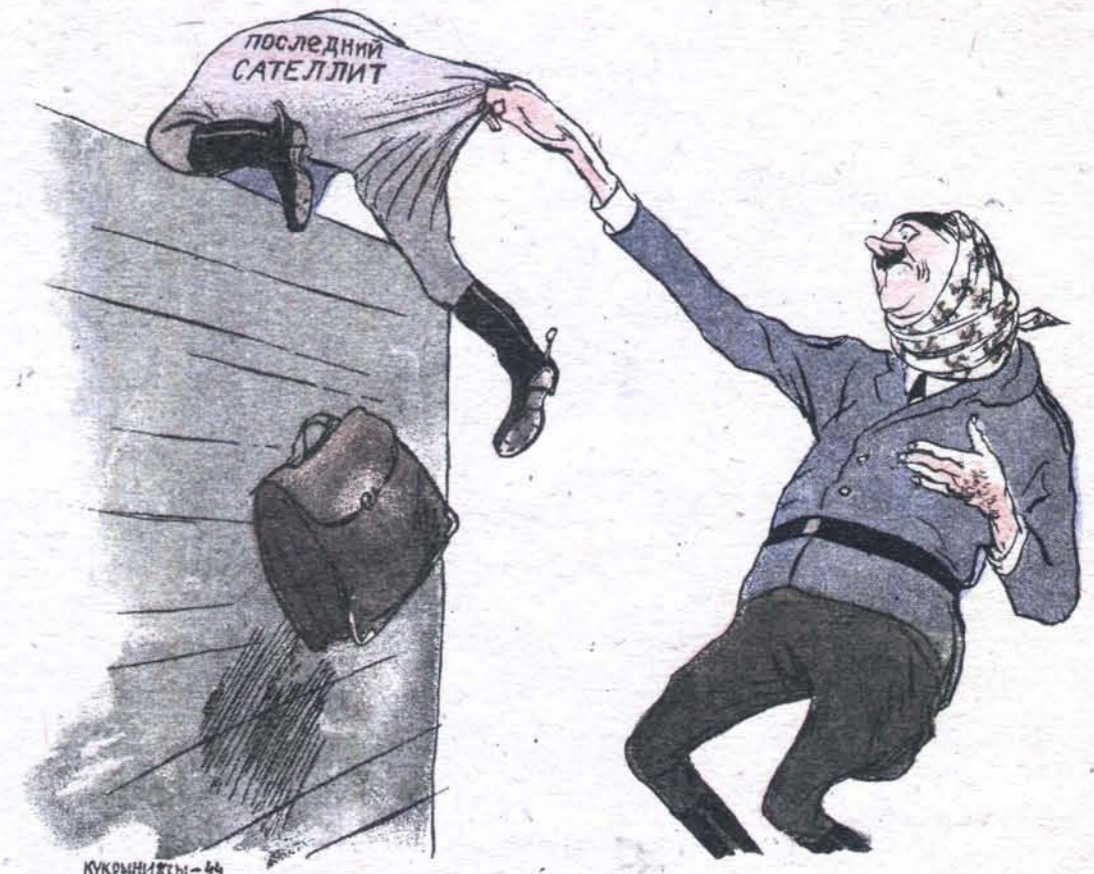
— Не оставь меня, кум милой!