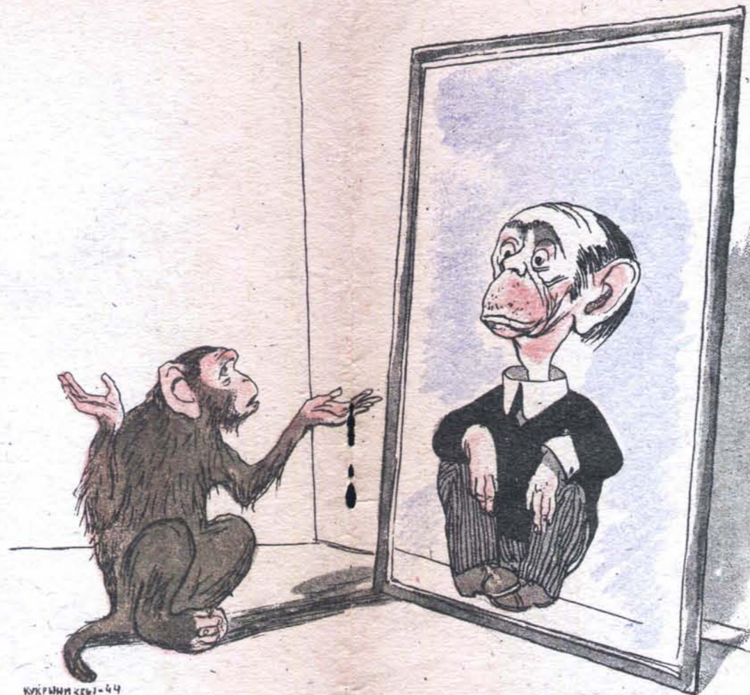
Я удавилась бы с тоски, Когда бы на него хоть чуть была похожа.