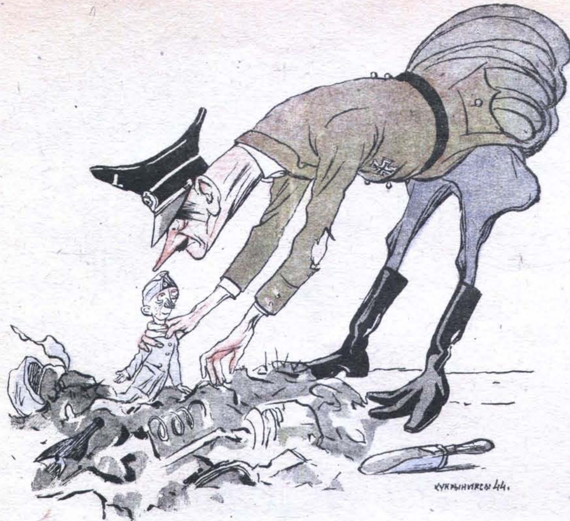
Навозну кучу разрывая, Адольф нашёл тотальное дерьмо.