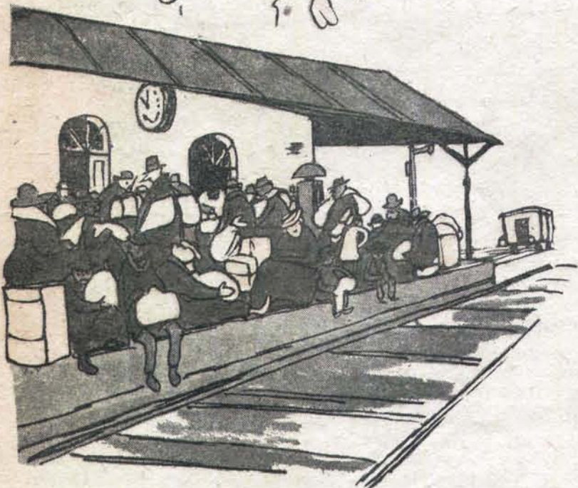
Узловая станция Кенигсберг.

— Уж кому-кому, а мне хорошо известно, что горбатого могила исправит.