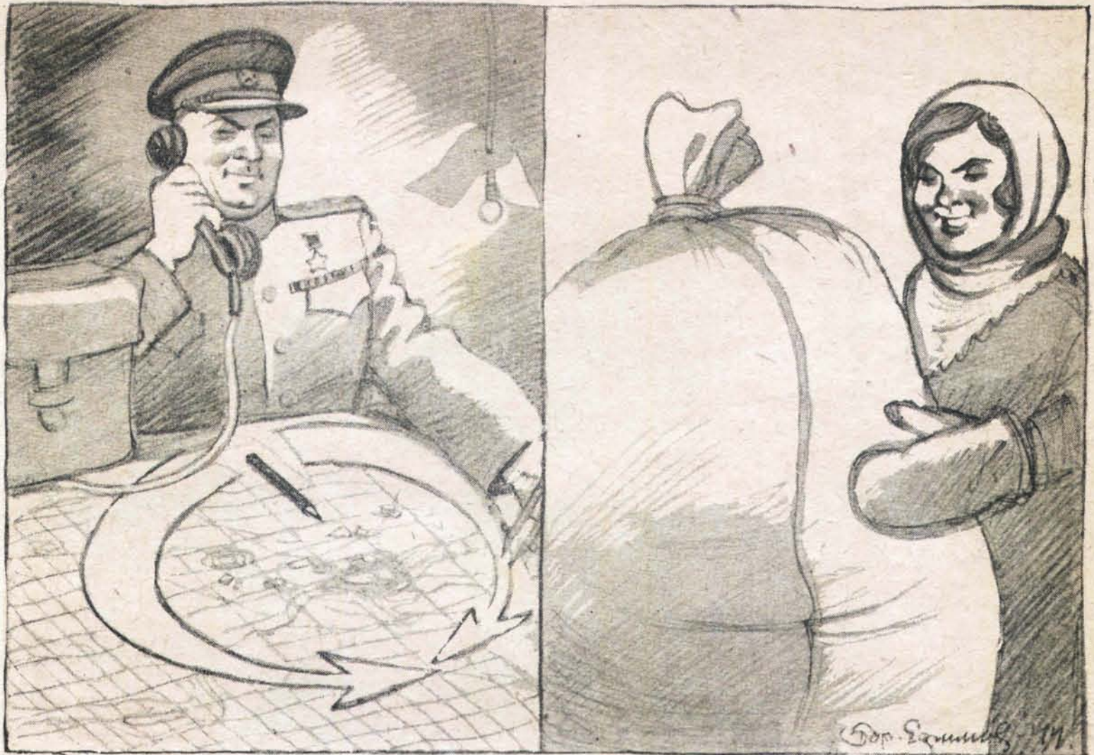
Мешки в фонд Красной Армии.