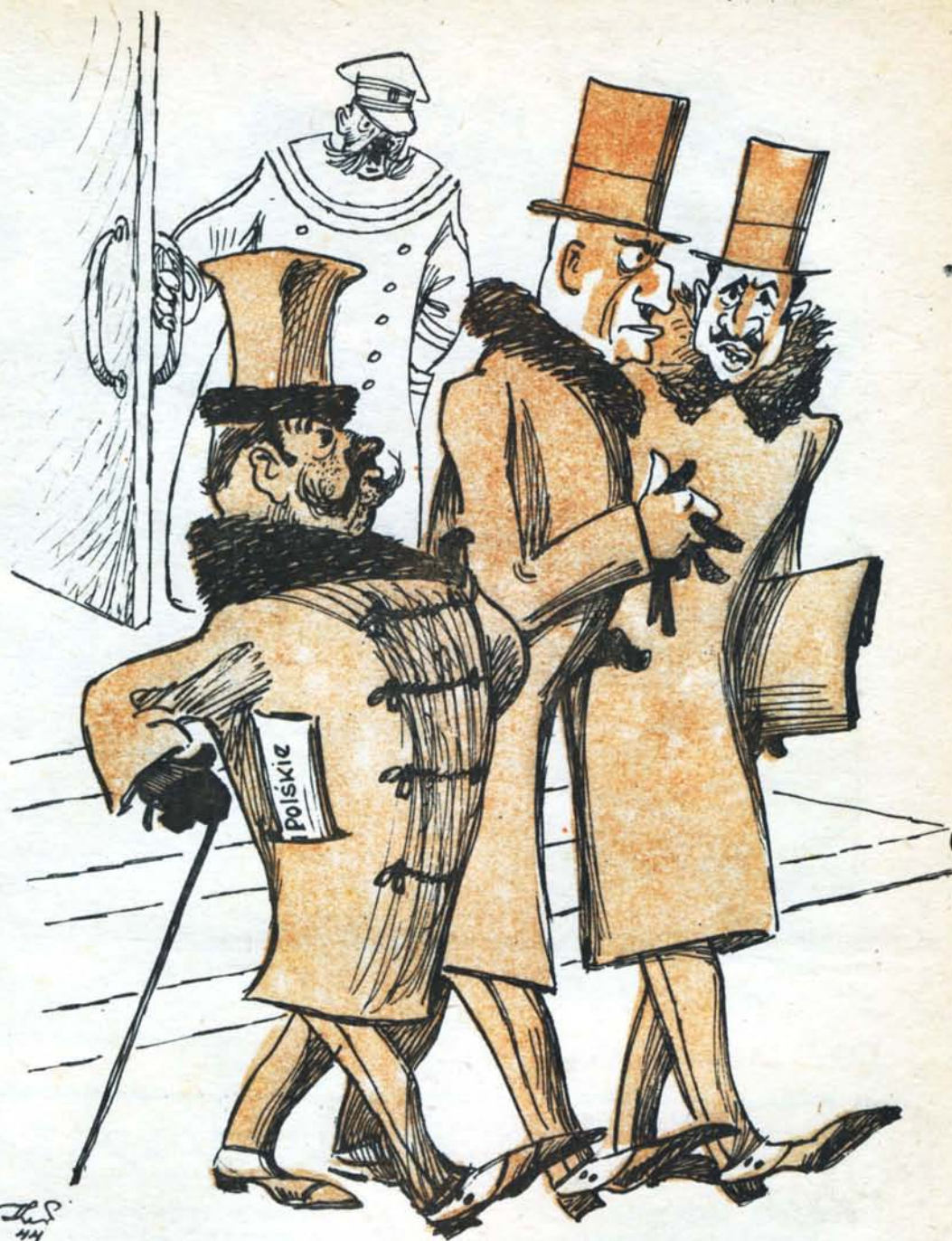
Рис. И. Блиссеева