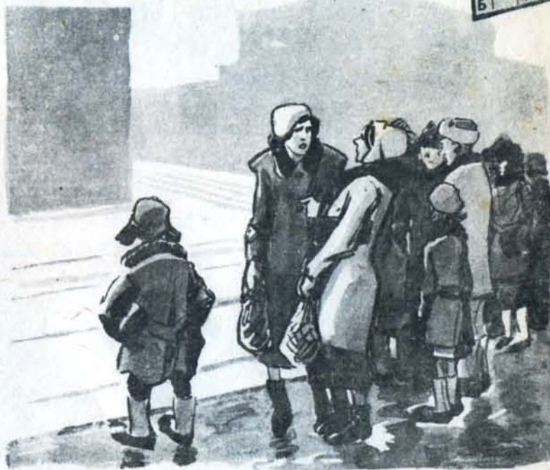
Рис. К. Елисеен

— А ведь кондуктора в трамваях меньше стали грубить! — Да что вы? — Конечно! Ведь трамваев-то в нашем городе всё меньше и меньше ходит.