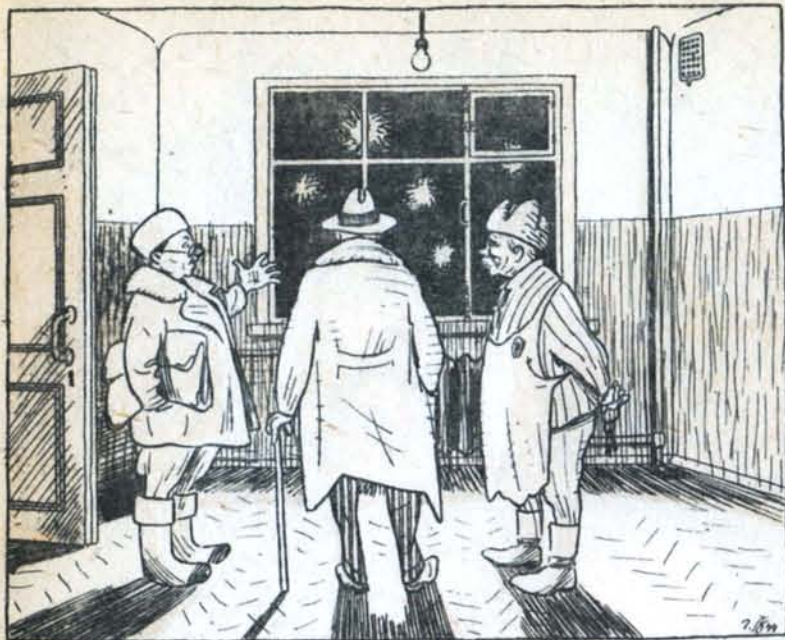
— Рекомендую эту жилплощадь: отсюда дивный вид на салют.