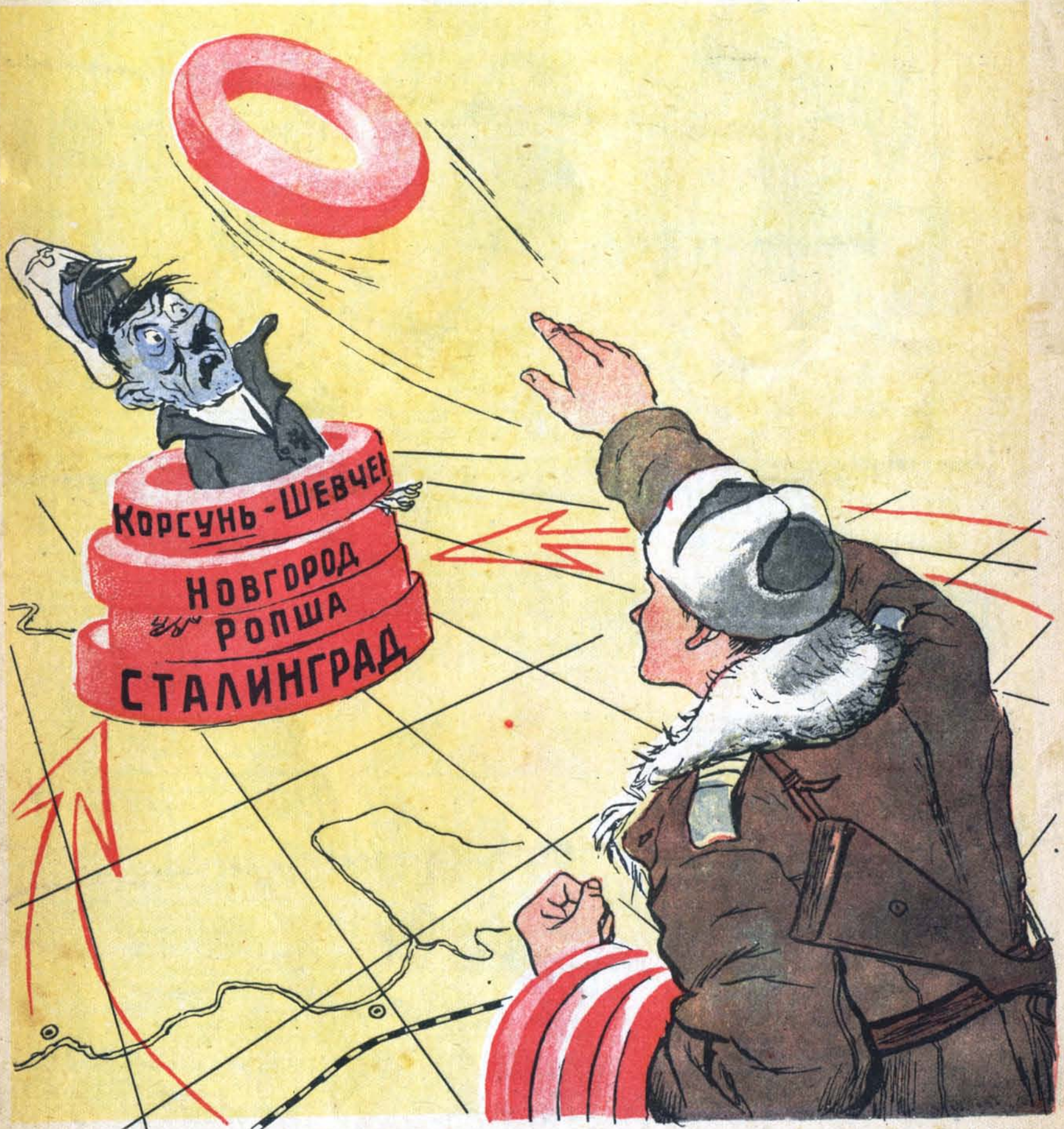
Рис. И. Семёнова