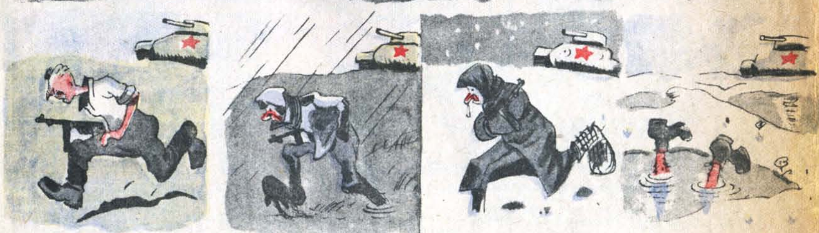
Весенние побеги во всех четырёх сезонах.