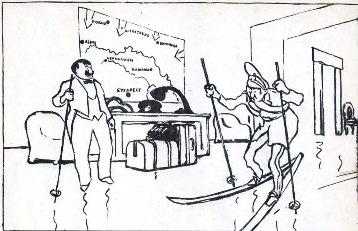
— Ближится весна... Пора наострить лыжи!