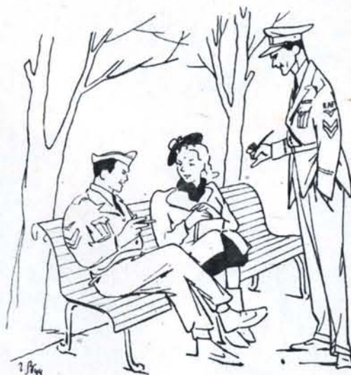
Рис. Г. Валька

— А что Берлин — большой город? — Как вам сказать, мисс, при последнем визите он мне показался несколько меньше обычного.