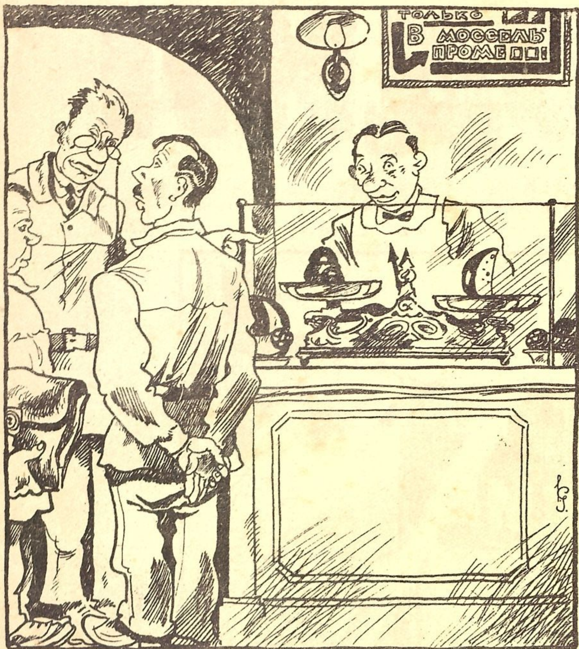
Рис. К. Ротова