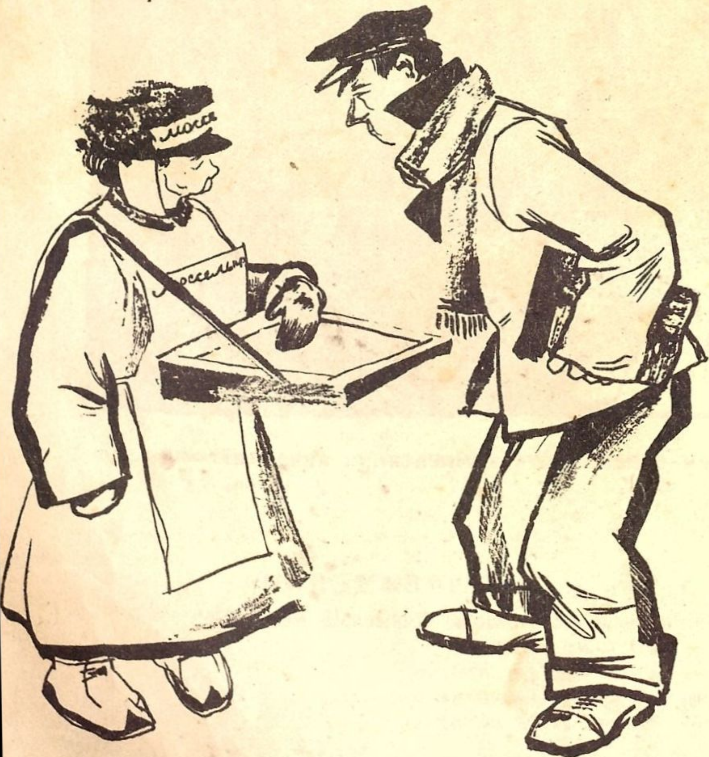
Рис. М. Храповского

— Извините, гражданин, шоколада нет. Всюду бобы азвоят, а для шоколада бобов нет. Вот и приходится идти на бобах.