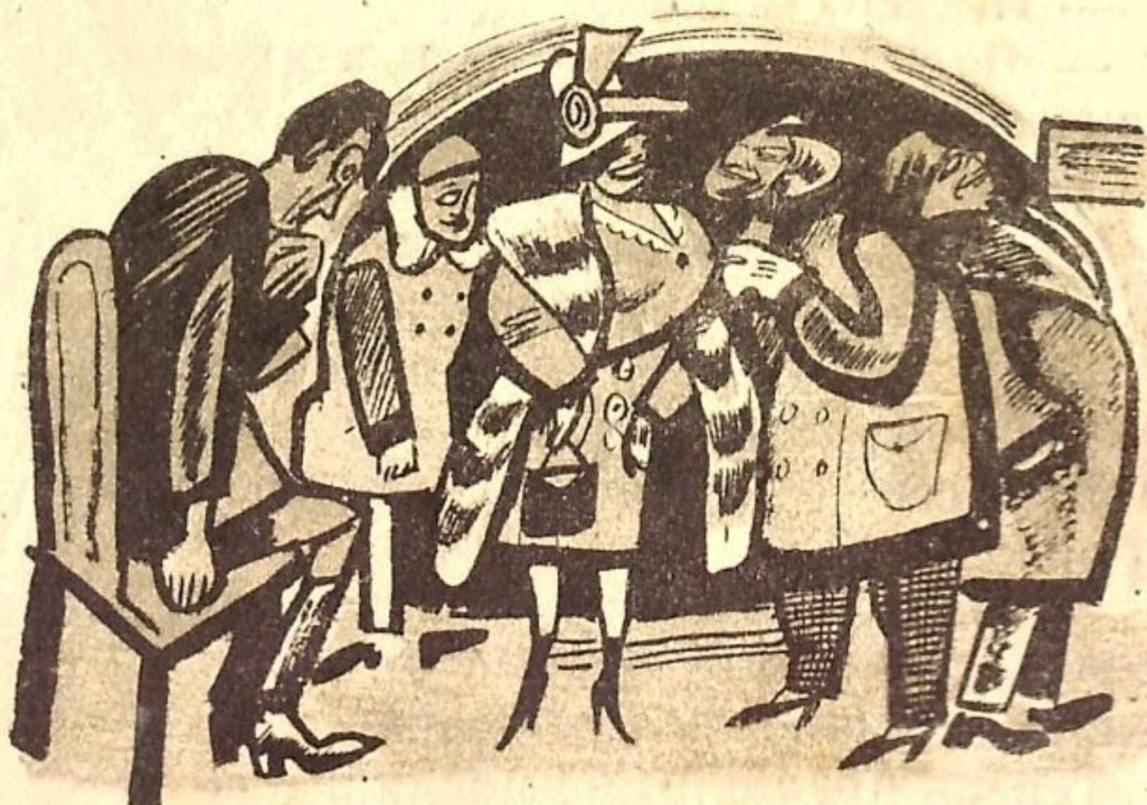
Рис. А. Р.

Три пассажира на одно место—это слишком много. Иногда и один на месте недолго усидит, если это место пассажира Теразевича.