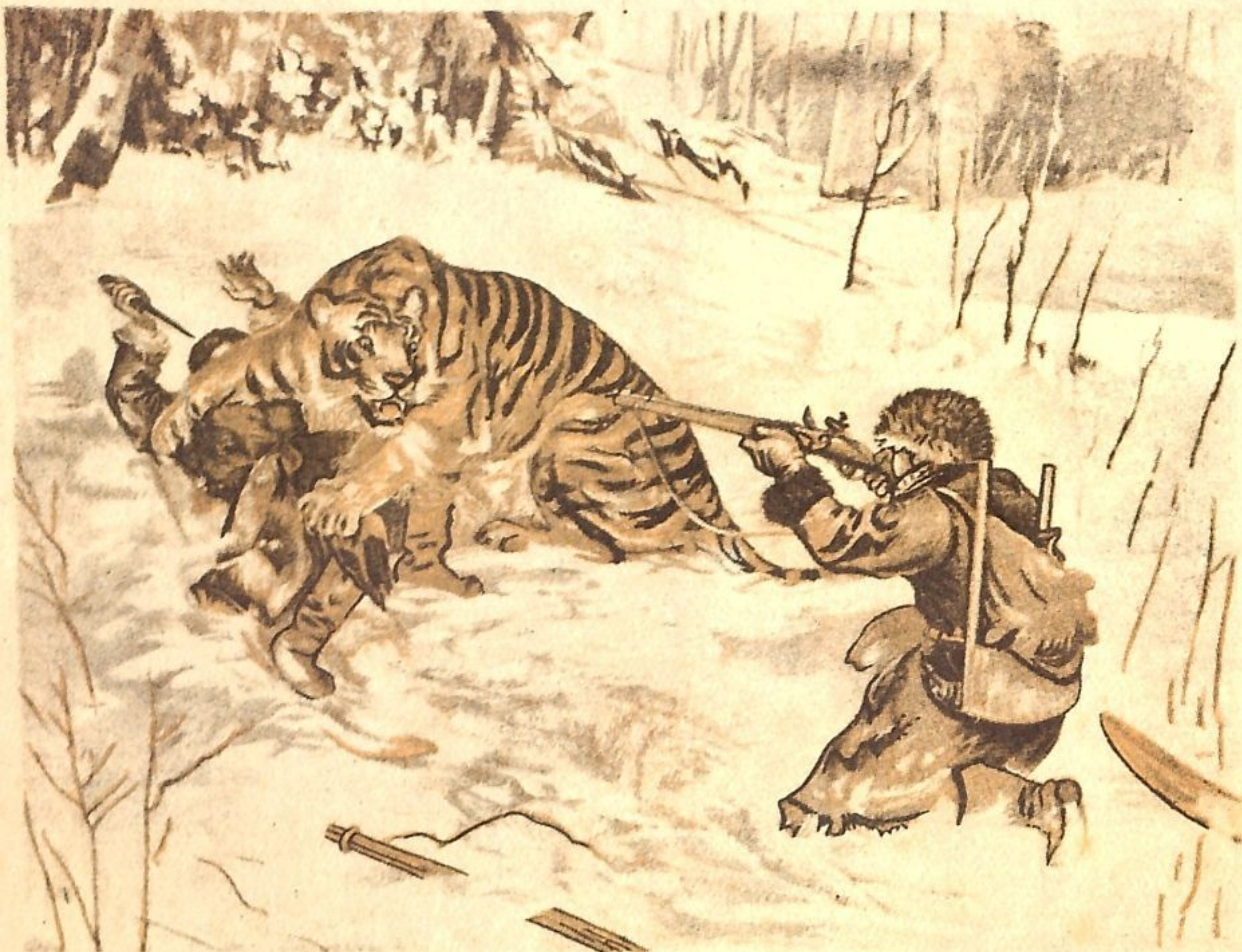
ОХОТА НА ТИГРА.

Кто, когда и где видел, чтобы самоеды на лыжах в морозный снежный день охотились на... тигров? Мы видели. На плакате Госиздата, изданном в несколько красок в количестве 10.000 экземпляров.