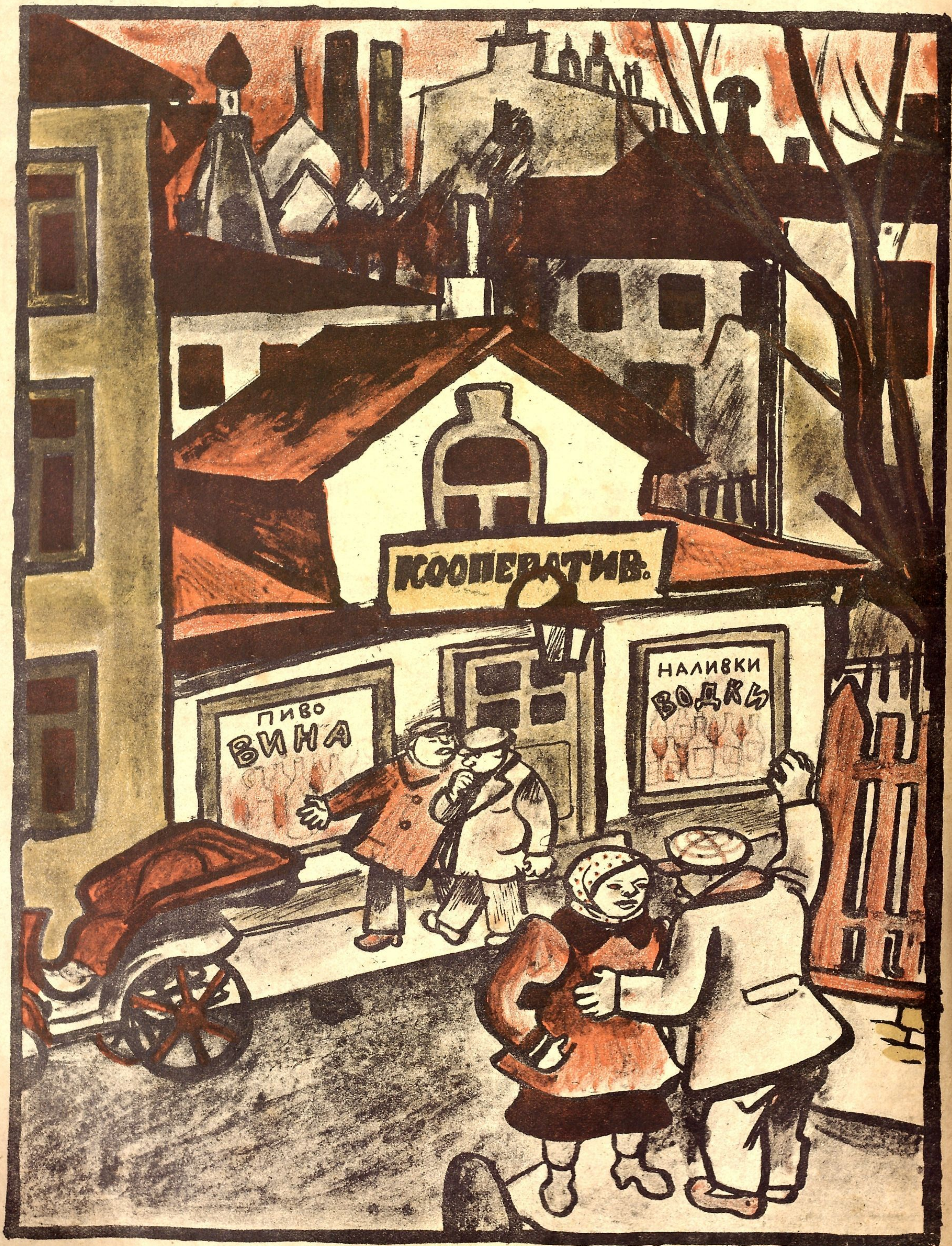
Рис. Ив. Малютина

— Ну, теперь наша улица совсем протрезвеет: три пивных закрыли—и везде на их месте вот такие кооперативы будут.