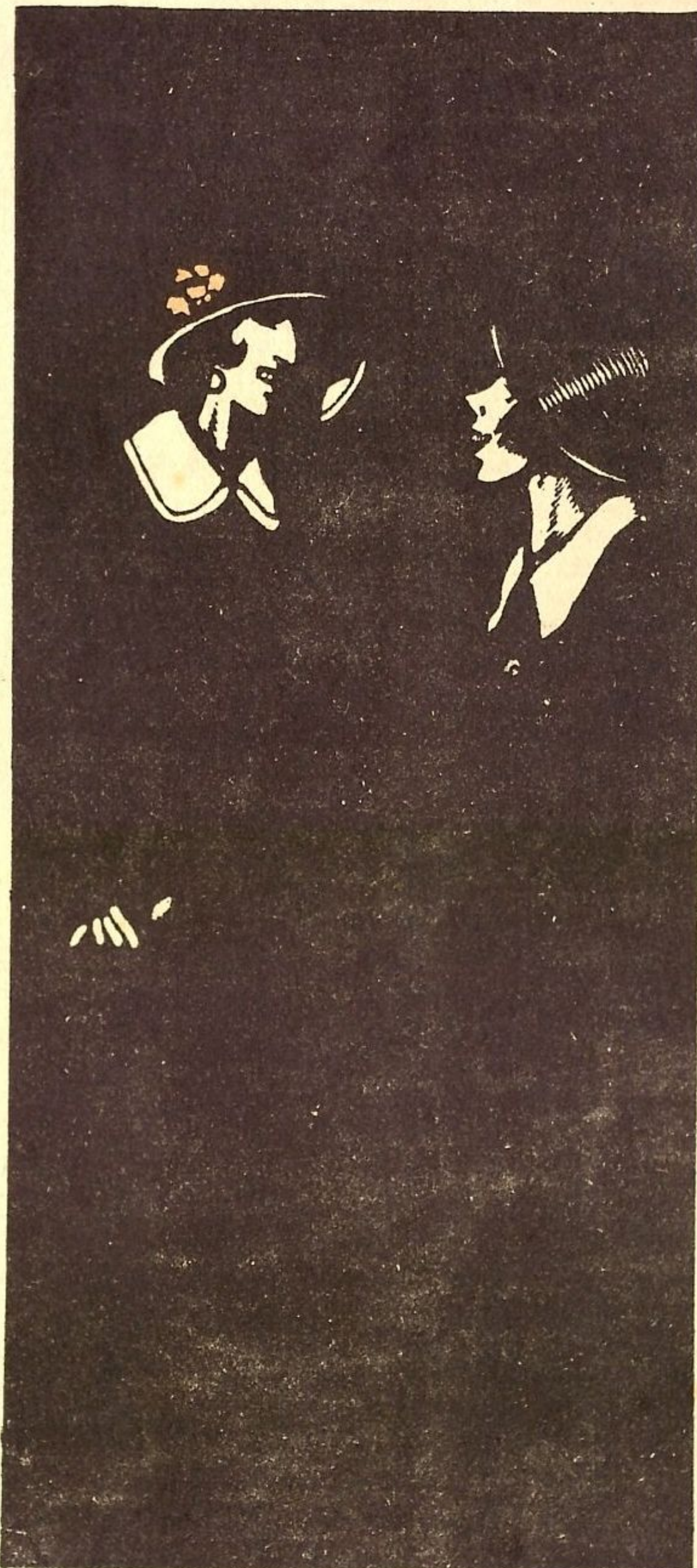
Рис. К. Елисеева.

— Я в прошлом месяце из жалования ни копейки не истратила.