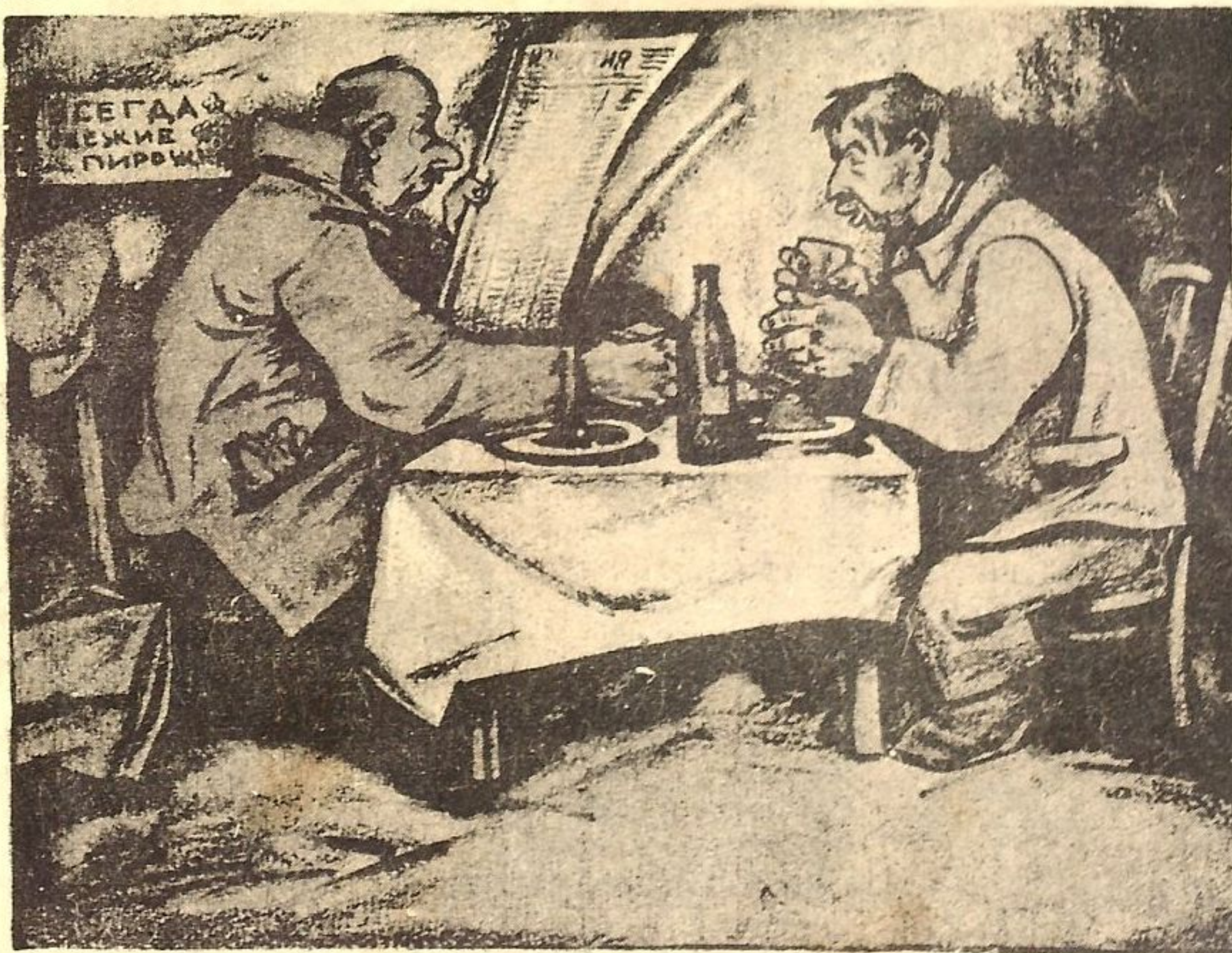
Рис. М. Х.

— Скажите на милость: Сенькин—делопроизводитель, а хватать стал, как управдел.