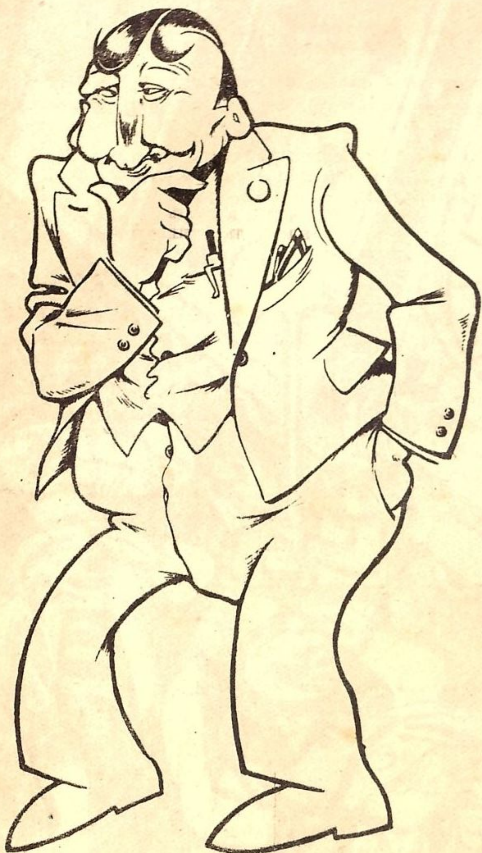
Рис. К. Е.

Директор завода Сватает дочь-невесту... А я—полгода Сижу без места, Как дурак. Надо и есть, и пить, А никак не могу поступить,— Ну, никак!