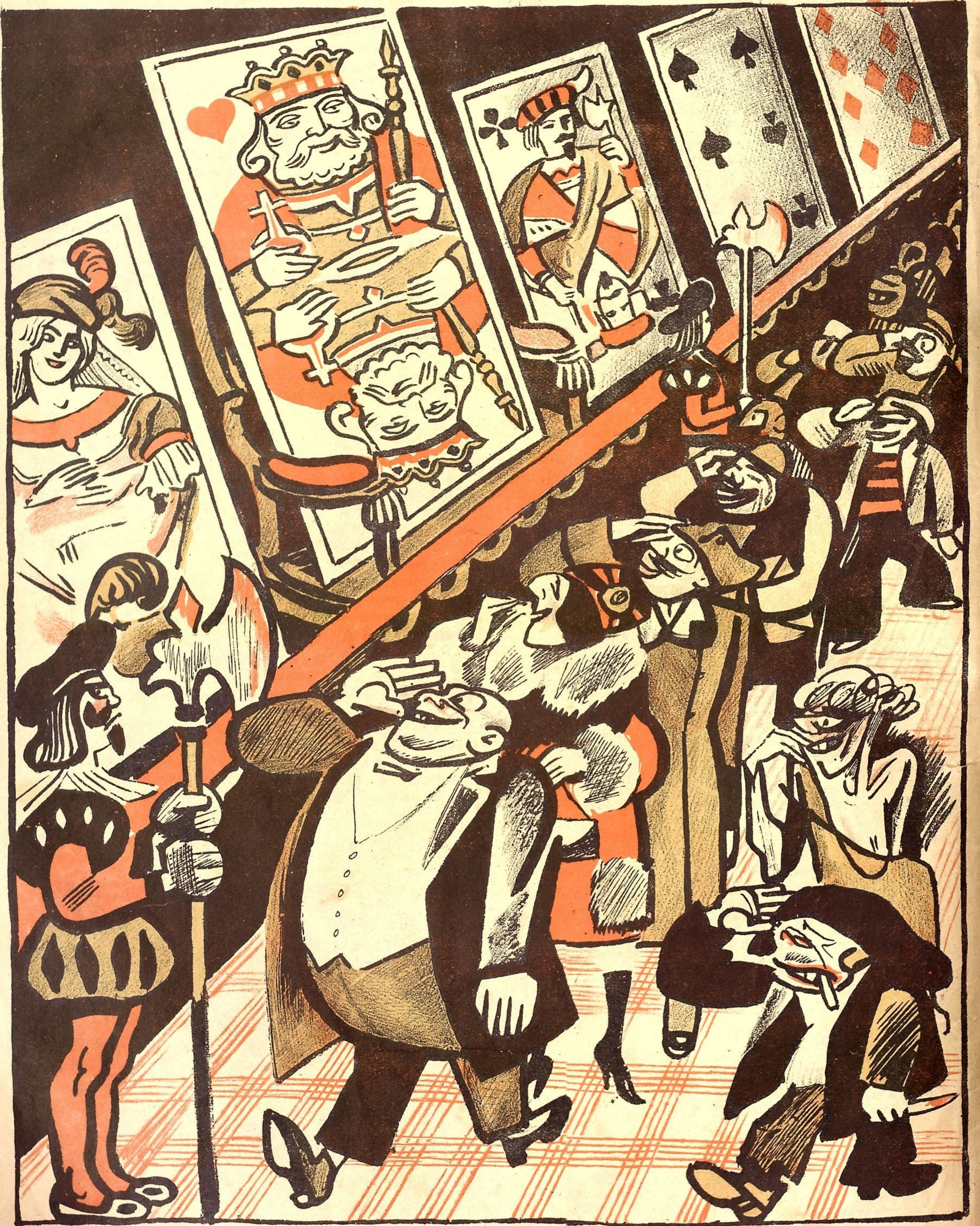
КОРОЛЬ, КОТОРОМУ ДО СИХ ПОР ЕЩЕ МНОГИЕ КОЗЫРЯЮТ