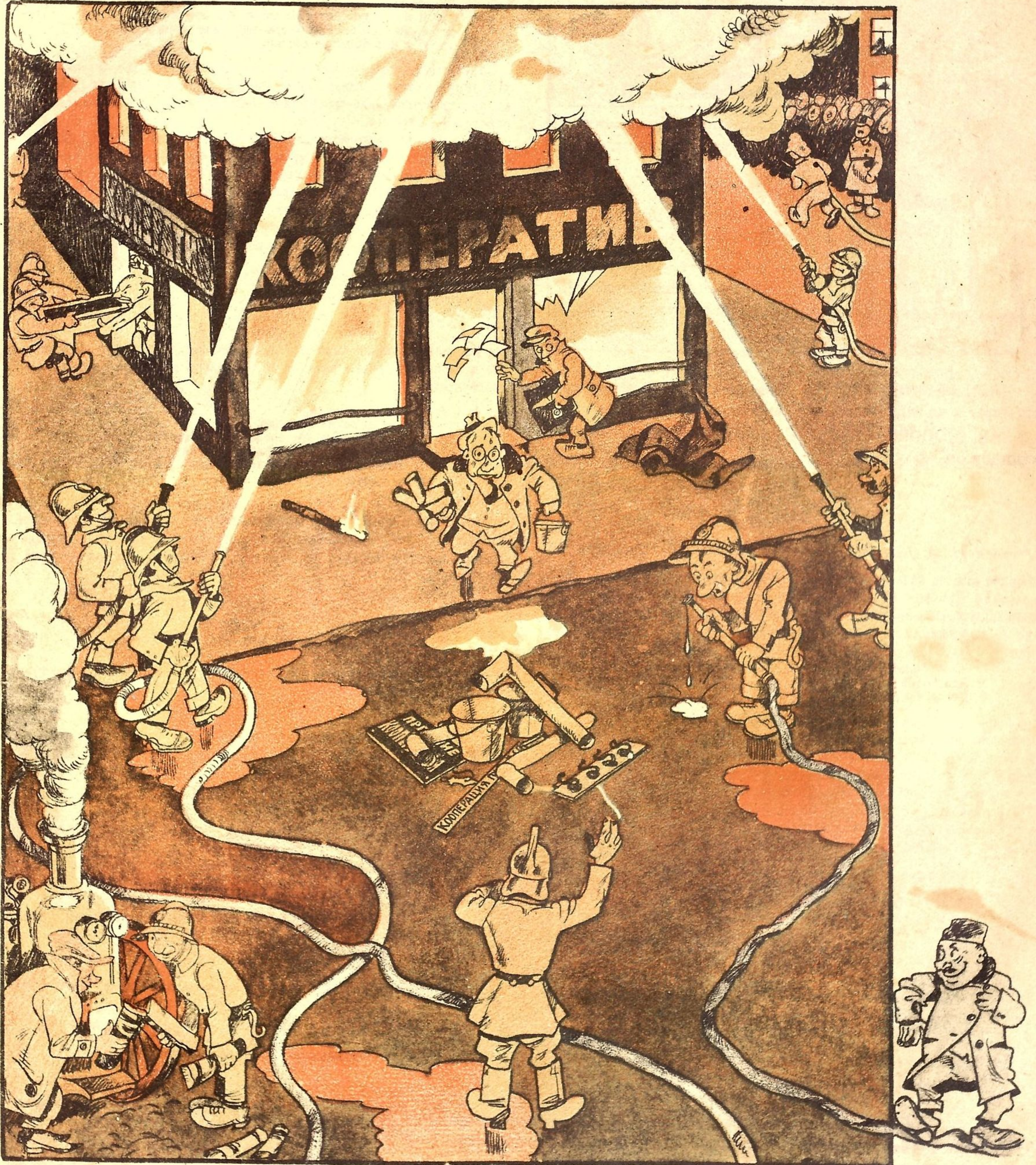
Рис. К. Ротова