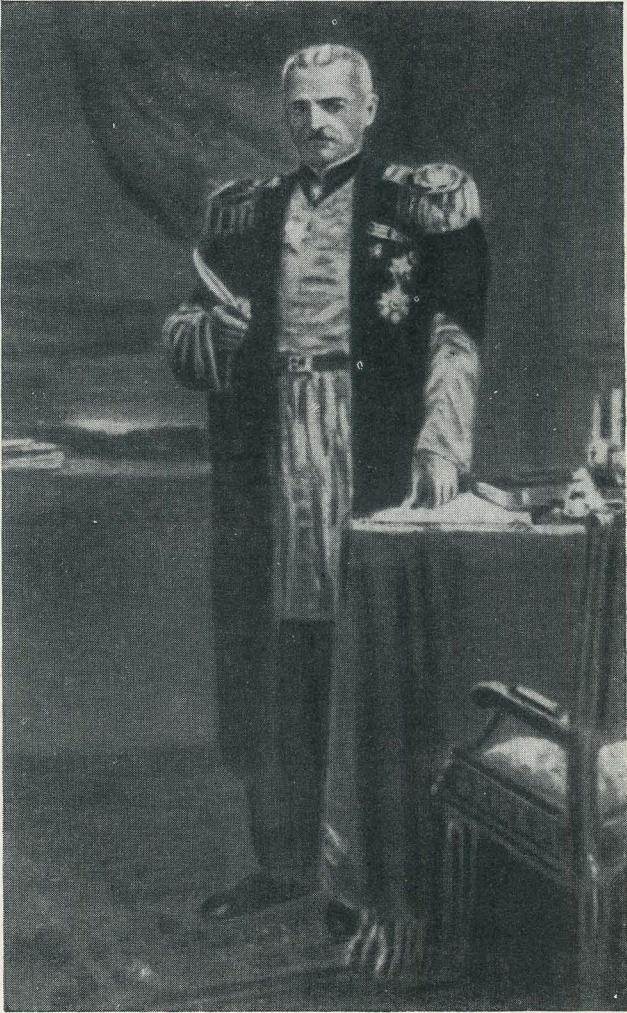
Ахундов М. Ф.