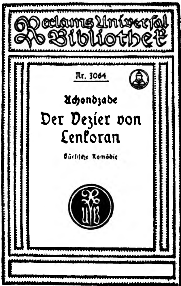
Титульный лист комедии М. Ф. Ахундова «Визирь Ленкоранского ханства», изданной на немецком языке.