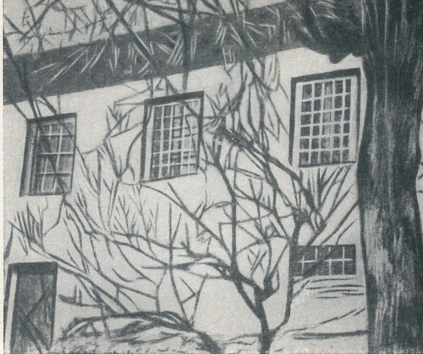
Дом в городе Нухе, где родился М. Ф. Ахундов.