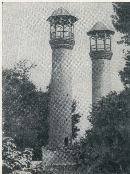
Мусульманская духовная школа — моллахане.