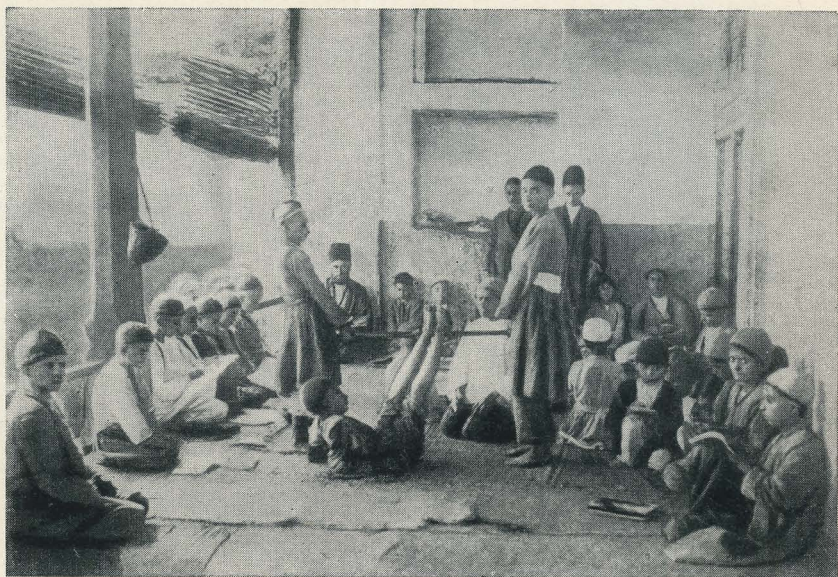
Мечеть в городе Гяндже, где учился М. Ф. Ахундов.