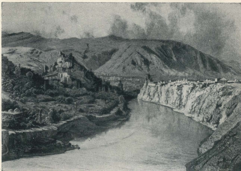
Тифлис первой половины XIX века.