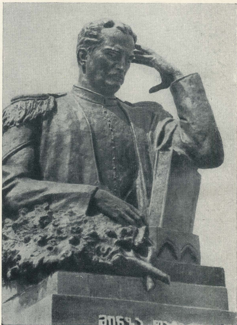
Памятник М. Ф. Ахундову в городе Тбилиси, открытый в 1958 году.