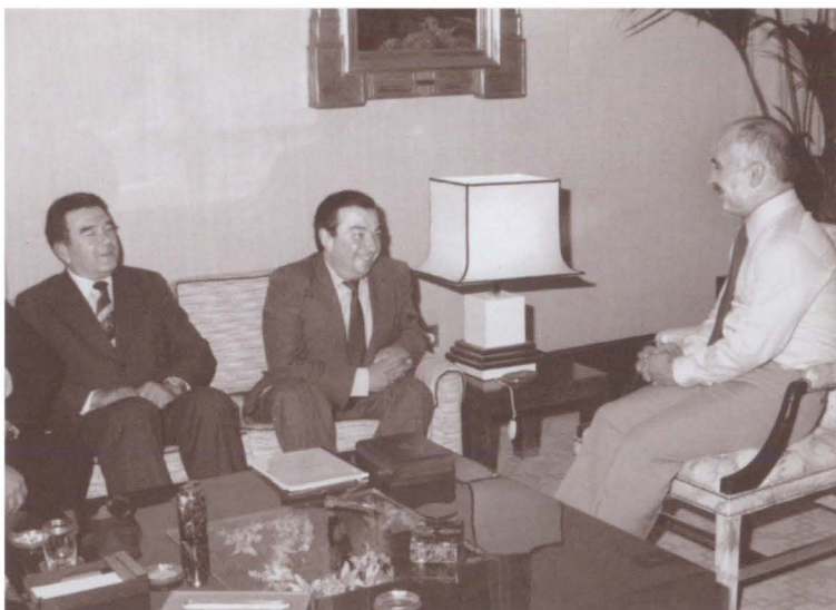
У короля Иордании Хусейна вместе с Рафиком Нишановичем Нишановым — бывшим послом СССР в этой стране

Тарья Халонен была министром иностранных дел, а позже стала президентом Финляндии