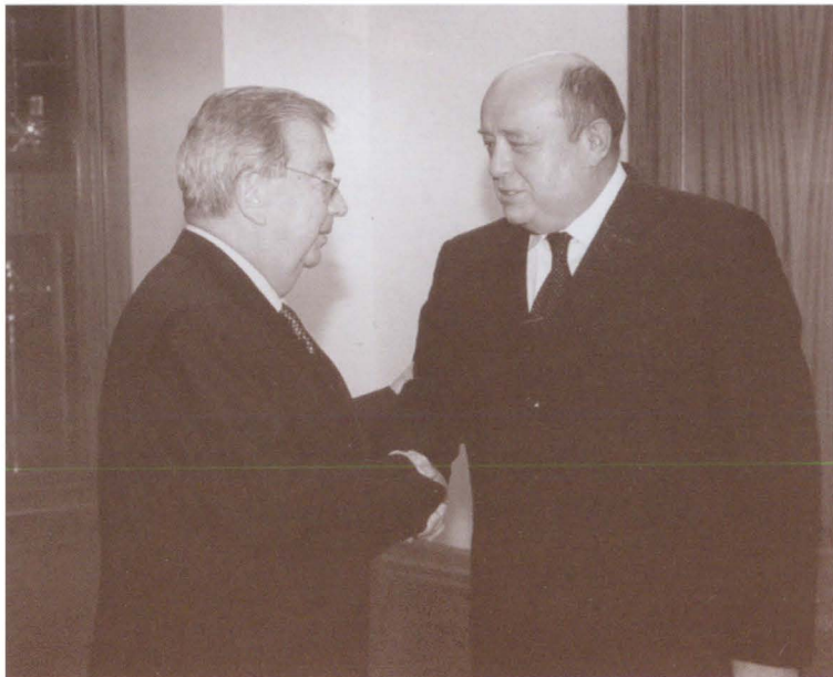
С Михаилом Ефимовичем Фрадковым