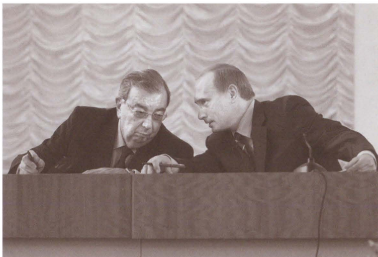
Евгений Примаков и Владимир Путин в президиуме XIV съезда Российского союза промышленников и предпринимателей. 2004 г.

Поистине мудрый, участливый и чуткий к судьбам страны и людей патриарх Алексей II