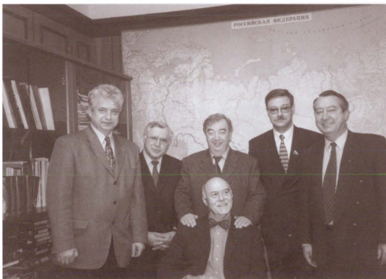
В Государственной думе с членами фракции «Отечество — Вся Россия»