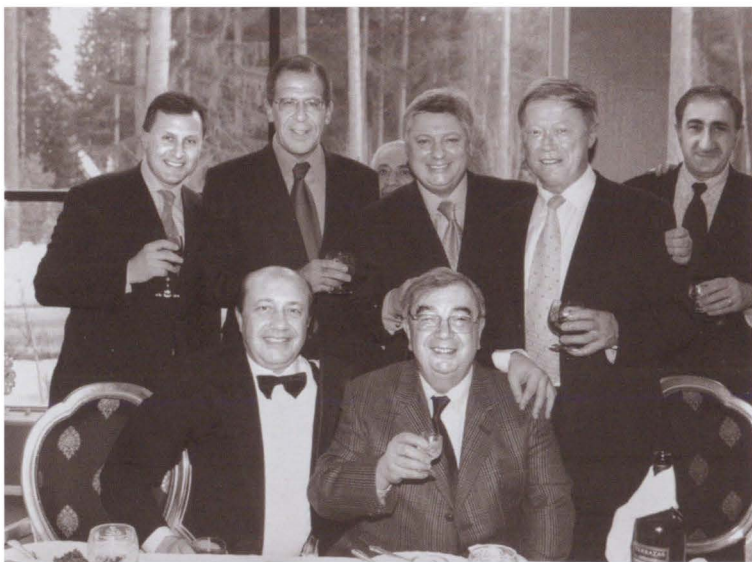
В компании мидовцев и выдающегося кардиолога Д. Г. Иоселиани (крайний справа)