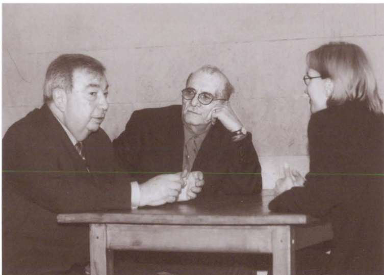
С великим кинорежиссером и другом Георгием Данелия