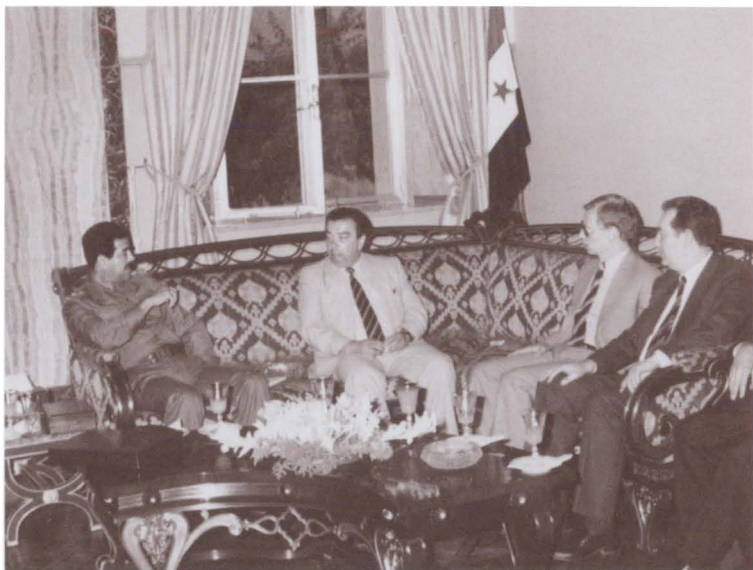
Одна из первых встреч с Саддамом Хусейном. 1975 г.