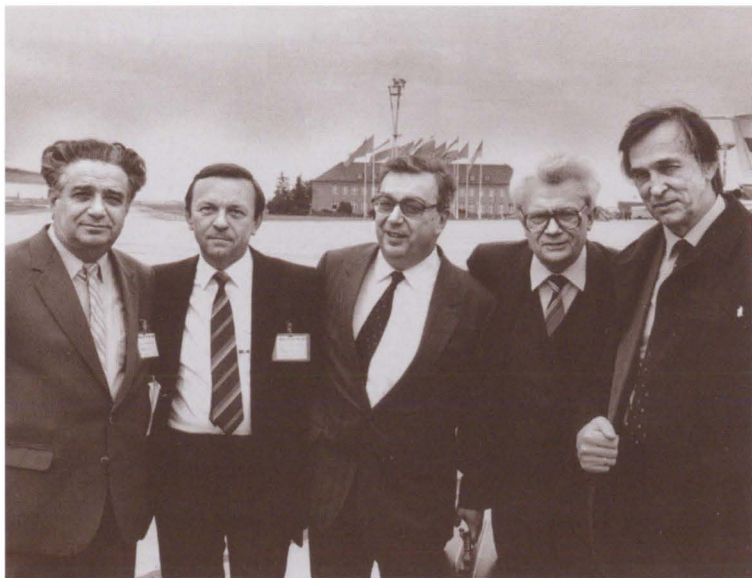
«Десант», высаженный в Индии перед визитом М. С. Горбачева. 1986 г.