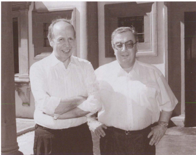
С Ламберто Дини, министром иностранных дел Италии