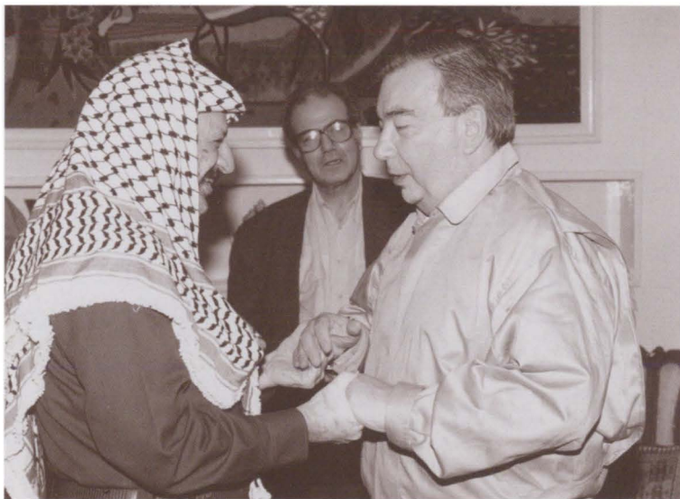
С Ясиром Арафатом

Муамар Каддафи всегда принимал гостей в бедуинской палатке