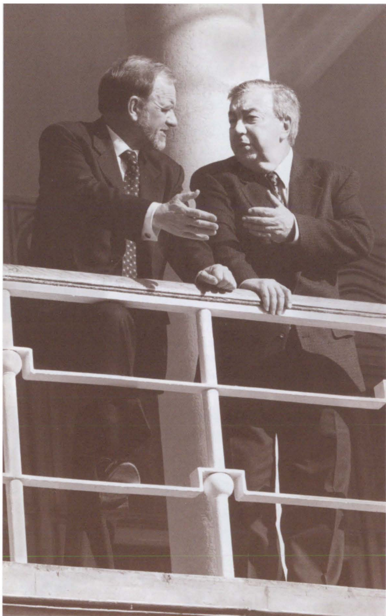
С министром иностранных дел Великобритании Р. Куком