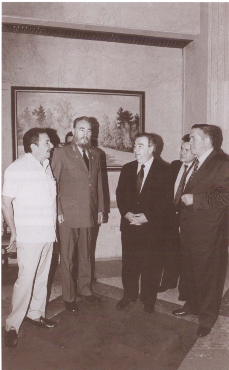
На Кубе. С Фиделем и Раулем Кастро теплые отношения установились сразу, без «притирки». 1994 г.