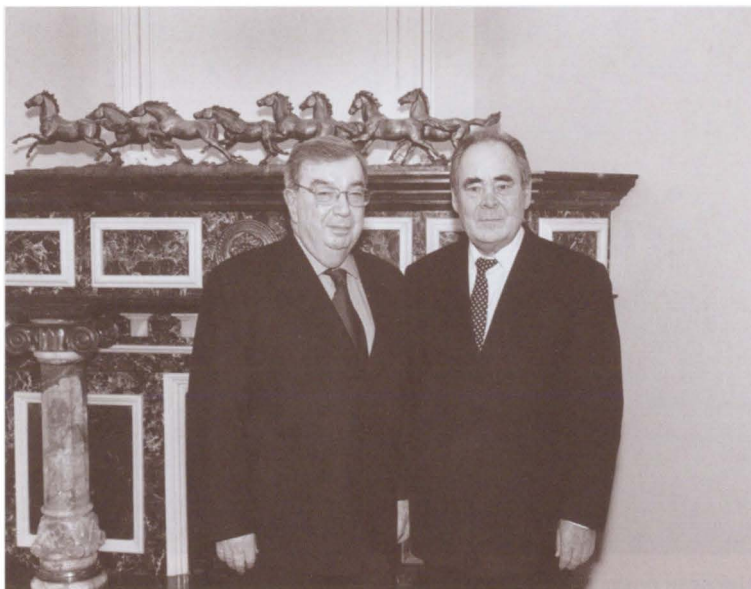
С одним из самых эффективных региональных лидеров России Минтимером Шариповичем Шаймиевым. 2005 г.