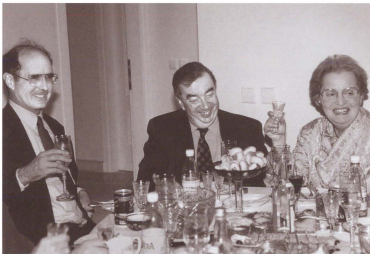
Мадлен Олбрайт и Строб Тэлботт в гостях у Евгения Примакова. После посещения ими гостеприимного дома Евгения Максимовича произошел перелом в трудных переговорах. 1997 г.

Заседание контактной группы в Бонне 6 марта 1998 года. Министр иностранных дел Германии Клаус Кинкель, который не дрогнул под напором госсекретаря США