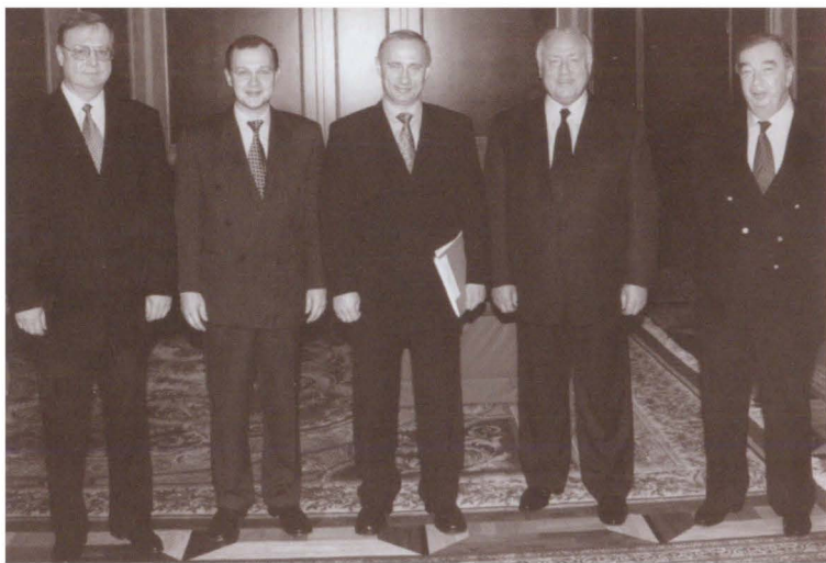
Пять председателей правительства России