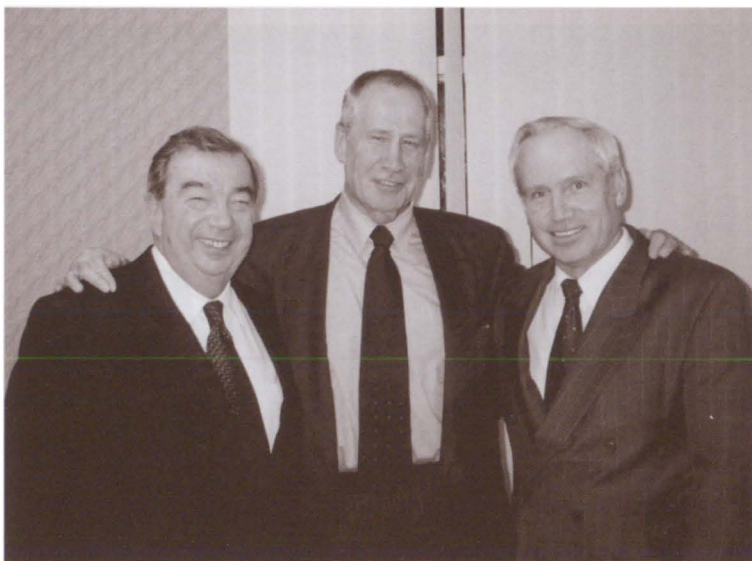
Маркус Вольф — легендарный руководитель разведки ГДР. Справа — директор Службы внешней разведки России (СВР) С. Н. Лебедев. 2005 г.