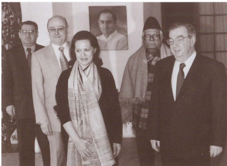
Посещение вдовы Раджива Ганди