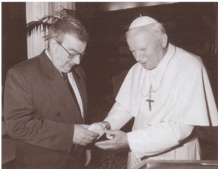
Прием у папы римского Иоанна Павла II