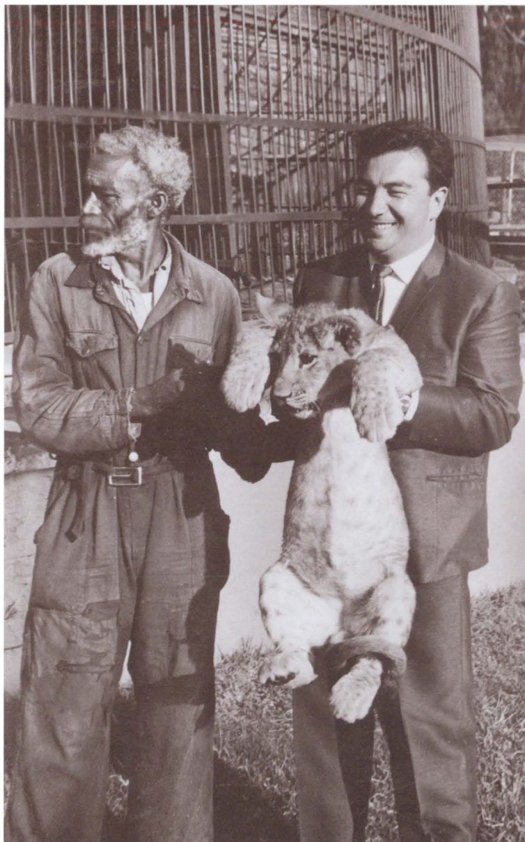
Собкор «Правды» в арабских странах и Эфиопии. 1966 г.