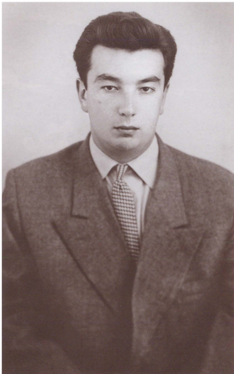
Аспирант Московского государственного университета. 1954 г.