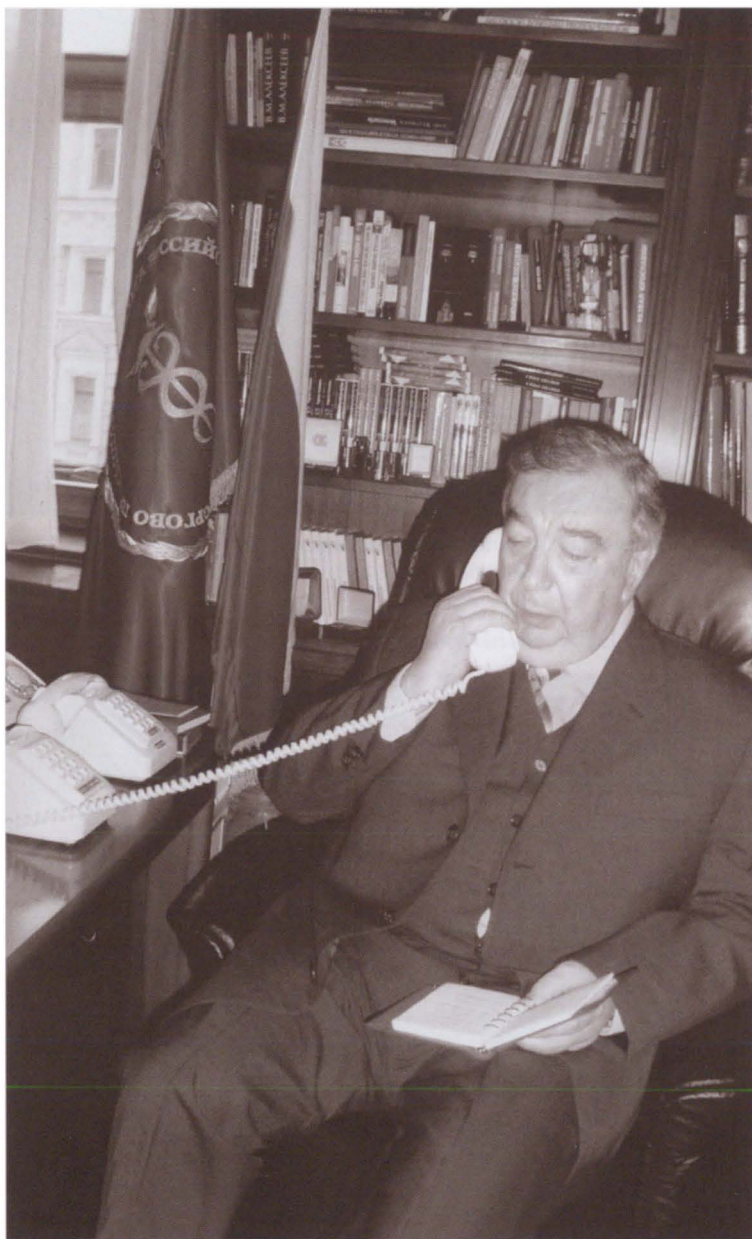
В Торгово-промышленной палате работы не меньше, чем в правительстве