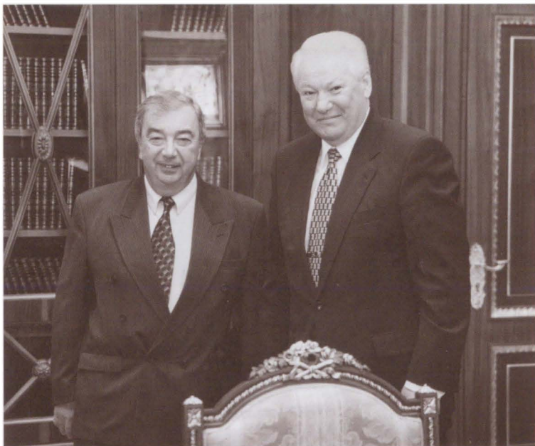
С президентом Б. Н. Ельциным

Разносторонний Жак Ширак — и президент Франции, и переводчик Пушкина на французский язык