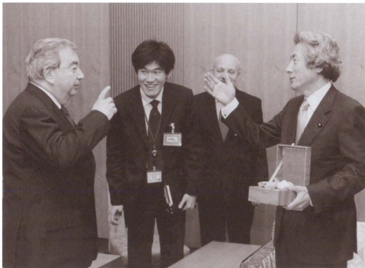
Неужели опять премьер-министр Японии Коидзуми заговорит о «северных территориях»? 2005 г