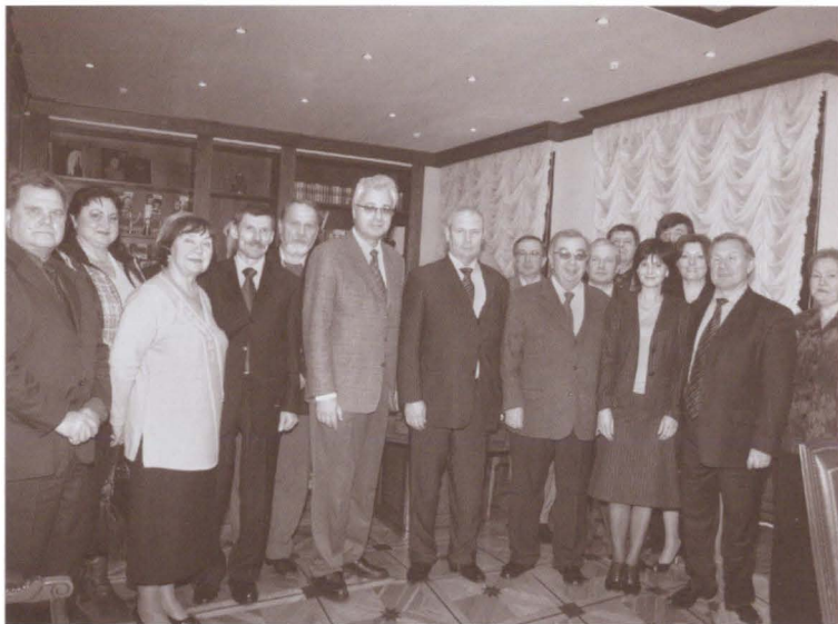
В гостях у издательства «Молодая гвардия»