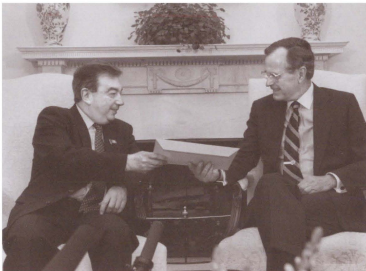
С президентом Бушем-старшим

Обаятельный, образованный, доброжелательный лидер исмаилитов Ага Хан