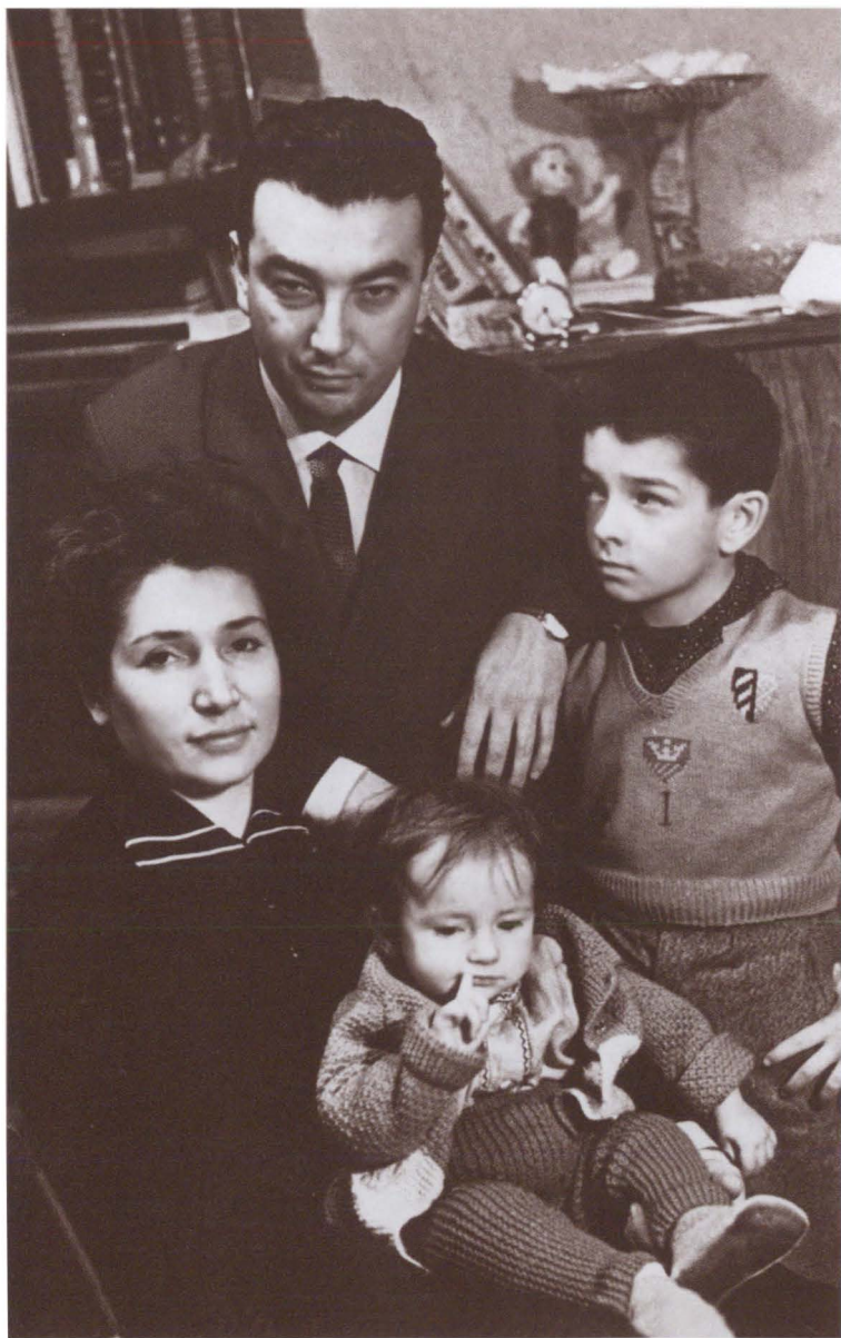
Счастливая семья. 1963 г.