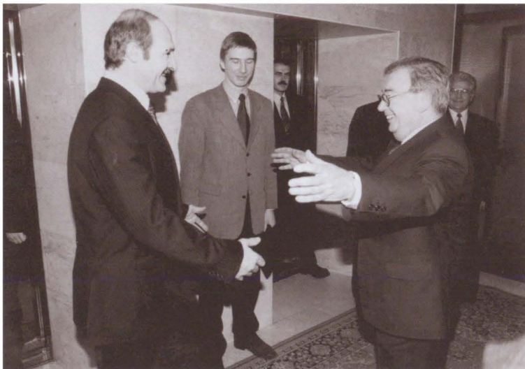
С Александром Григорьевичем Лукашенко Евгений Максимович Примаков встречался много раз, по-дружески и плодотворно