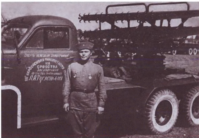
Батарея «катюш», созданная на средства Руслановой