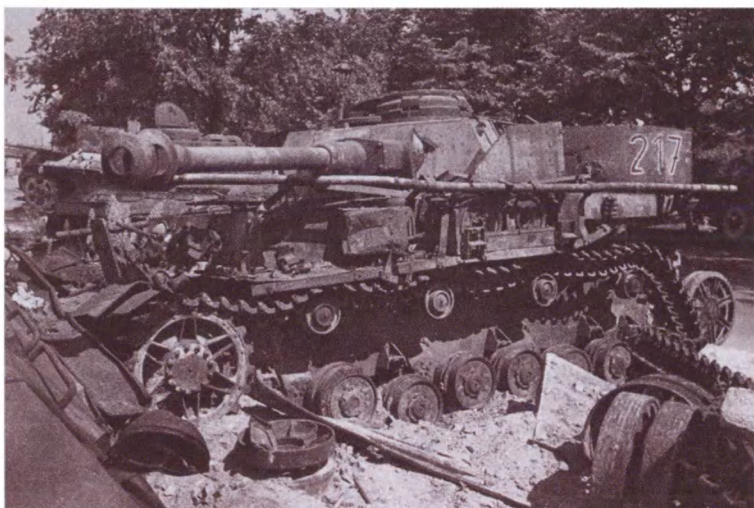
Подбитый немецкий танк PzKpfw IV Ausf. J на улицах Берлина