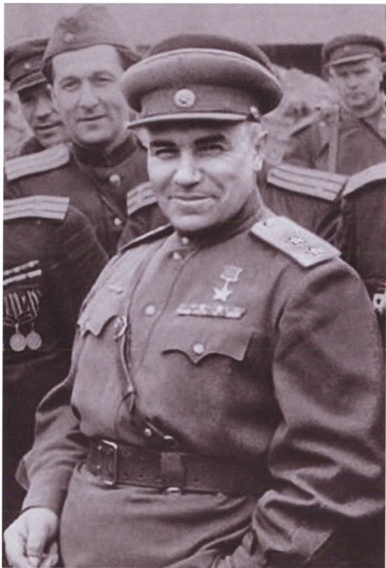
Генерал-лейтенант Н. Э. Берзарин. Апрель 1945 г.