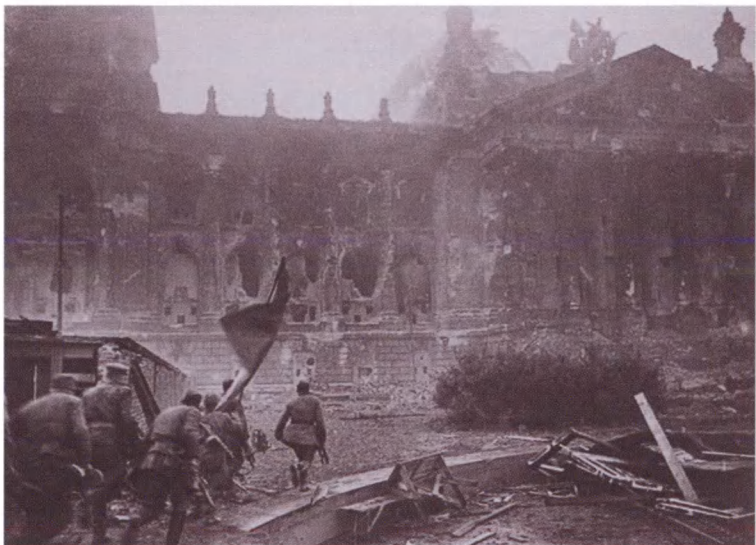
Советская штурмовая группа со знаменем направляется к Рейхстагу