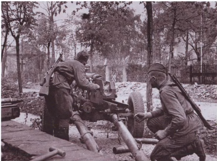
Советские артиллеристы ведут огонь по Берлину