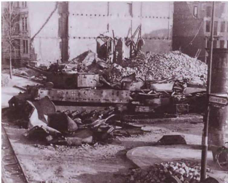
Немецкий танк «Тигр I» из состава дивизии «Мюнхеберг», оборонявший Альтонауер-штрассе в Берлине