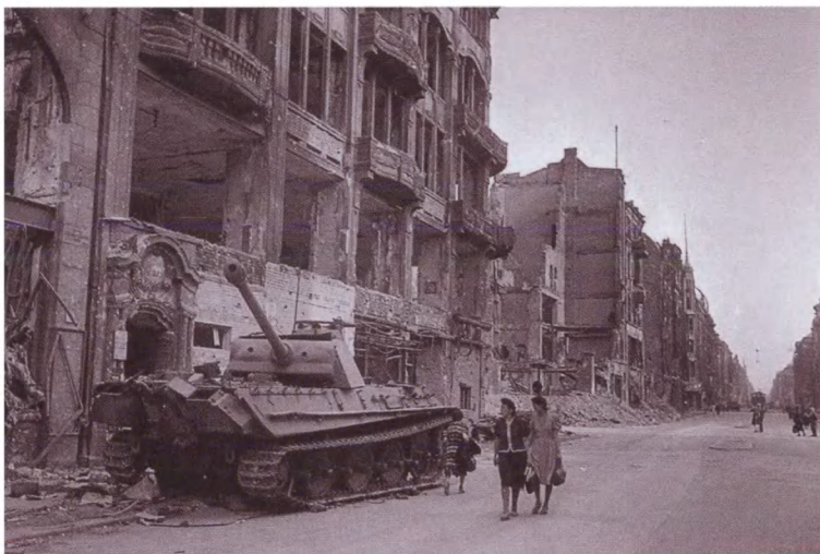
На улицах Берлина. Май 1945 г.