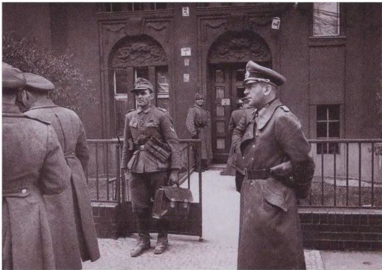
Начальник Генерального штаба сухопутных войск генерал Ханс Кребс у штаба советских войск в Берлине. 1 мая 1945 г.