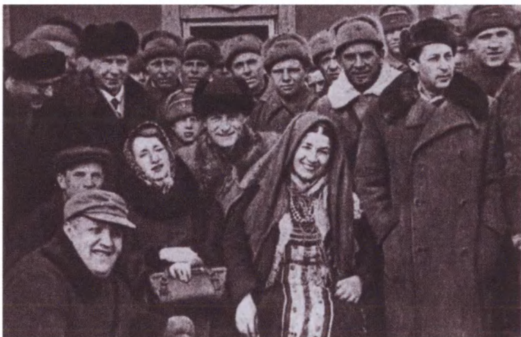
Русланова и Гаркави среди артистов фронтовой концертной бригады