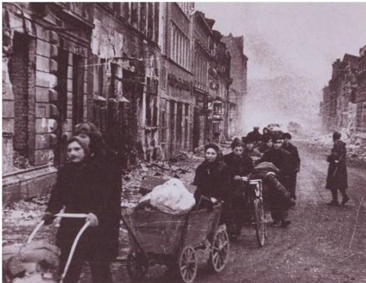
Жители Берлина, спасаясь от уличных боев, уходят в освобожденные советскими войсками районы