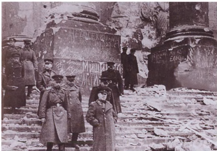
Маршал Г. К. Жуков и генерал-полковник Н. Э. Берзарин (за ним) на ступенях поверженного рейхстага

Отправка Знамени Победы на родину. В почетном карауле — 94-я гвардейская стрелковая дивизия. 20 мая 1945 г.