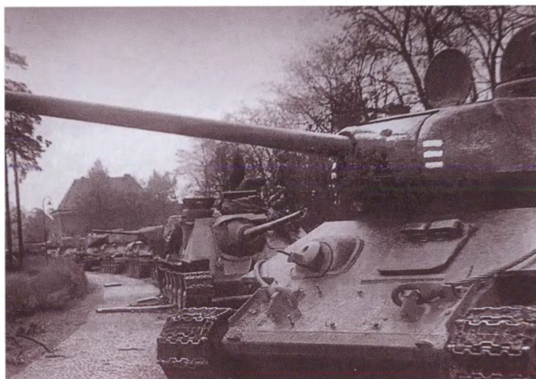
Танки 44-й гвардейской танковой бригады на улицах Уленхорста