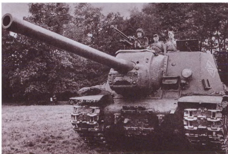
ИСУ-122 399-го гвардейского самоходного артиллерийского полка 11-го гвардейского танкового корпуса. Берлин. 1945 г.