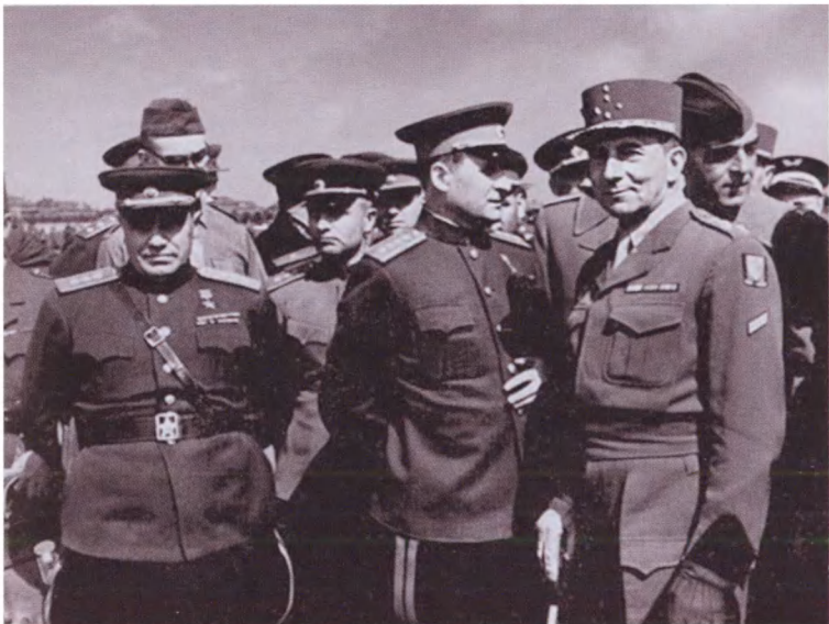
Н. Э. Берзарин (крайний слева) на Берлинском стадионе перед футбольным матчем армейских команд Франции и СССР