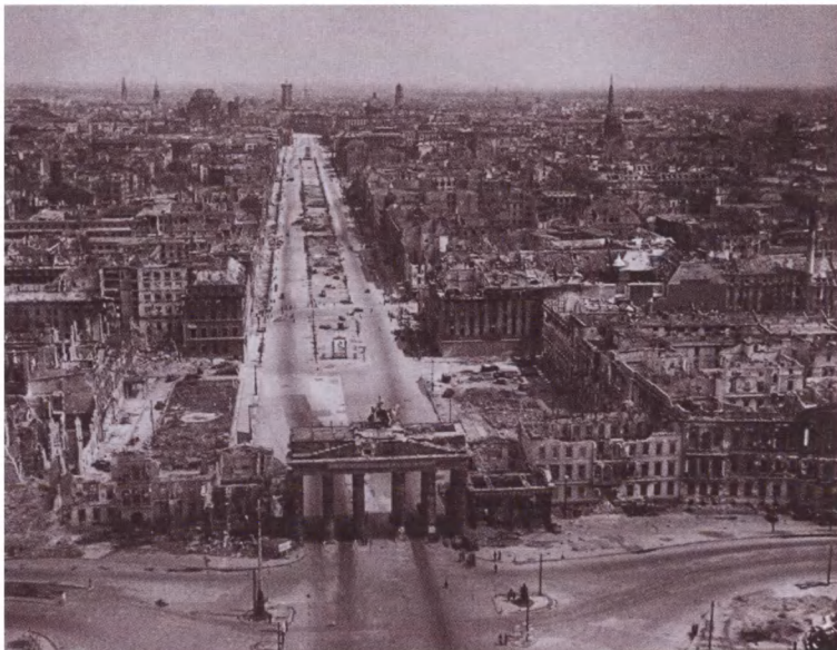
Берлин, вид на Бранденбургские ворота (съемка с самолета). Май 1945 г.