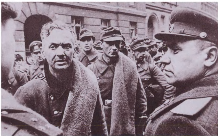
Генерал-полковник Н. Э. Берзарин опрашивает немецкого военнопленного на улице Берлина