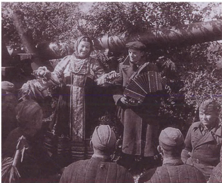
Выступление фронтовой концертной бригады перед бойцами