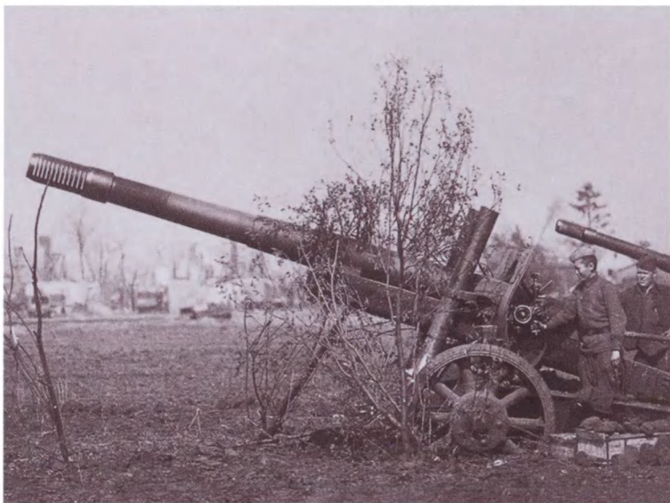
Батарея 152-мм гаубиц МЛ-20 1-го Белорусского фронта на подступах к Берлину