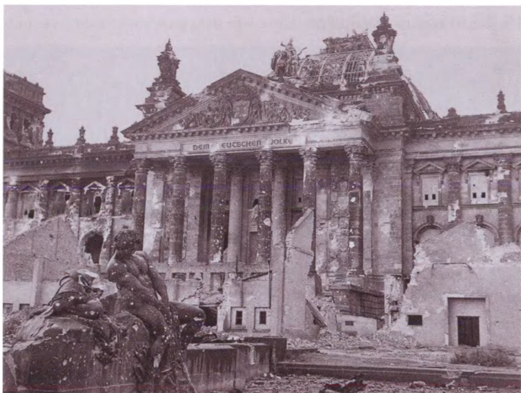
Здание Рейхстага. 3 июля 1945 г.