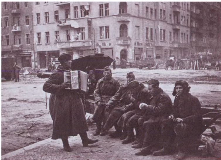
Советские солдаты слушают гармониста на улицах Берлина