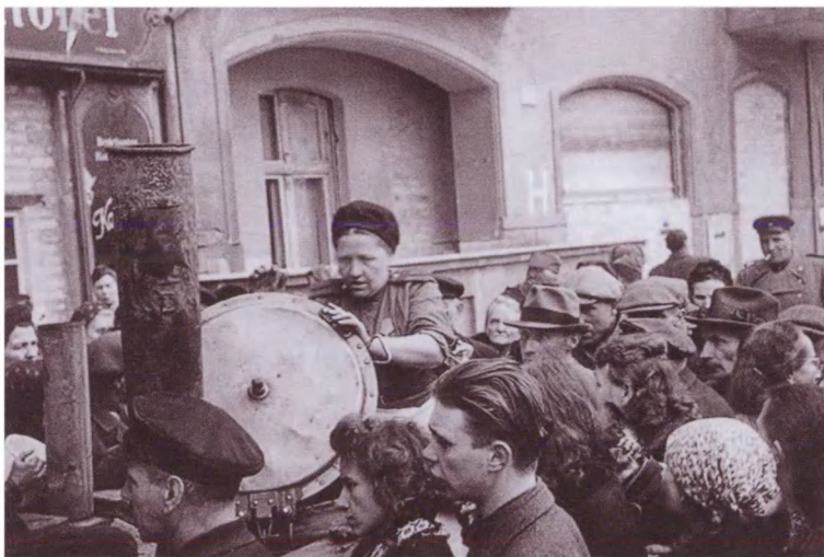
Мирные жители в очереди за едой у советской полевой кухни в Берлине