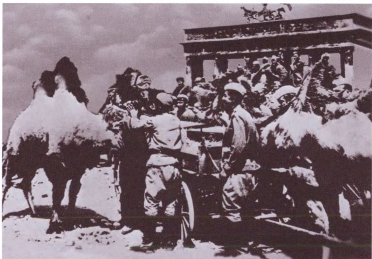
Верблюд-бактриан Володя пришел с батареями 771-го арtpолка в Берлин к Бранденбургским воротам. Май 1945 г.

В мае 1945 года комендант Н. Э. Берзарин сказал: «Берлин будет жить!»