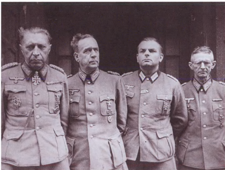
Командование Берлинского гарнизона в плену, слева — командующий обороной Берлина генерал Гельмут Вейдлинг. 2 мая 1945 г.