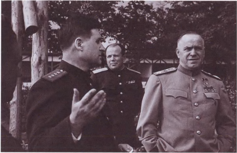
Советская делегация перед подписанием Акта о безоговорочной капитуляции. Справа — Маршал Советского Союза Г. К. Жуков, рядом с ним на переднем плане — заместитель командующего 1-м Белорусским фронтом генерал армии В. Д. Соколовский. Берлин, 8 мая 1945 г.