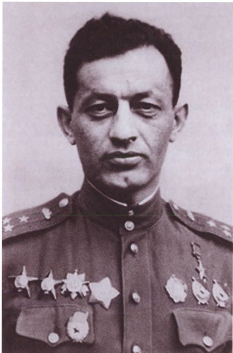
Полковник А. Х. Бабаджян во время боев в Берлине. Май 1945 г.