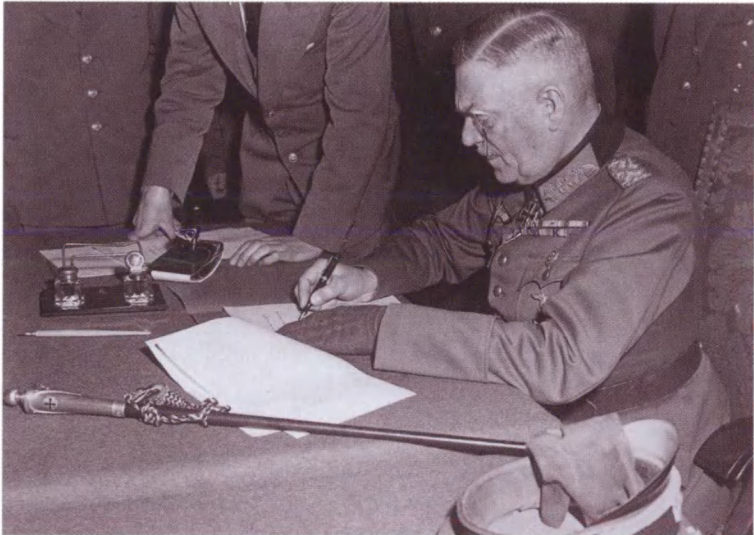
Генерал-фельдмаршал Вильгельм Кейтель подписывает Акт о безоговорочной капитуляции всех вооруженных сил Германии. Берлин, 8 мая 1945 г.