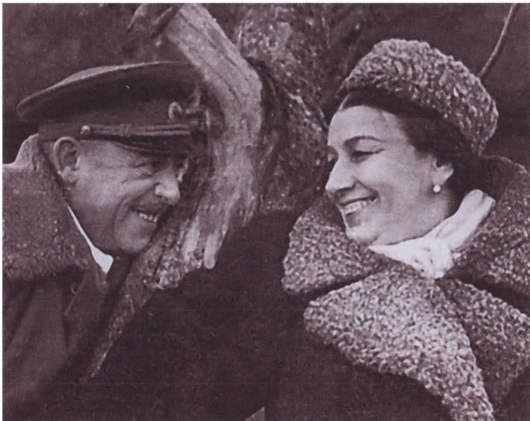
Лидия Андреевна Русланова и Владимир Викторович Крюков