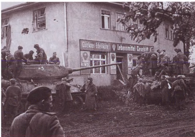
Солдаты и танки Т-34-85 12-го гвардейского танкового корпуса 2-й гвардейской танковой армии в Берлине