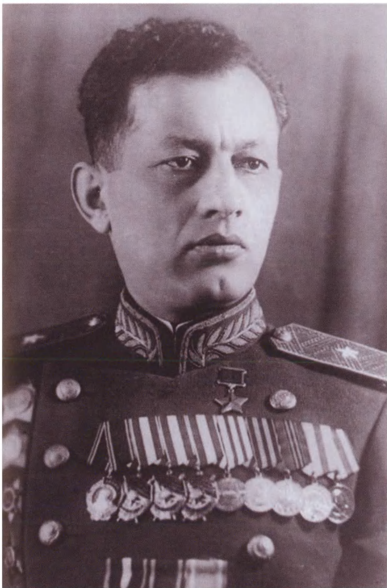
Герой войны генерал-майор А. Х. Бабаджян