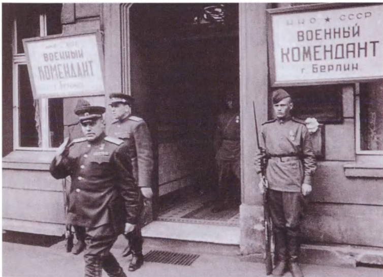
Военный комендант Берлина генерал Н. Э. Берзарин