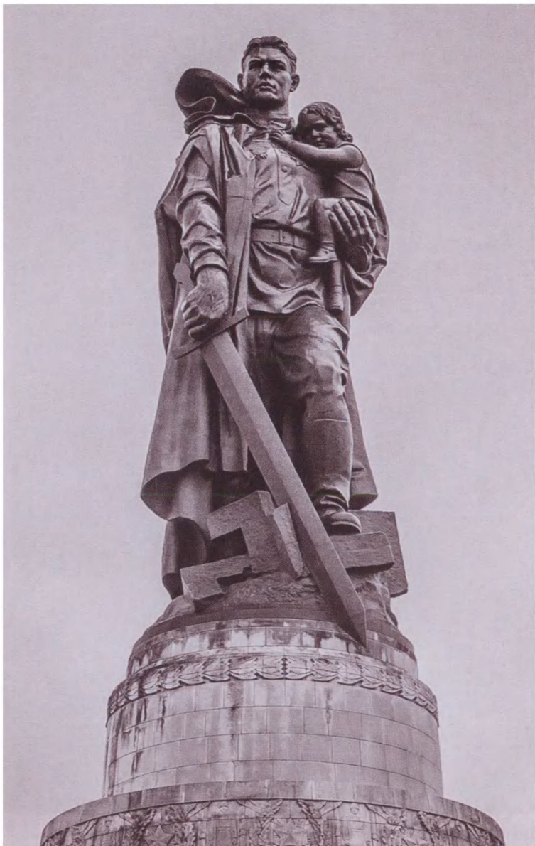
Монумент «Воин-освободитель» в Трептов-парке (Берлин). Скульптор Е. В. Вучетич, архитектор Я. Б. Белопольский, художник А. В. Горпенко, инженер С. С. Валериус. Открыт 8 мая 1949 года