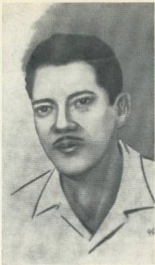
Никарагуанский патриот Ригоберто Лопес Перес, уби́вший в 1956 году диктатора Анастасио Сомосу.