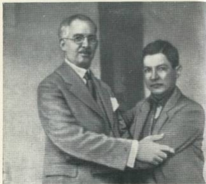
За несколько минут до убийства. Президент Никарагуа Хуан Сомоса «дружески» обнимает Сандово.