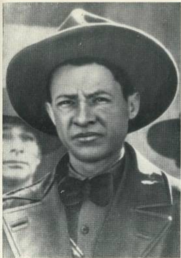
Аугусто Сесар Сальдио в 1934 году.