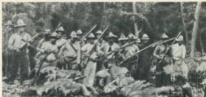
Партизаны в горах.