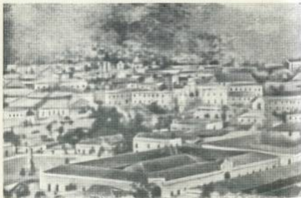
В 1921 г. Сандино работал в столице Гондураса Тегусигальпе.