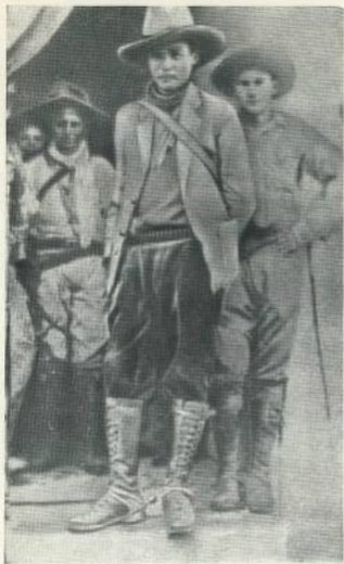
Аугусто Сесар Сандино со своими ближайшими помощниками.