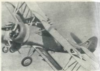
Этот американский стеритник был сбит партизанами Сандино.