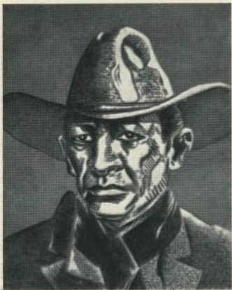
Портрет Сандино работы художника Ислас Альянде.