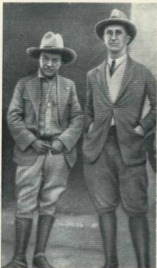
Февраль 1933 г. Рамон де Белаустегинготиа в ла- гере Сандино и Сан-Рафаэле дель Норте.