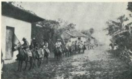
Колонна сандвинстов входит в лагерь в Сан-Рафаэль дель Норте.