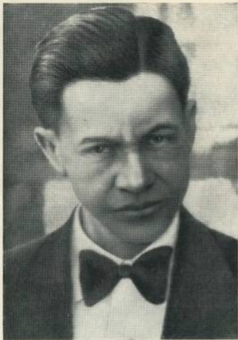
Аугусто Сесар Сандино в начале двадцатых годов.