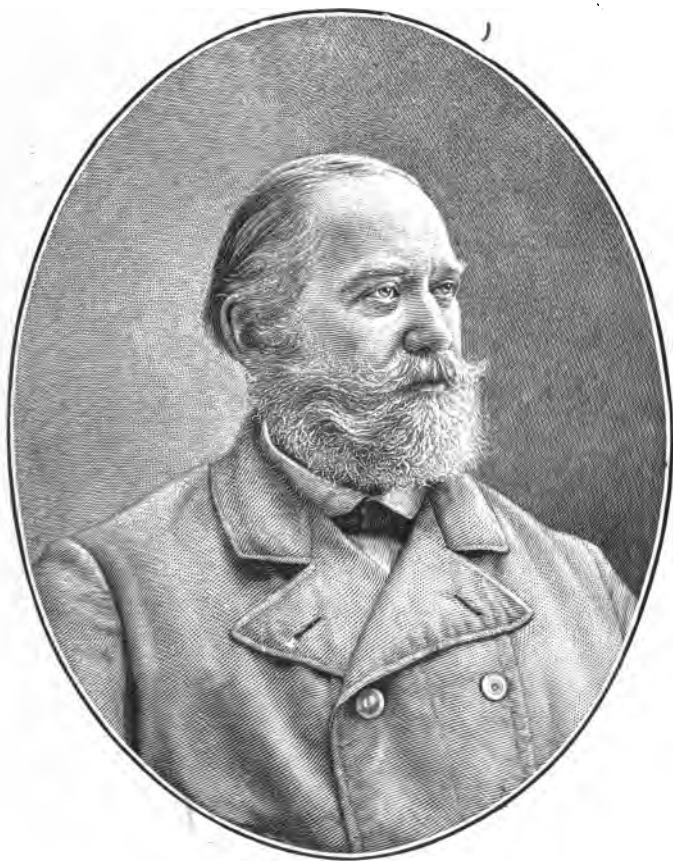
С. М. СОЛОВЬЕВЪ.