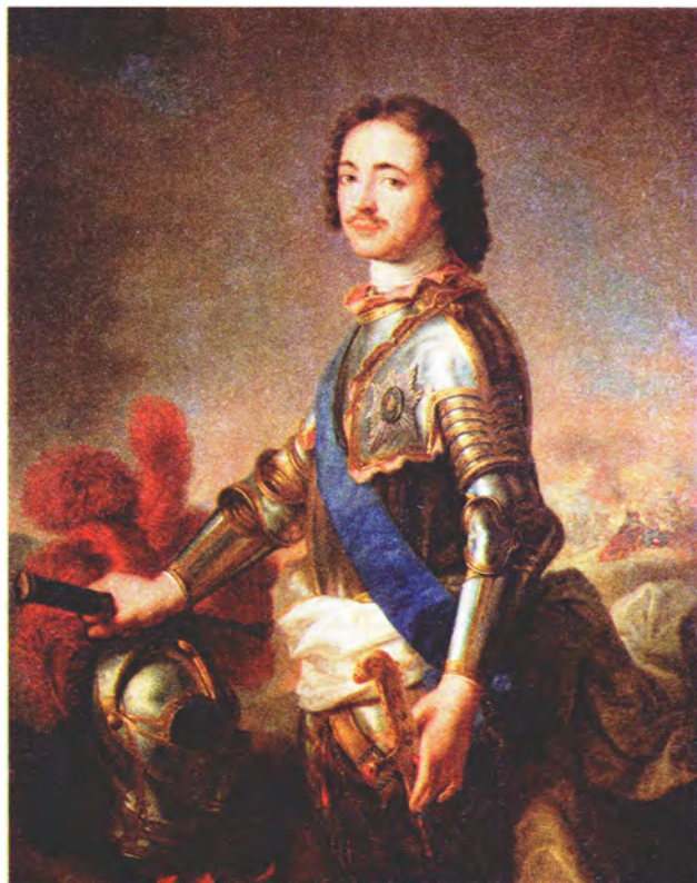
Ж.-М. Натье Петр I в рыцарских доспехах