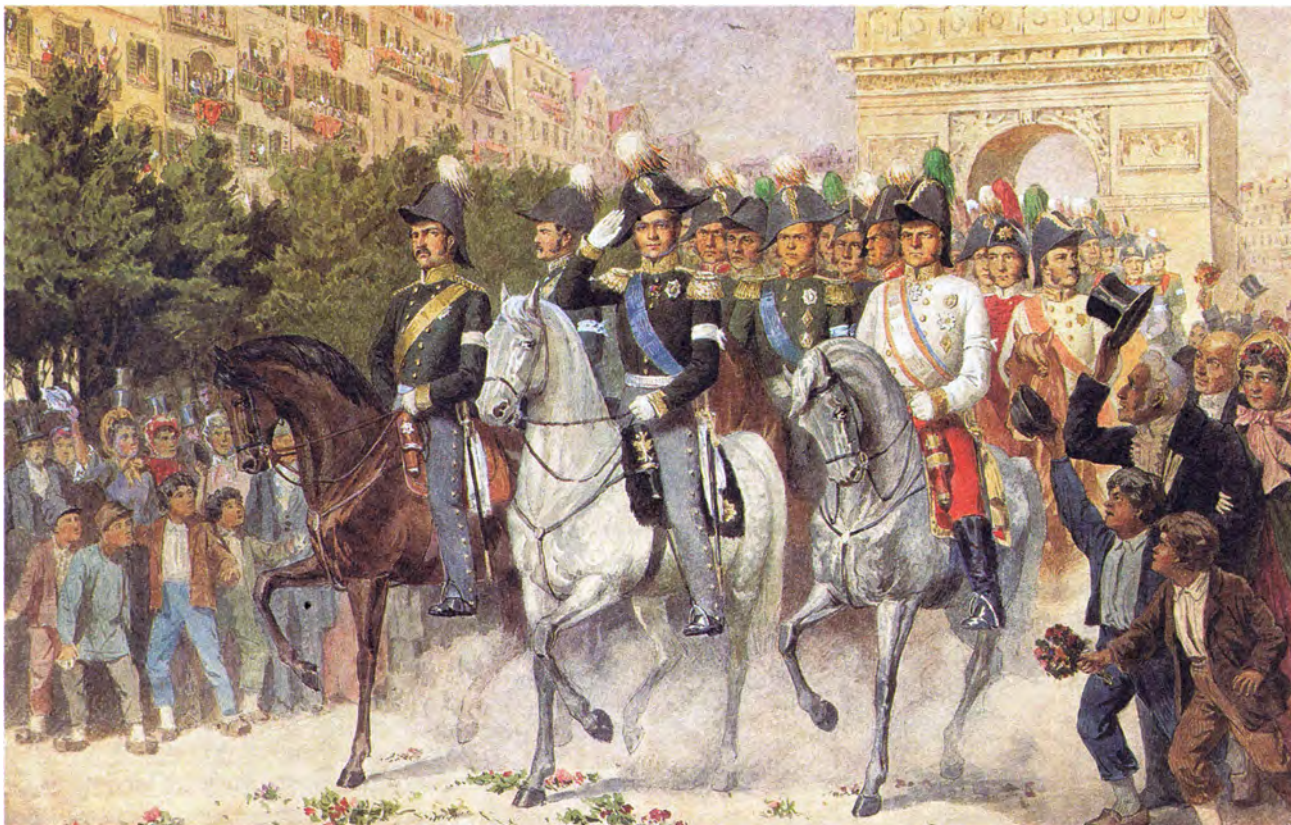
А. Кившенко Вступление русских и союзных войск в Париж

отпустил всех пленных, сказав, что никогда не воевал с французским народом, поэтому вступление русских войск в город парижанами было встречено восторженно.