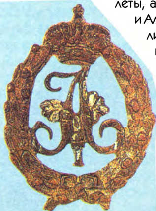
Знак для офицеров и нижних чинов лейб-гвардии Преображенского и Семеновского полков, которые служили в царствование Императора Александра I

За особые заслуги воинским частям даровалось вензельное изображение коронованных особ. Так, по смерти Александра I все роты царя лейб-гвардии Преображенского и Семеновского полков были пожалованы вензелем Александра I на погоны и эполеты, а по смерти Николая I и Александра II вензеля были пожалованы частям, шефами которых они являлись. С переходом в другие полки вензеля снимались.