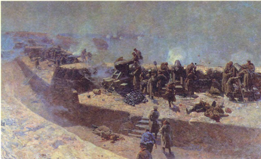
Ф. Рубо Отражение бомбардировки англо-французского флота со стороны Александровской батареи 5 октября 1854 года. Севастополь