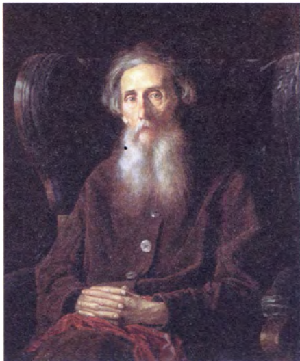
В. Перов Портрет писателя В.И. Даля