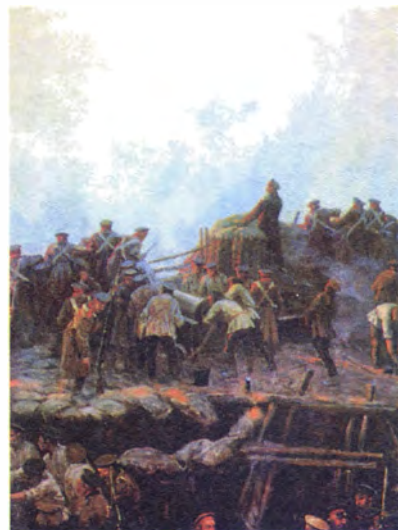
Ф. Рубо Вице-адмирал П.С. Нахимов руководит боем