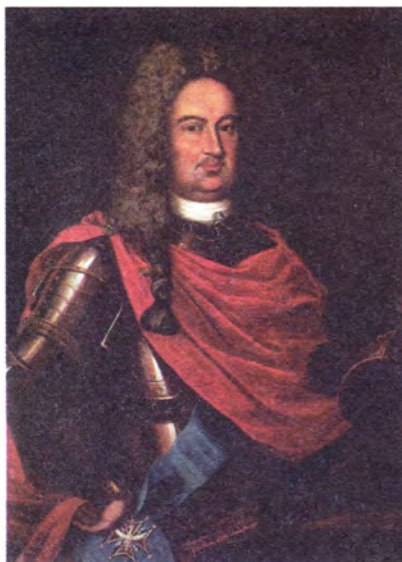
И. Никитин Портрет генерал-фельдмаршала Бориса Петровича Шереметева

Согласно «Табели о рангах», каждый род службы делился на 14 классов. Самым редким в истории российской армии оказался