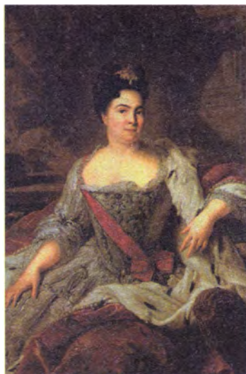
Неизвестный художник Портрет Екатерины I