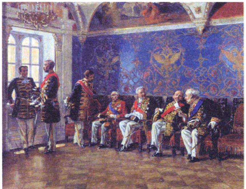
В. Маковский В ожидании аудиенции

так и по гражданскому ведомству. Для гражданских лиц высшим почетным званием был статс-секретарь, который имел право лично докладывать о делах императору и объявлять его устные повеления.