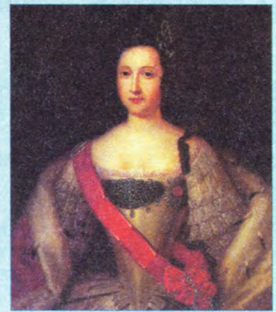
Л. Каравак Портрет Анны Леопольдовны

Неизвестный художник Портрет А.В. Суворова с фельдмаршалским жезлом