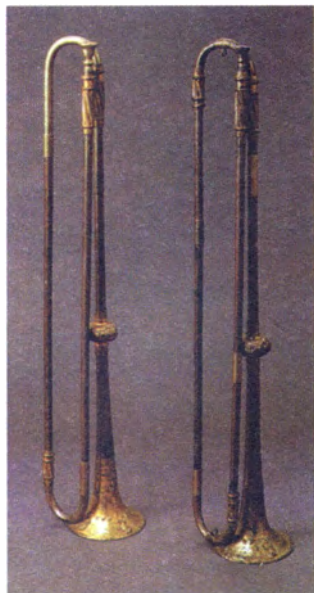
Наградные серебряные трубы-фанфары за занятие Берлина 28 сентября 1760 года