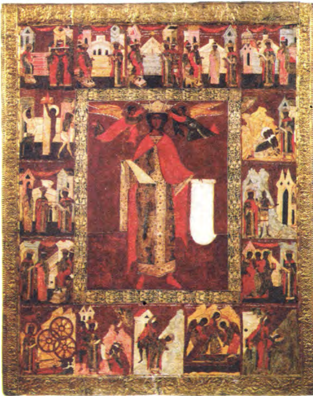
Великомученица Екатерина в житии Икона. Вторая половина XVI века