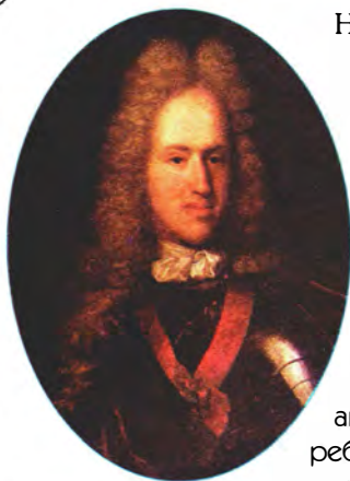
Неизвестный художник Портрет М.М. Голицына

В музеях нашей страны хранятся палаш князя М.В. Скопина-Шуйского, сабли князя Д.М. Пожарского и Б.М. Хитрово. На клинке сабли Хитрово (Царскосельский музей) золотая надпись: «Государь Царь и Великий Князь Михаил Федорович всея Руси пожаловал сею саблею стольника Богдана Матвеевича Хитрово».