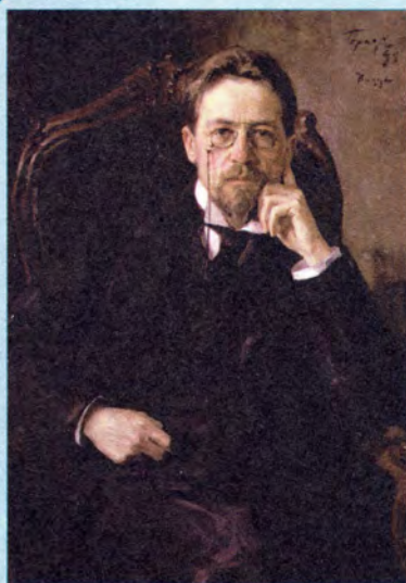
И. Браз Портрет А.П. Чехова

В общем порядке старшинства российских орденов орден Святого Станислава следовал за орденом Святой Анны.