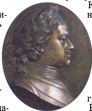
М. Колло Император Петр I

Новый дворянский титул — граф — появился в России на рубеже XVII—XVIII веков. Сначала значение этого титула было не очень понятно для русских людей. Однако вскоре он стал очень