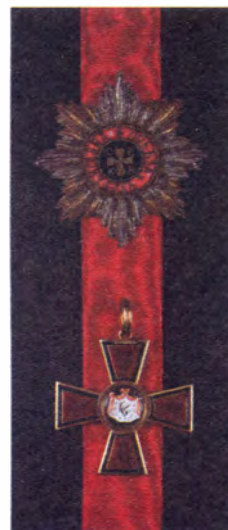
Звезда и знак ордена Св. Владимира

пени, и каждый российский чиновник надеялся получить его, так как вместе с ним (до 1900 года) давалось и потомственное дворянство.