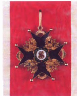
Лента и знак ордена Св. Станислава I степени