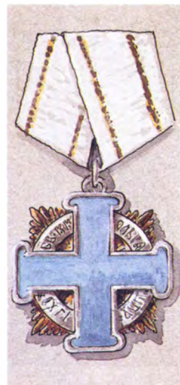
Проектный рисунок знака отличия (первоначально ордена) Св. княгини Ольги

терявшая в Первую мировую войну трех сыновей. Все три брата были Георгиевскими кавалерами.