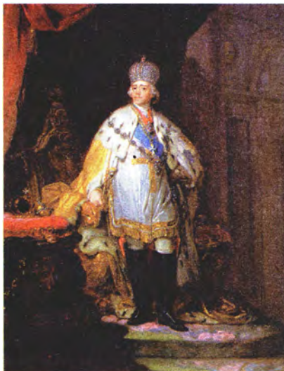
В. Боровиковский Портрет Павла I в белом далматике