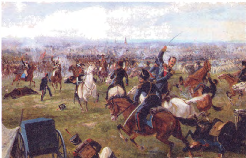
И. Львов Казачи атамана Платова в Бородинском сражении

Этой наградой очень гордился А.В. Суворов, который получил ее в декабре 1771 года за «совершенное разбитие войск литовского гетмана, графа Огинского».