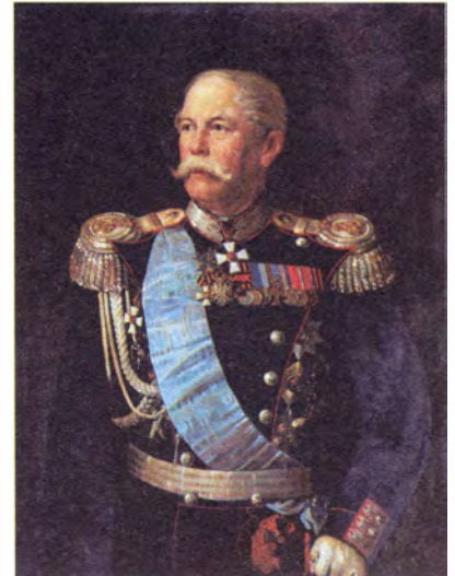
Неизвестный художник Военный инженер генерал-адъютант граф Э.И. Тотлебен

Героизм защитников Севастополя был отмечен установлением медали не «За победу», а впервые в истории России — «За защиту». 26 ноября 1856 года император Александр II учредил медаль «За защиту Севастополя».