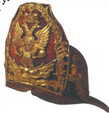
Шапка гренадерская, лейб-кампанская. 1741 год

Надписи на головных уборах. На старинных картинах, портретах или книжных иллюстрациях мы видим иногда армейские головные уборы с металлическим щитком или ленточкой с надписью: «За отличие». Первые такие знаки отличия пожалованы по инициативе М.И. Кутузова 13 апреля 1812 года, став потом обычной боевой наградой армейских полков. Гвардейские полки в наполеоновских войнах ими не отмечались.