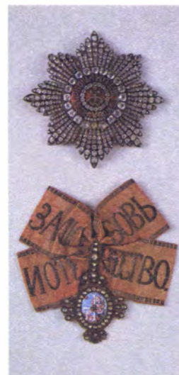
Звезда и знак ордена Св. Екатерины

Устанавливая новую награду, Петр I хотел выразить признательность жене, делившей с ним и русскими воинами все тяготы и опасности этого похода.