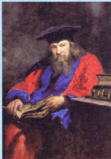
И. Репин Портрет Дмитрия Ивановича Менделеева

Первое место по числу полученных Демидовских премий занимал великий русский хирург Н.И. Пирогов: он был награжден тремя полными и двумя половинными премиями. На вто-