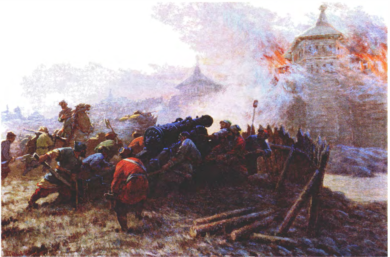
В. Бодров Осада Казани в 1552 году