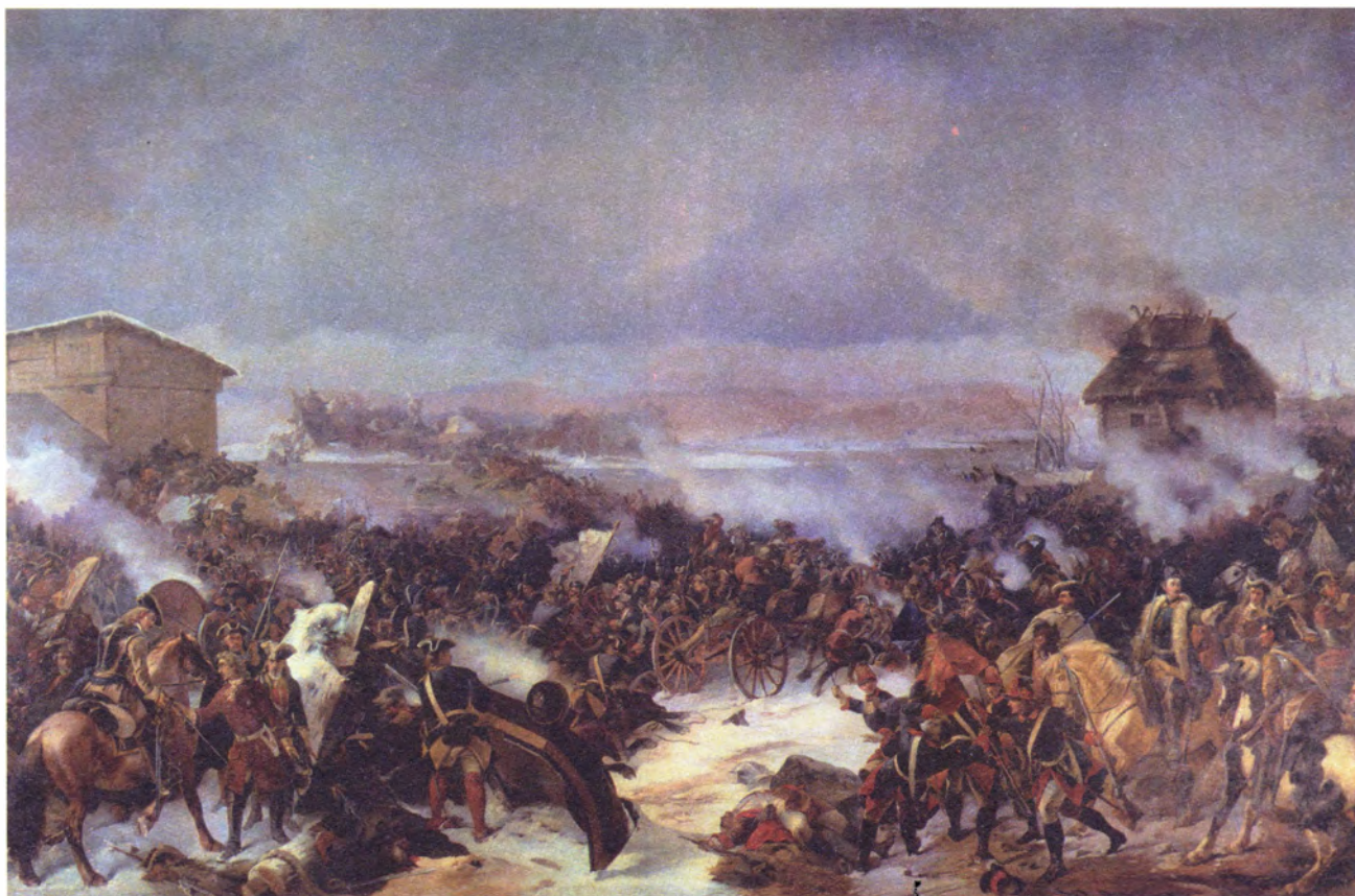
А. Коцебу Сражение под Нарвой 19 ноября 1700 года

Офицерский знак пожалован Петром I всем офицерам Преображенского и Семеновского полков в 1701 году за сражение под Нарвой. Офицерский знак представляет собой пластину в форме полумесяца с закругленными концами, носимую на груди.