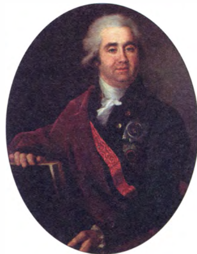
Д. Левицкий Портрет Александра Андреевича Безбородко

почетным: он принадлежал видным вельможам, знатным сановникам и близким к государю людям.