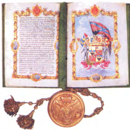
Грамота Екатерины II, жалованная графу А.Г. Орлову на изменение в гербе в связи с победой при Чесме 25–26 июня 1770 года