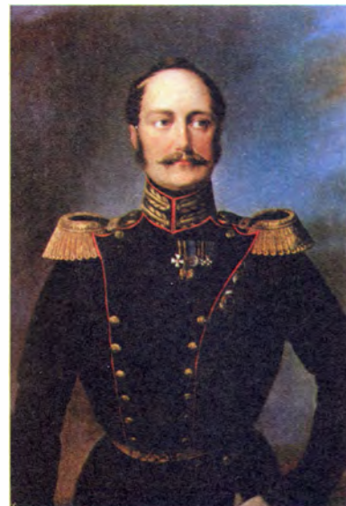
Неизвестный художник Портрет императора Николая I

в христианских добродетелях или отличной ревностью к службе на поприще военном, как на суше, так и на морях, или гражданском, или же в частной жизни, совершением какого-либо подвига на пользу человечества или общества, или края, в которых живет, или целого Российского государства обратит на себя особенное внимание».