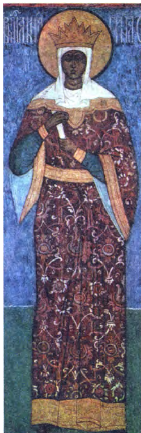
Святая княгиня Ольга Фреска Архангельского собора Московского Кремля

В 1907 году Православное общество Святой княгини Ольги выступило с инициативой учредить особый женский орден в честь княгини, которую Православная церковь причислила к рангу равноапостольных святых. Им предполагалось награждать женщин за следующие деяния: