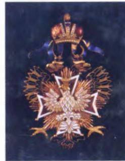
Знак ордена Белого Орла