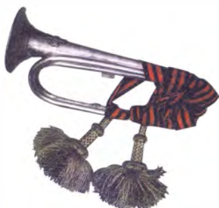
Наградная Георгиевская серебряная труба

Серебряные и Георгиевские серебряные трубы. Некоторые рода войск, например артиллерия или саперы, знамен не имели. Зато необходимой принадлежностью почти всех частей служили трубы, рожки и барабаны, которыми подавались сигналы в походах. Возник обычай награждать отличившиеся в сражениях части серебряными трубами, которые позже назывались Георгиевскими серебряными трубами.