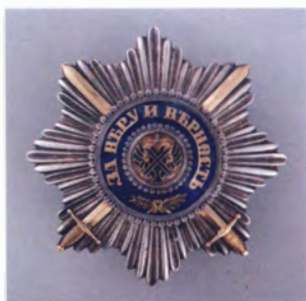
Звезда ордена Св. Андрея Первозванного