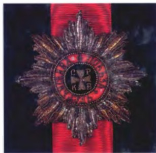
Звезда и лента ордена Св. Владимира