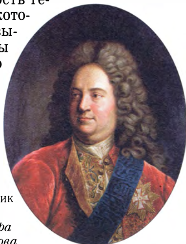
Неизвестный художник Портрет вице-канцлера Петра Павловича Шафирова

Вместе с аристократическими титулами Петр I позаимствовал в Европе и внешние знаки дворянского достоинства — гербы и дипломы на дворянство. В 1722 году он учредил должность герольдмейстера, которому и повелел выдавать дипломы на дворянство и гербы всем дворянам, дослужившимся до высших офицерских чинов.