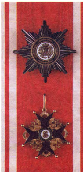
Звезда, лента и знак ордена Св. Станислава I степени

Среди российских наград орден Святого Станислава III степени был самым «младшим» и потому являлся наиболее распространенной наградой. Согласно статуту ордена им мог быть награжден любой гражданин Российской империи, «кто преуспеванием