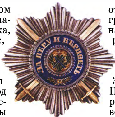
Звезда ордена Св. Андрея Первозванного с мечами

5 апреля 1797 года, в день своего коронавания, император Павел I подписал особое «Уставление об орденах». По этому «Уставлению» орден Андрея Первозванного стал главной наградой России и жаловался по усмотрению царя.