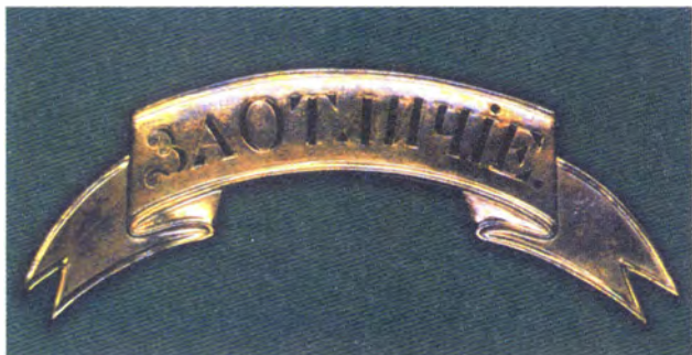
Коллективная награда — почетная надпись на головной убор чинов отличившейся военной части

Трубы обвивались георгиевской лентой с кистями, а на их раструбе укреплялся знак ордена Святого Георгия.