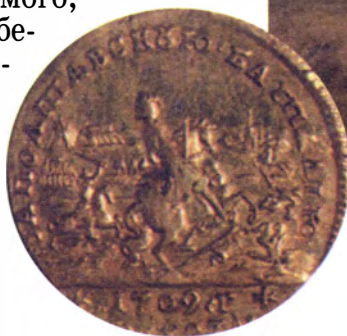
Золотая медаль «За Полтавскую баталлию 27 июня 1709 года»