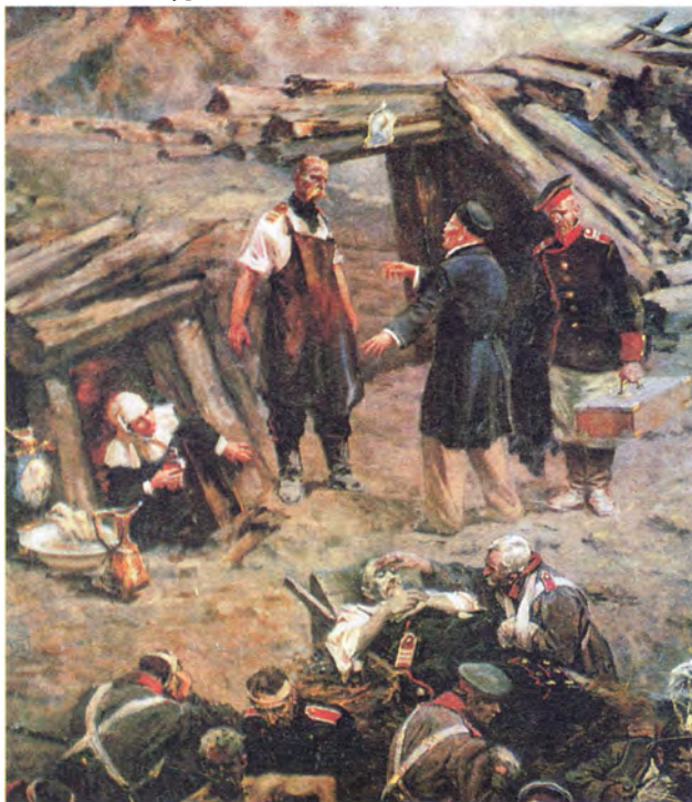
Ф. Рубо Хирург Н.И. Пирогов на перевязочном пункте Малахова кургана

С 1855 года за боевые заслуги орден Святого Владимира стали выдавать с мечами: на знаках высшей степени ордена мечи помещались сверху. Осенью 1788 года было произведено первое награждение этим орденом за военные заслуги капитан-лейтенанта Д.Н. Сенявина (будущего адмирала). Орден Святого Владимира IV степени с бантом он получил за успешную операцию — провод линейных кораблей «Мученик Леонтий» и «Святой Владимир» с верфей Херсона в Севастополь во время шторма.