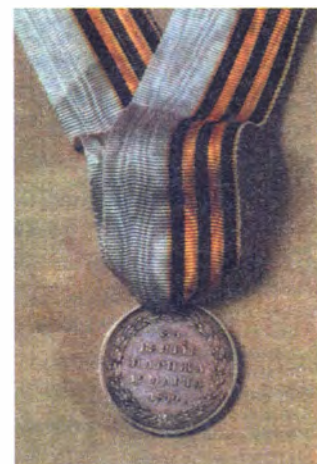
Медаль «За взятие Парижа»

Битва за парижские предместья и сам Париж оказалась жестокой и кровопролитной, но французская столица осталась целой и невредимой благодаря решению императора Александра I не мстить Парижу за пожар Москвы, а пощадить город великой европейской культуры, хоть оттуда и «выходил завоеватель для разорения России». Русский император много сделал для Парижа: он освободил дома парижан от солдатского постоя, запретил воинам брать себе что-либо бесплатно и строго следил за исполнением этого приказа. Русский император