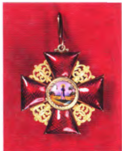
Лента и знак ордена Св. Анны