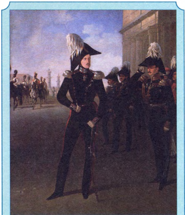
А. Ладюрнер Николай I принимает рапорт

Николай I в день своего коронования 22 августа 1827 года установил «Знак отличия беспорочной службы». С тех пор в этот день происходили ежегодные пожалования знака. Жаловался он как военным, так и штатским лицам. В Уставе об этом знаке отличия сказано: «Знак отличия беспорочной службы, приобретаемый трудами и постоянной нравственностью, никогда не снимается».