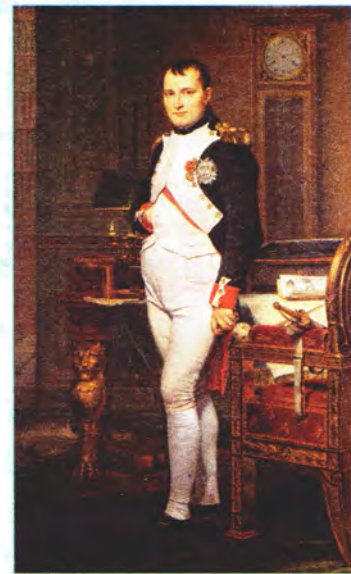
Ж.-Л. Давид Наполеон в своем рабочем кабинете

Позднее, в 1815 году, андреевским кавалером стал английский полководец герцог А.У. Веллингтон, командовавший войсками в последней битве с Наполеоном при Ватерлоо.