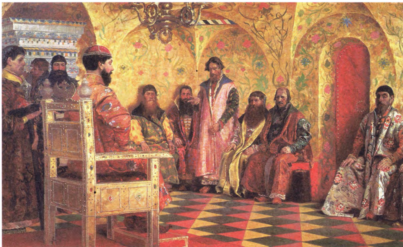
А. Рябушкин Сидение царя Михаила Федоровича с боярами в его государевой комнате

держали царскую шапку. Когда государь лично участвовал в военном походе, стряпчие несли его панцирь, меч и колчан со стрелами.