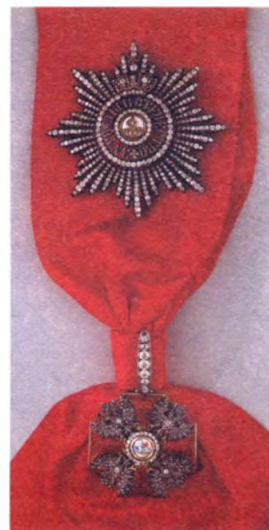
Звезда и знак ордена Св. Александра Невского

Значение пожалования орденом Александра Невского возросло 30 августа (в день святого Александра Невского) того же 1725 года, когда Екатерина I возложила на себя орденские знаки. С тех пор все российские государи (если не получали орден Александра Невского раньше) возлагали его на себя в день коронации вместе со знаками ордена Андрея Первозванного.