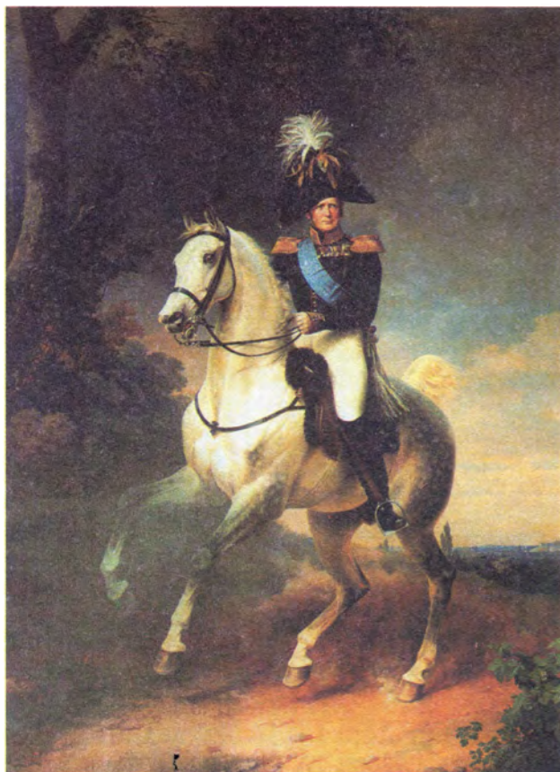
Ф. Крюгер Александр I на лошади Эклипс, подаренной ему Наполеоном I в 1808 году, въезжающий в побежденный Париж в 1814 году

Датой учреждения новой медали считается день 5 февраля 1813 года, когда Александр I подписал приказ, в котором говорилось: