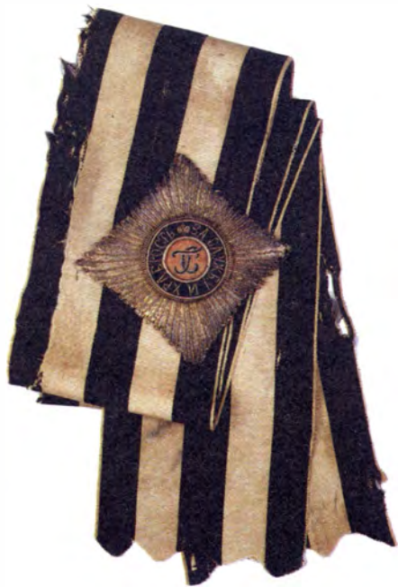
Звезда и лента ордена Св. Георгия I степени, принадлежавшие А.В. Суворову. Награда получена за победу при Рымнике в 1789 году