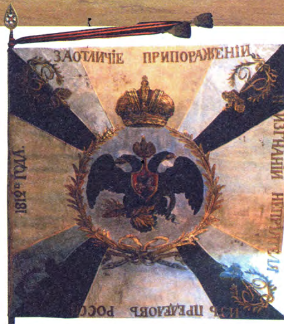
Наградное знамя лейб-гвардии гренадерского полка. 1812 год

Наградные знамена и штандарты. В конце XVIII века за первые победы над французами несколько полков были пожалованы этими знаками отличия. Во время наполеоновских войн, в Отечественную войну 1812 года и в заграничном походе их широко использовали для поощрения солдат к успешным боевым действиям.