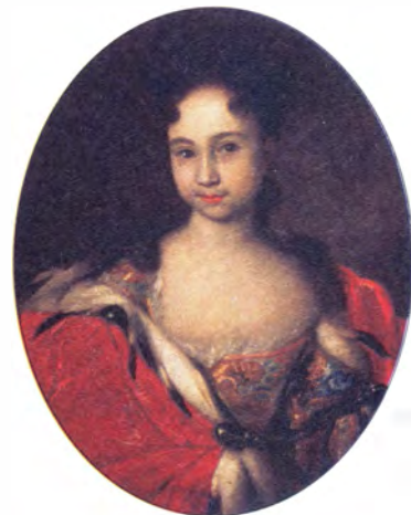
И. Никитин Портрет цесаревны Анны Петровны

В 1735 году, в день десятилетия своей свадьбы с Анной Петровной, герцог голштинский Карл Фридрих в память о супруге учредил орден Святой Анны. Девиз ордена гласил: «Amantibus Justitiam, Pietateret Fidem», что в переводе означает: «Любящим правду, благочестие и верность». Однако латинский вензель синего цвета «AJPF», начертанный на белом медальоне на оборотной стороне орденского креста, имел еще и другой смысл: «Анна — императора Петра дочь».