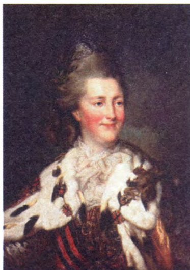
Неизвестный художник Портрет Екатерины II