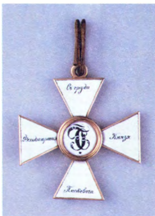
Оборотная стороны знака (креста) ордена Св. Георгия IV степени, принадлежавшего генерал-фельдмаршалу И. Ф. Паскевичу-Эриванскому

Это была очень высокая награда, недаром в статуте говорилось: «Сей орден никогда не снимать!». Орден Святого Георгия не входил в систему старшинства российских орденов, так как давался офицерам за особые подвиги в военное время или за выслугу в офицерских чинах. За все время существования Российской империи только четыре генерал-фельдмаршала удостоились высочайшей военной награды — ордена Святого Георгия всех четырех степеней. Полными кавалерами ордена Святого Георгия стали М.И. Кутузов, М.Б. Барклай-де-Толли, И.Ф. Паскевич и И.И. Дибич.