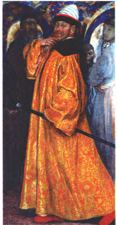
А. Рябушкин Пожалован шубой с царского плеча

Медаль, пожалованная князю В. В. Голицыну за участие в Крымских походах Москва. Конец XVII века