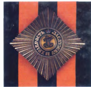
Звезда и лента ордена Св. Георгия