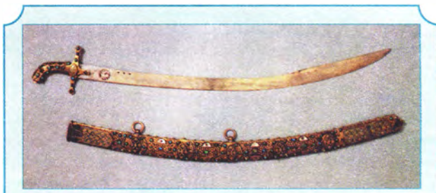
Сабля князя Д.М. Пожарского за освобождение Москвы — подарок от благодарных москвичей в 1612 году

Наградное оружие всегда делали с очень прочным клинком из булатной стали, украшали драгоценными камнями. Оно было почетной и желанной наградой. Шпага дворянина, полученная в награду сабля, морской кортик издавна считались символами чести и достоинства. Когда офицер совершал недостойный поступок, над его головой ломали клинок шпаги — своеобраз-