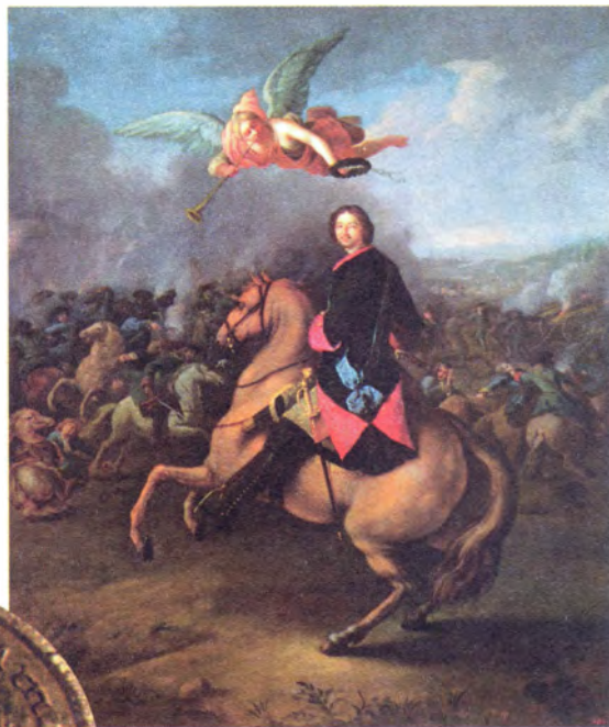
И. Таннауэр Петр I в Полтавской битве