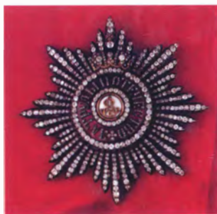
Звезда и лента ордена Св. Александра Невского