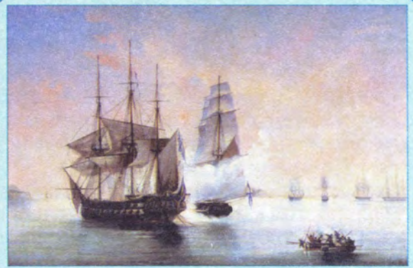
А. Боголюбов Захват катером «Меркурий» шведского фрегата «Венус» 21 мая 1789 года