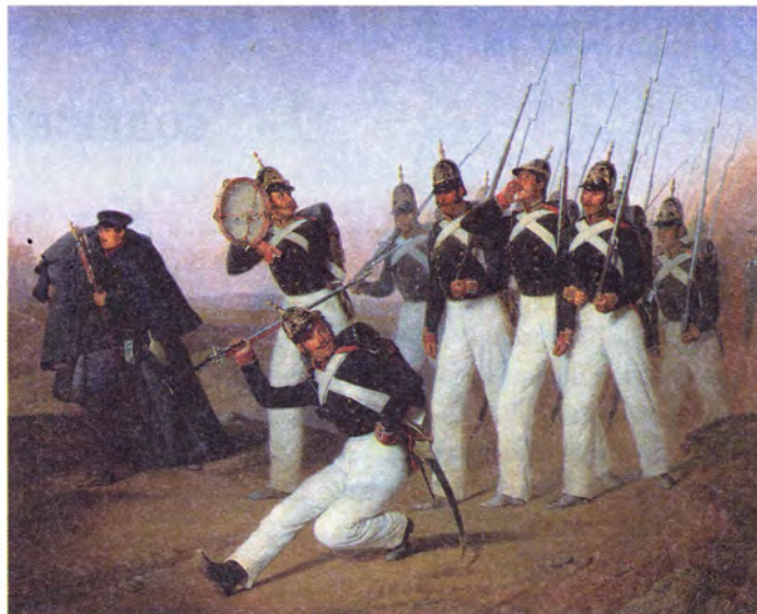
А. Гебенс Песенники лейб-гвардии Семеновского полка

Барабанный бой «Поход». Еще одна весьма своеобразная полковая награда — так называемый барабанный бой «Поход». Сигналы на учениях и в боях подавались не только трубой, но и барабаном. Определенный барабанный бой обозначал тревогу, сбор или какие-то другие конкретные команды. Существовал и маршевый барабанный бой, под который шли на смотр, на параде или на иной торжественной церемонии. Он и назывался «Поход». Причем у гвардии, у гренадер и в армии «Поход» был разный. Так вот, в качестве награды за победы в войне 1812—1814 годов некоторые армейские полки впервые по-