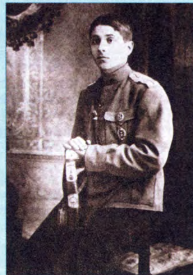
Прапорщик М.М. Зощенко. Август 1915 г. Петербург

1916 года М.М. Зощенко был награжден орденом Святого Станислава II степени — с мечами и бантом. После обследования врачи хотели направить его в тыловой запасной полк, но писатель вернулся на передовую.