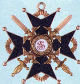
Знак ордена Св. Станислава с мечами из темной эмали

гренадерский Мингрельский полк Кавказской дивизии, в котором он служил, подвергся газовой атаке немцев, она к тому же сопровождалась сильным артиллерийским огнем. Зощенко сделал все, чтобы спасти свою роту и в то же время удержать боевые позиции. Несмотря на ранение, сам он оставался в строю до тех пор, пока боль не стала нестерпимой. В сентябре