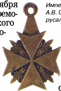
Солдатский знак ордена Св. Иоанна Иерусалимского

Мальтийского креста, которую носили на левой стороне.