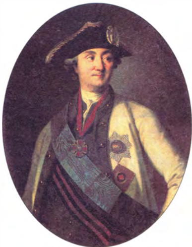
К.-Л. Хрестинек Портрет адмирала графа А.Г. Орлова-Чесменского