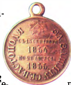
Медаль «За защиту Севастополя в 1854–1855 гг.»

оружия, в том числе построили более 20 новых укреплений для артиллерийских батарей.