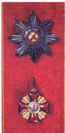
Звезда и знак ордена Св. Анны

По случаю рождения герцога Петра Ульриха в Киле проводились торжества и праздничная иллюминация. Герцогиня Анна, встав с постели, подошла к окну и распахнула его. В покои ворвался холодный февральский ветер, но на мольбы фрейлин закрыть окно герцогиня Анна насмешливо ответила, что Петрова дочь не боится стужи. На следующий день она слегла и через десять дней умерла.