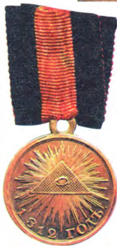
Медаль наградная «В память Отечественной войны 1812 года»

Воины! В ознаменование... незабвенных подвигов ваших, повелели мы выбить и освятить серебряную медаль, которая с начертанием на ней прошедшего столь достопамятного 1812 года долженствует на голубой ленте украшать непреодолимый щит Отечества — грудь Вашу. Всяк из вас достоин носить на себе сей достопочтенный знак — сие свидетельство трудов, храбрости и участия в славе; ибо все вы одинаковую несли тяготу и единокорным мужеством дышали.