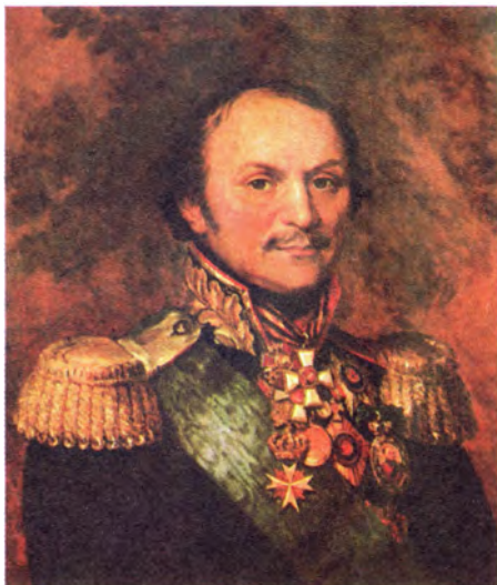
Д. Доу Портрет героя Отечественной войны 1812 года атамана войска Донского М.И. Платова