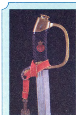
Шашка с необычным расположением знака ордена Св. Анны IV степени «За храбрость»

С 1855 года к знакам ордена Святой Анны, как и к другим орденам, стали присоединять два скрещенных меча; а к оружию, на котором находился орден Святой Анны IV степени, крепились орденская лента с серебряными кистями.