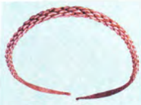
Гривна витая XI—XII веков

В летописях рассказывается об Александре Поповиче — будущем герое русских былин, отличившемся при отражении набега половцев на Киев во времена князя Владимира Мономаха. Попович был награжден за героизм самим князем золотой гривной и массивным золотым обручем, который носили на шее.