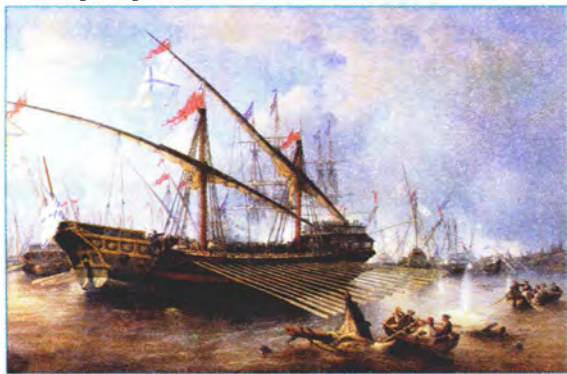
Ф. Перро Бой при Гренгаме 27 июля 1720 года

ный обряд лишения чести. При капитуляции побежденный полководец вручал свою шпагу полководцу-победителю.