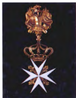
Знак ордена Св. Иоанна Иерусалимского