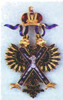
Знак (крест) ордена Св. Андрея Первозванного