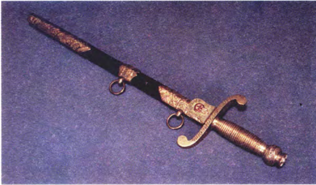
Морской кортик — наградное «Аннинское оружие» (орден Св. Анны IV степени «За храбрость»)

град, о чем мы расскажем ниже, низшая, четвертая, степень ордена носилась на холодном оружии и получила неофициальное название «Аннинское оружие». С 1829 года на этом оружии, кроме знака ордена Святой Анны IV степени, помещалась также надпись: «За храбрость».