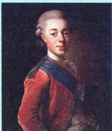
А. Рослин Портрет великого князя Павла Петровича

Орден Святой Анны вошел в число государственных наград России с апреля 1797 года, хотя Петр Ульрих, голштинский герцог, начал жаловать этим орденом с 1742 года, когда прибыл в Санкт-Петербург. В этот год императрица Елизавета Петровна объявила его наследником российского престола с именем великого князя Петра Федоровича. Младшая дочь Петра I была бездетна. Она очень любила сестру Анну и надеялась, что племянник будет достойным продолжателем дел своего великого деда. Поэтому ко времени, когда Петр Федорович был провозглашен императором Петром III, уже десятки российских вельмож носили на крас-