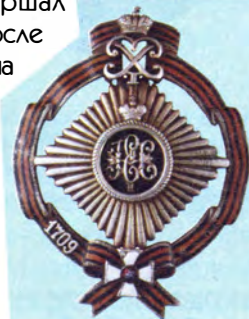
Полковой нагрудный знак 13-го драгунского Военного ордена полка: изображение знака (креста), звезды и ленты ордена Св. Георгия (Военного ордена)

расирским Военного ордена Святого Великомученика и победоносца Георгия полком, в котором все штаб- и обер-офицеры были кавалерами этого ордена. А с 6 марта 1775 года шефом этого полка стал генерал-фельдмаршал П.А. Румянцев — первый, после Екатерины II, кавалер ордена Святого Георгия I степени.