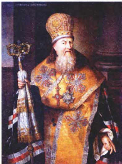
Неизвестный художник Портрет митрополита Гавриила