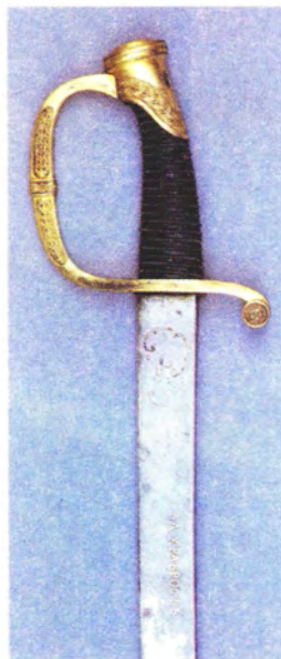
Один из ранних образцов офицерского золотого оружия «За храбрость». Надпись помещена не на эфесе, а на клинке. 1780-е годы

В царствование Павла I украшенное алмазами оружие «За храбрость» не выдавалось ни разу. После включения Павлом I в 1799 году ордена Святой Анны в систему русских на-