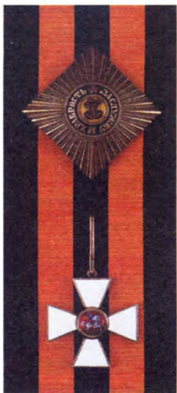
Звезда и знак ордена св. Георгия

Воинский орден Святого Великомученика и победоносца Георгия был торжественно установлен 26 ноября 1769 года. Приглашенные в тот день съехались в парадные покои Зимнего дворца, куда в 12-м часу вышли Екатерина II в орденской одежде и ее сын Павел. Со всей свитой они проследовали в придворную церковь, чтобы присутствовать на Божественной литургии. По окончании литургии началось освящение нового ордена Святого Георгия. Был оглашен статут ордена, прочитана проповедь и знаки ордена окропили святой водой.