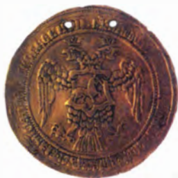
Золотая наградная медаль времен Ивана Грозного