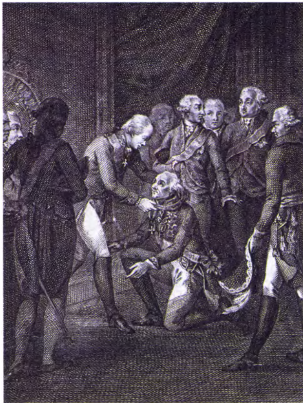
Император Павел I награждает генерал-фельдмаршала А.В. Суворова высшей степенью ордена Св. Иоанна Иерусалимского. Гравюра

Кавалерский знак — золотой крест, увенчанный короной, носили на груди на узкой орденской ленте. Ко всем степеням Мальтийского ордена прилагалась золотая звезда в виде