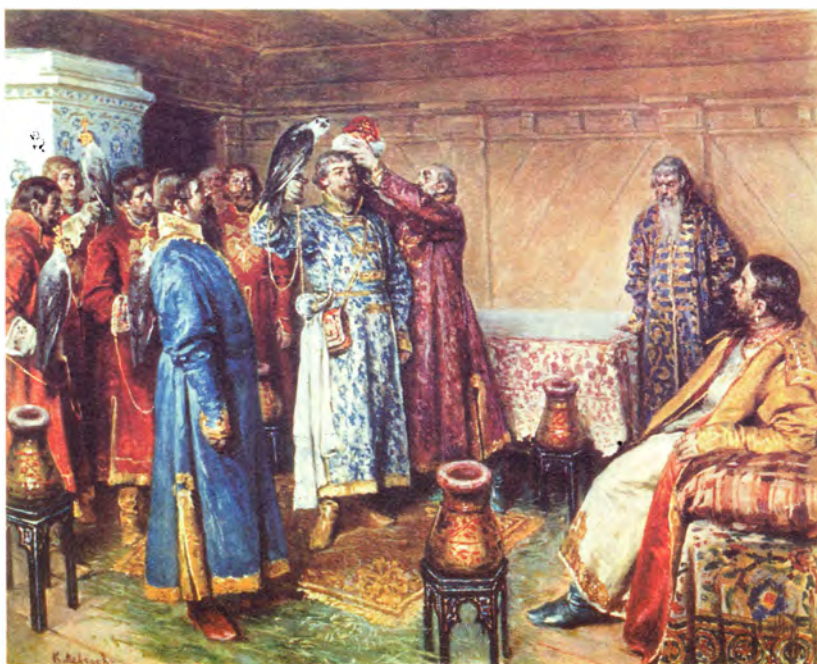
К. Лебедев Пожалование из рядовых сокольников в начальные

Такое же значение имел чин стряпчего: они назначались на разные службы при особе государя. При его выходе в церковь они несли за ним платок и стул, а во время церковной службы