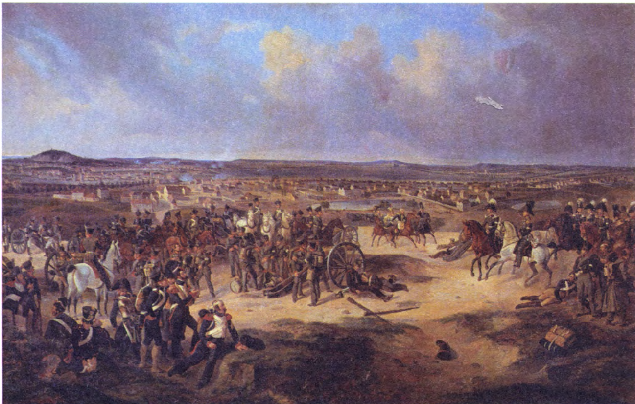
Б. Виллевальде Сражение при Париже 17 марта 1814 года

жа». Несмотря на действительно отчаянное сопротивление французских войск в первые месяцы 1814 года, русская армия вместе с силами союзников с боями шла по Франции, приближаясь к Парижу. В середине марта разгорелось жестокое сражение под Фер-Шампенуазом, восточнее Парижа, в ходе которого французы потерпели тяжелое поражение. В этом сражении особенно отличились полки русской гвардейской тяжелой кавалерии. Многим полкам потом были пожалованы почетные знаки отличия — Георгиевские серебряные трубы с лентами, на которых было написано «За Фер-Шампенуаз».