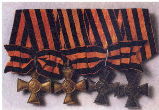
Четыре степени солдатского Георгиевского креста («полный бант»)

Четвертая степень ордена Святого Георгия стала наградой для офицеров, тогда