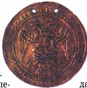
Золотая наградная медаль времен Ивана Грозного

С древнейших времен племенные вожди, а затем князья и цари награждали героев, прославившихся в боях, своих особо приближенных чиновников, художников и поэтов, воспевавших их подвиги. Награды были разными — от земельных наделов до фибул (застежек на накидках), от вручения лавровых венков и права триумфа (торжественной встречи полководцев-победителей жителями Рима) до права рядовых солдат