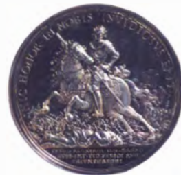
Серебряная медаль в память Полтавского сражения