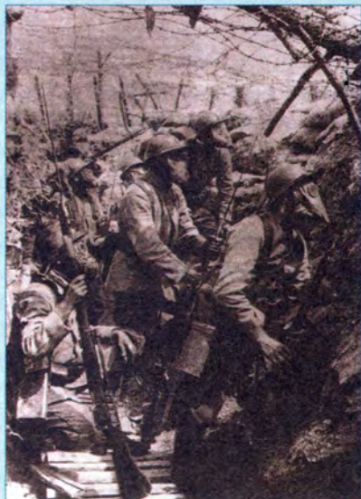
Газовая атака времен Первой мировой войны

«Инспектор народных училищ Московской губернии извещает Чехова о награждении его орденом Святого Станислава III степени "за отличное усердие и особые труды по должности попечителя Талезского сельского училища"».