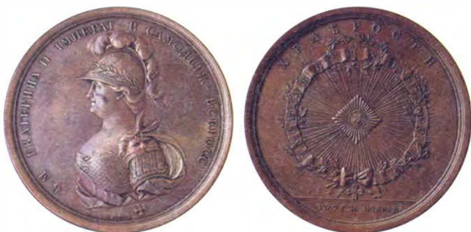
Лицевая и обратная стороны медали в память учреждения ордена Св. Георгия