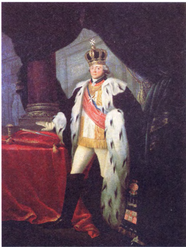
С. Тончи Портрет Павла I в одеянии магистра Мальтийского ордена

Четыре рыцаря-крестоносца отказались от всего мирского, приняв монашеские обеты бедности, послушания и целомудрия. Впоследствии братство стало принимать в свои ряды и других рыцарей, чтобы те защищали паломников. Так постепенно Орден стал рыцарским, и к середине XII века Орден превратился в мощное дисциплинированное воинское объединение.