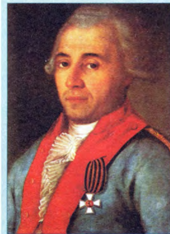
Неизвестный художник. Кавалер ордена Св. Георгия IV степени

Первым Георгиевским кавалером, получившим награду за боевой подвиг, стал Ф.И. Фабрициан — подполковник 1-го Гренадерского (затем лейб-гвардии Гренадерского) полка. Во время Русско-турецкой войны 1768—1774 годов его отряд в 1600 человек был окружен у реки Дунай 7-тысячным турецким отрядом сераскира Мехмета. Несмотря на явное неравенство сил, Ф.И. Фабрициан отразил нападение врага и смело перешел в атаку. Турки бежали, и, преследуя их, русские с ходу взяли город Галац. За этот подвиг русский подполковник 8 декабря 1769 года, всего через несколько дней после учреждения новой награды, был удосто-