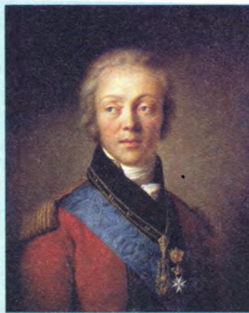
С. Тончи. Портрет графа Ф.В. Раstopчина