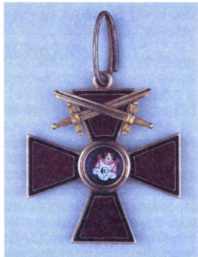
Знак (крест) ордена Св. Владимира за военные заслуги с мечами сверху

В 1789 году, через семь лет после учреждения ордена, появилась особо почетная награда офицерам за боевые подвиги — орден Святого Владимира IV степени.