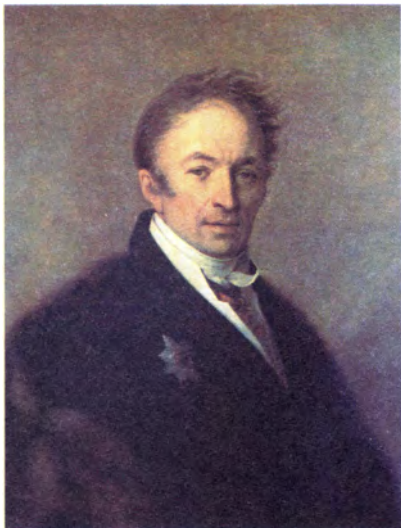
А. Венецианов Портрет Н.М. Карамзина