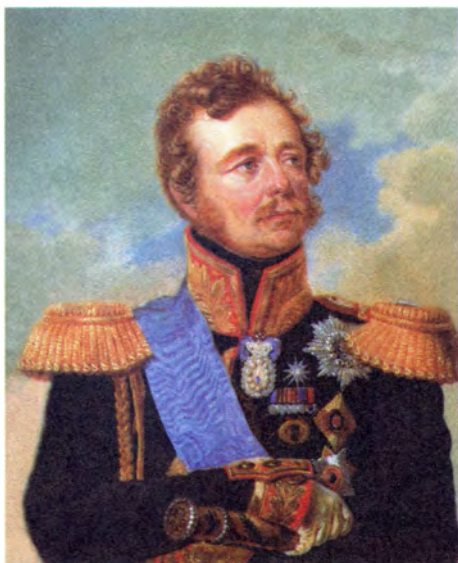
Неизвестный художник Портрет генерал-фельдмаршала И. Ф. Паскевича-Эриванского