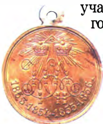
Медаль «В память Восточной (Крымской) войны 1853—1856 гг.»

Была и еще одна «крымская награда», учрежденная в августе 1856 года, — это медаль «В память Восточной (Крымской) войны 1853—1856 гг.». Она вручалась всем офицерам, солдатам и морским чинам воинских частей, действовавших на кавказском и дунайском направлениях, участникам Синопского сражения и защитникам Петропавловского порта на Камчатке.