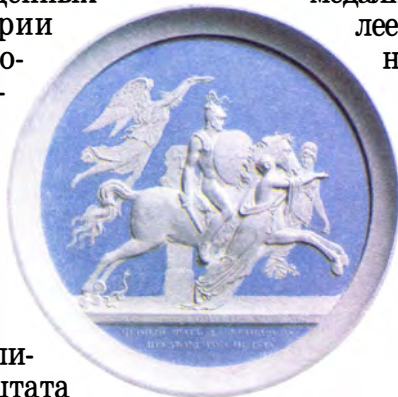
Ф. Толстой. Барельеф Первый шаг императора Александра за пределы России в 1813 году

В декабре 1813 года Александр I подписал новый указ, который определил порядок награждения. Медаль следовало вручать «строевым чинам в армиях и ополчениях всем без изъятия, действовавшим против неприятеля в продолжение 1812 года». Из нестроевых чинов право на медаль имели лишь священники и медицинские чины, «кои действительно находились во время сражений под неприятельским огнем». При этом император требовал представлять «об них всякий раз на утверждение мое именные списки». Все чины в армиях и ополчениях, включившиеся в боевые действия с 1 января 1813 года, а также не участвовавшие в них в 1812 году «по случаю нахождения в других корпусах или при особых поручениях», право на получение медали в память 1812 года не имели. И далее следовало строгое предупреждение: «За исключением поименованных решительно никто не должен носить медалей». В связи с этим строго указывалось, «чтобы все те чиновники или чины, кои не подходят под сие правило, но но-