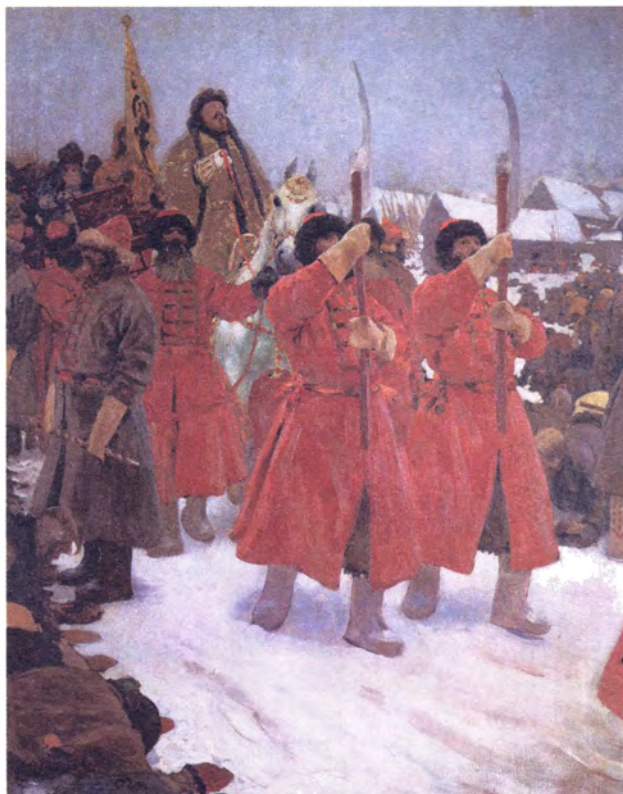
С. Иванов Царь. XVI в.

Окольничии имели те же обязанности, что и бояре, но с меньшим значением; в государственных документах при перечислении должностных лиц их имена всегда следовали за боярскими. Они самостоятельно управляли многими приказами, а иногда назначались товарищами (заместителями) к боярам. В царствование Алексея Михайловича окольничим поручалось заведовать такими приказами, как Разрядный — главное военное ведомство или приказом Большого Прихода — главным финансовым управлением, ведавшим всеми торговыми и таможенными сборами.