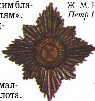
Звезда ордена Св. Андрея Первозванного, принадлежавшая Я.В. Брюсу. Награда полу- чена за отличие при Полтаве в 1709 году

Вторым кавалером ордена Андрея Первозванного в феврале 1700 года стал украинский гетман И.С. Мазепа. Отмеченный «в воздаяние заслуг, оказанных им в течение 13 лет на военном поприще, в войну с турками и крымским ханом», он получил награду из рук самого Петра I. Как известно, в октябре 1708 года Мазепа изменил Петру, и царь в связи с этим после Полтавской битвы учредил орден, существовавший в одном экземпляре, — Орден Иуды.