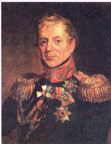
Д. Доу. Портрет героя Отечественной войны 1812 года генерала П.П. Коновницына

За военную кампанию 1806—1807 годов, когда русская армия принимала участие в войне против Наполеона, высокую награду получил сподвижник А.В. Суворова — атаман Донского казачьего войска М.И. Платов. В сражении при Прейсиш-Эйлау (ныне Багратионовск Калининградской области) донские казаки опрокинули цвет французской кавалерии — конную гвардию Наполеона. В другом сражении казаки лихой атакой выбили из города Гутштадта войска французского маршала М. Нея, затем казачьи полки М.И. Платова сильно потрепали польский корпус генерала Зайончека, входивший во французскую армию. Досталось от них и войскам маршала Л.Н. Даву, потерявшего в одном из сражений целый полк.