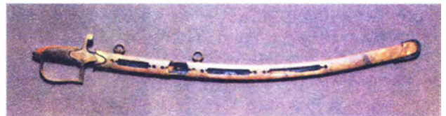
Сабля — золотое оружие генерал-майора Я.П. Кульнева с надписью: «За храбрость»

За подвиги в Отечественной войне 1812 года золотым оружием были награждены и многие будущие декабристы, выступившие против самодержавия 14 (25) декабря 1825 года.