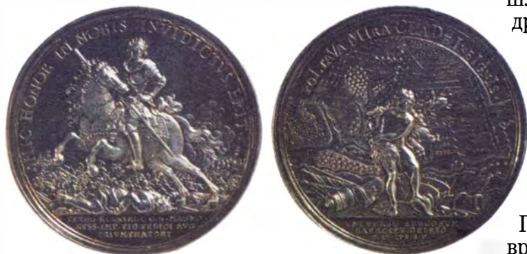
Серебряная медаль в память о Полтавском сражении

Распоряжение царя о награждении участников этой славной победы последовало вскоре после сражения, а потом в честь грандиозной победы были отчеканены золотые и серебряные медали.