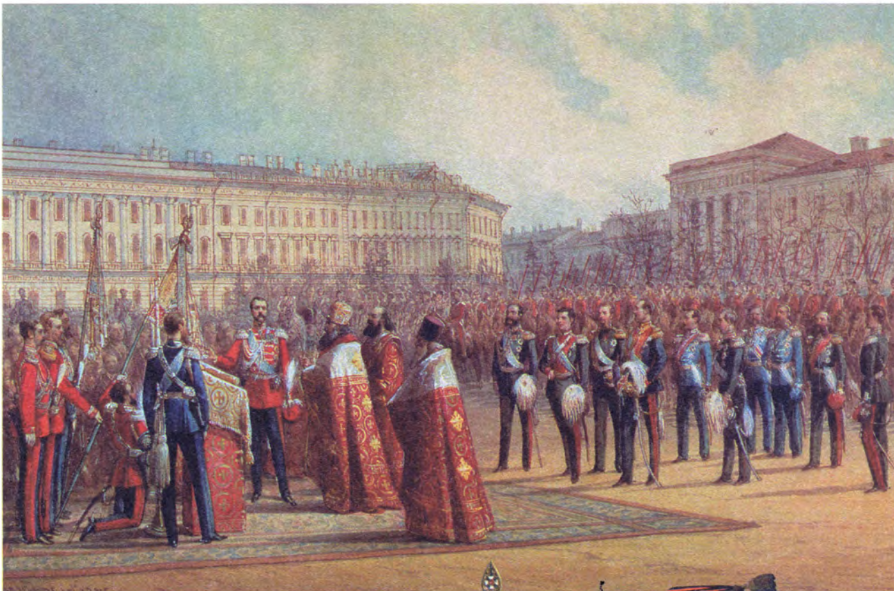
Неизвестный художник Вручение штандартов казачьему полку 20 апреля 1875 года