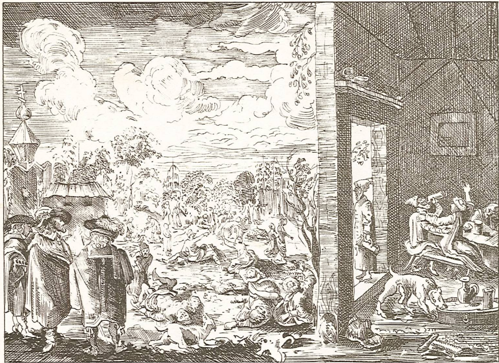
СЦЕНЫ ВЪ КАБАКЪ И ПЕРЕДЪ КАБАКОМЪ