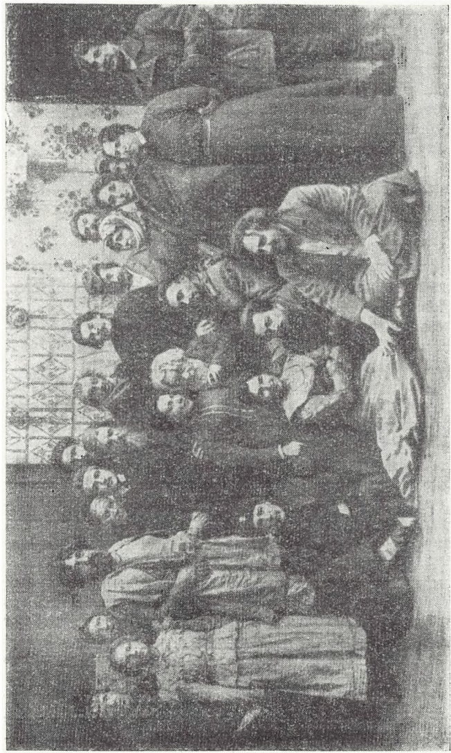
М. ГОРЬКИЙ СРЕДИ ИСПОЛНИТЕЛЕЙ ПЬЕСЫ «МЕЩАНЕ» В ХУДОЖЕСТВЕННОМ ТЕАТРЕ. 1902 Г.