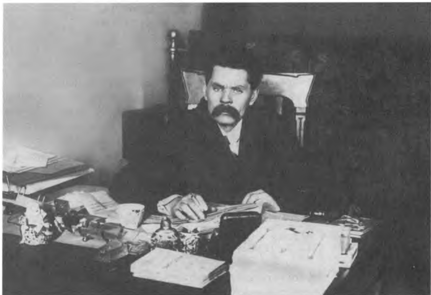
М. Горький. Москва, Машков пер. До ноября 1918 г.