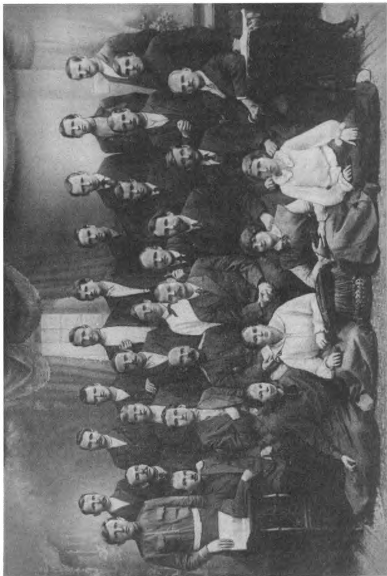
М. Горький среди слушателей профсоюзного движения при Петроградском союзе стекольщиков.