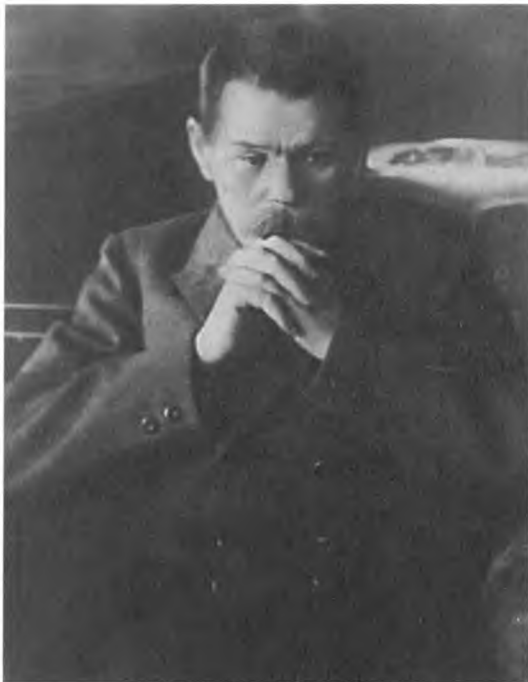
М. Горький. Петроград. 1917–1918.

Груббе. Акционерное О-во “Копейка” участвует техникой. Груббе – директор Сибирского банка, но это весьма порядочный, очень культурный человек и деньги дает лично он, а не его банк.