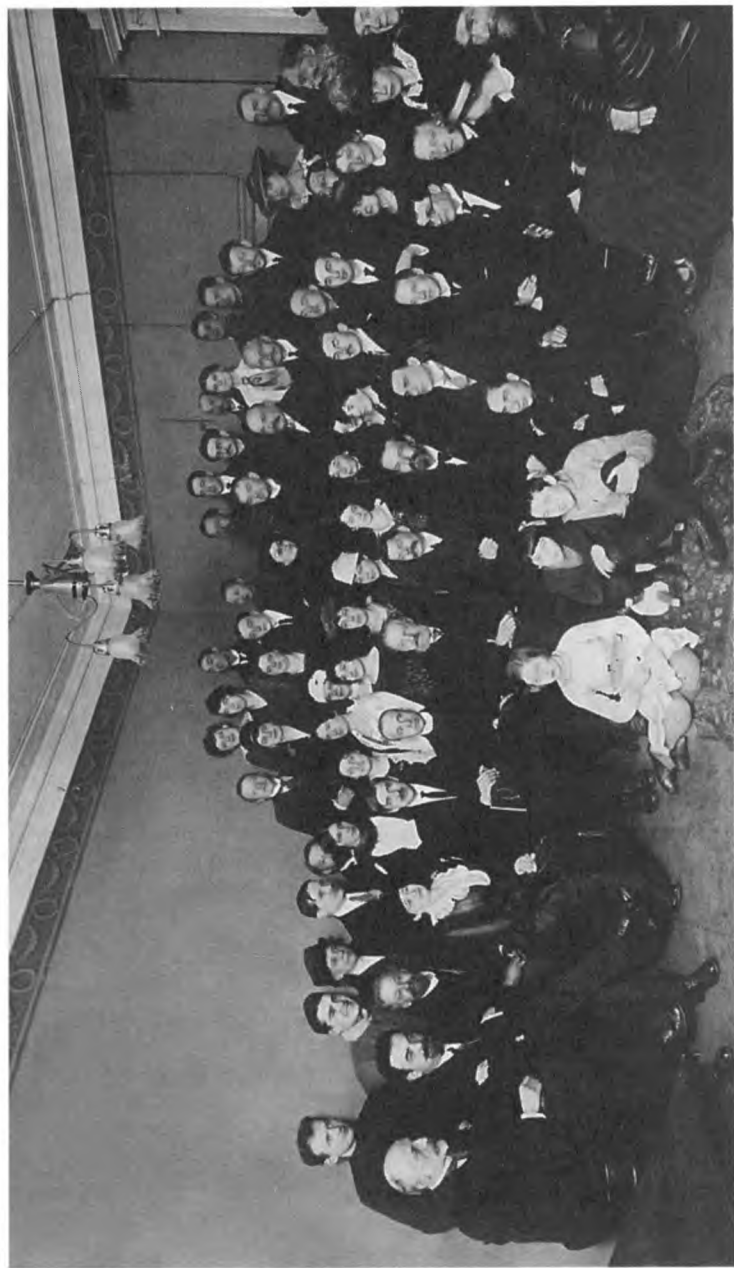
Чествование М. Горького в связи с его 50-летием. Петроград. 30 марта 1919 г.