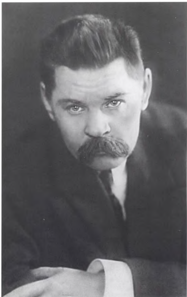
М. ГОРЬКИЙ Петроград. 1915–1916.