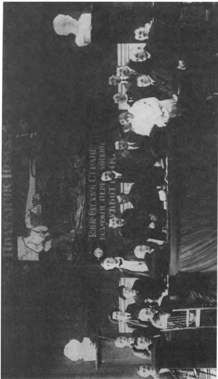
М. Горький, Ф. И. Шляпин и др. на Втором Всероссийском съезде рабочих стекольно-фарфорового производства. Петроград. До 14 февраля 1918 г.