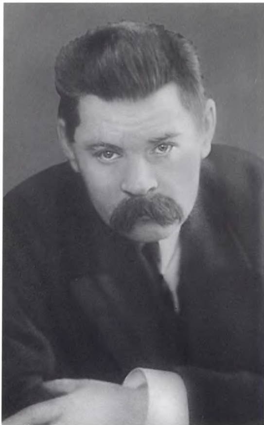
М. ГОРЬКИЙ. Петроград. 1914–1917 гг.