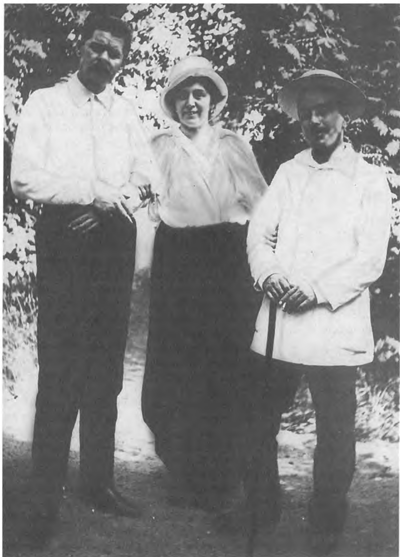
М. Горький, М.Ф. Андреева, В.Л. Мчедлов. Мустамяки. Июль 1914 г.