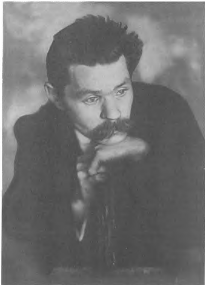
М. Горький. Петроград. 1915–1916 гг.