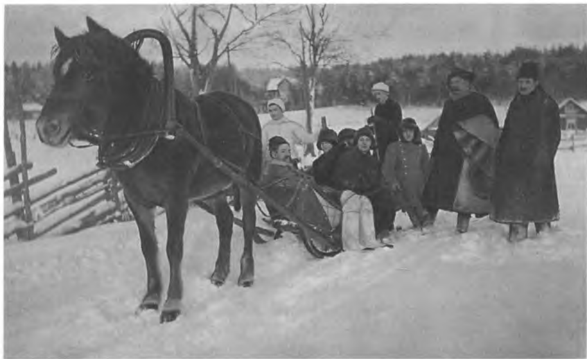
М. Горький, М.Ф. Андреева и др. Мустамяки. 1914 г.

Вы на меня рассердились за отношение к синематографу 2 ? Но – как бы иначе мог я отнестись к делу, столь многоэтажному?