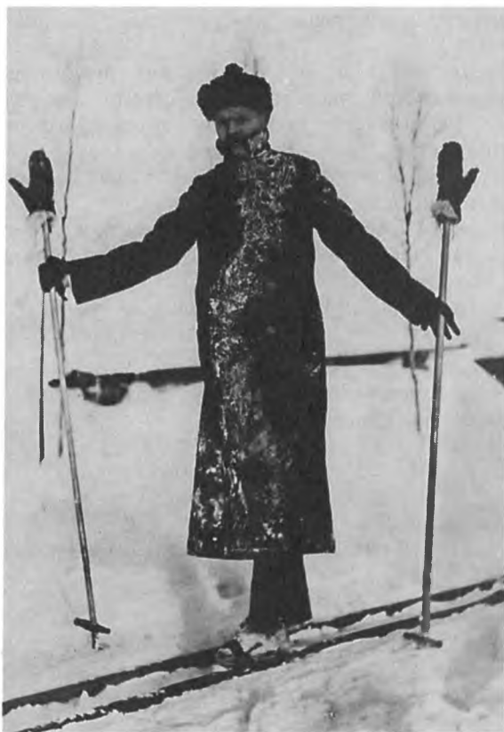
М. Горький. Мустамяки. 1914 г.