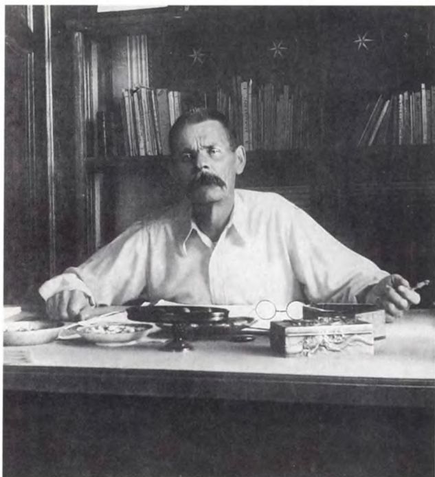
М. ГОРЬКИЙ. Капри. Июнь–июль 1911 г.