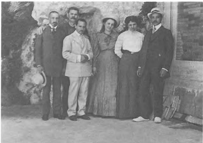
М. Горький, И.А. Бунин и другие на балконе виллы Спинола. Капри. До 8(21) мая 1910 г.