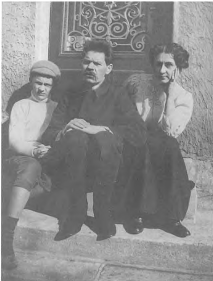
М. Горький, Е.П. Пешкова, М.А. Пешков на ступенях дома. Париж. Первая половина февраля 1911 г.