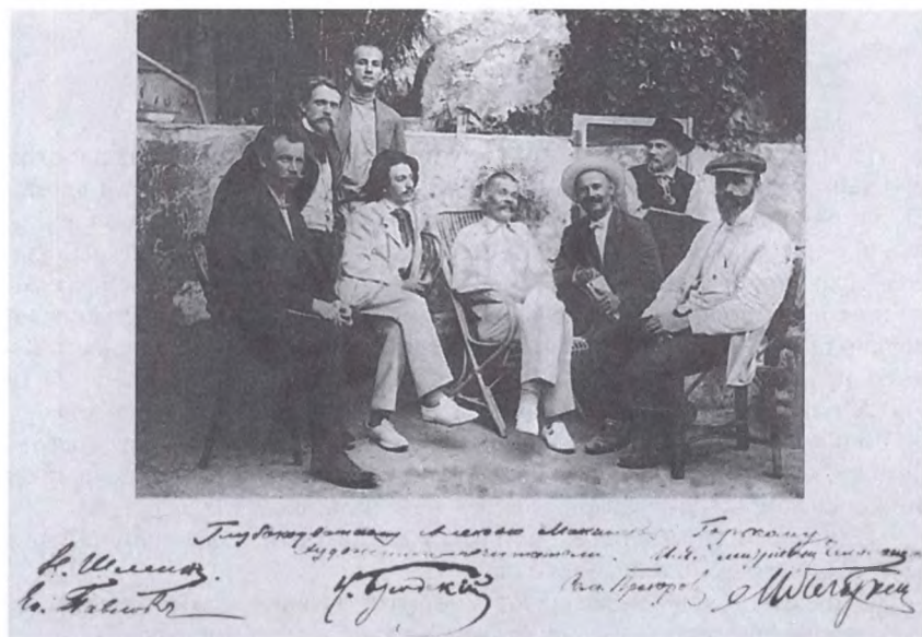
М. Горький с художниками-стипендиатами Академии художеств. Капри, вилла Спинола. До 23 августа 1910 г.

Будь здоров, не купайся до усталости, не раздражай мать. Обнимаю.