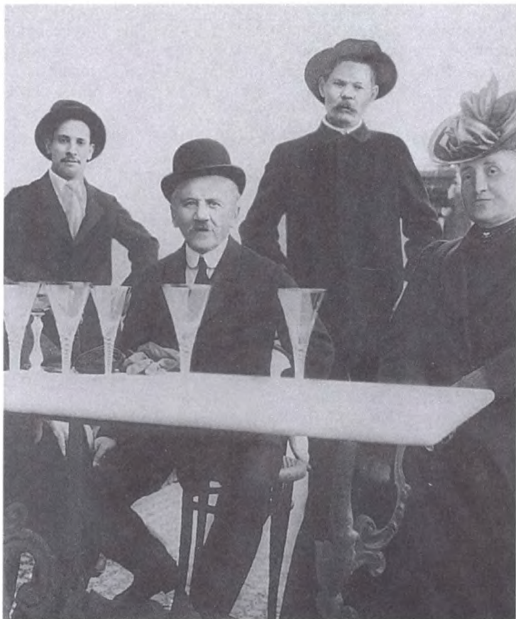
М. Горький, М.И. Чайковский и другие на террасе ресторана. Капри. Март 1910 г.