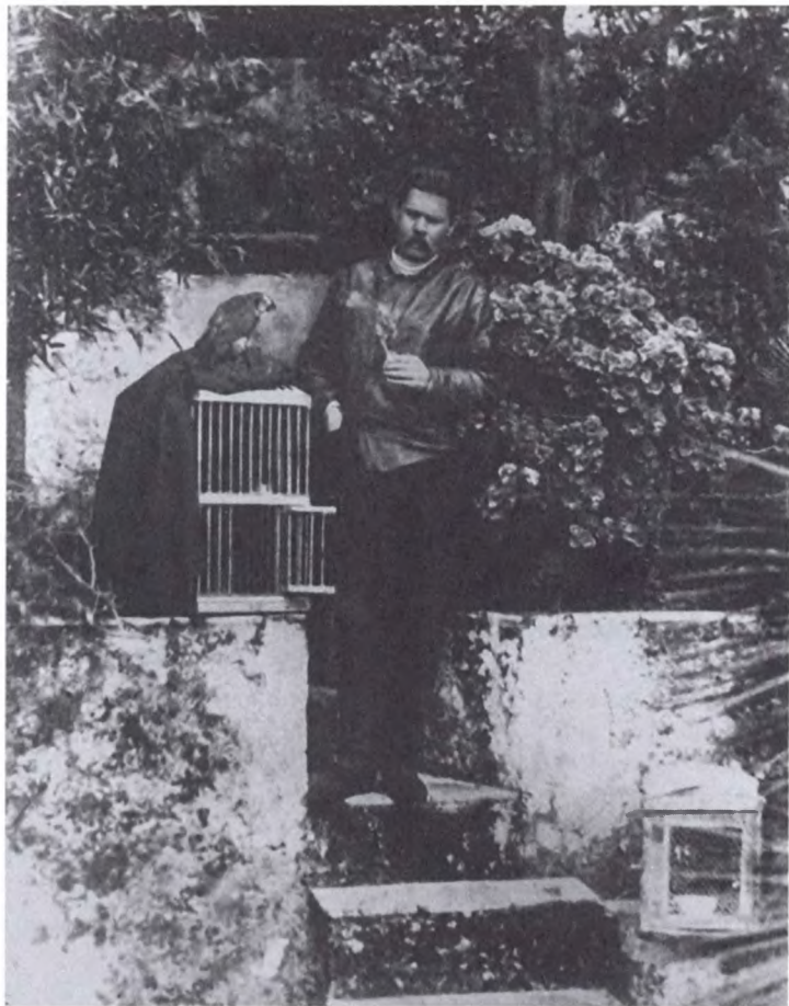
М. Горький в саду виллы Спинола у клеток с птицами. Капри. 1910–1911 гг.

не встанут на места, природою им назначенные. Будет тебе хорошо здесь, будет уютно и весело, к сему примем все строжайшие меры.