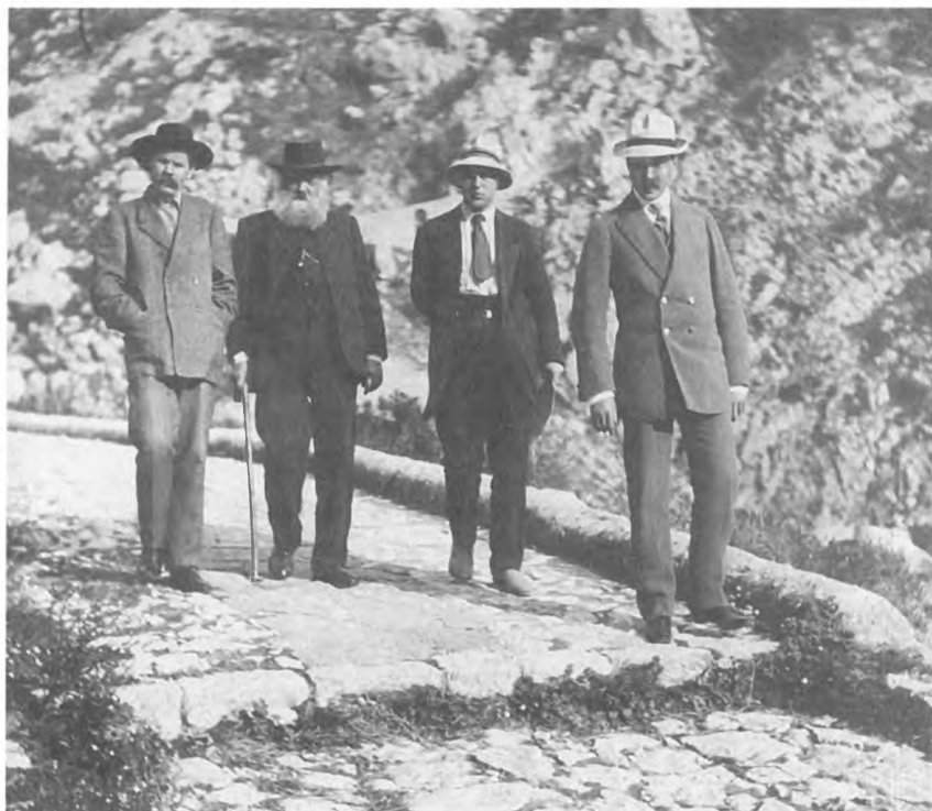
М. Горький, Г.А. Лопатин и другие на прогулке. Капри. Ноябрь–декабрь 1909 г.

Если Вы приедете вскоре – можете встретить здесь человека из Персии 9 . Где Гер(ман) Ал(ександров)ч? Приедет ли, как обещал 10 ?