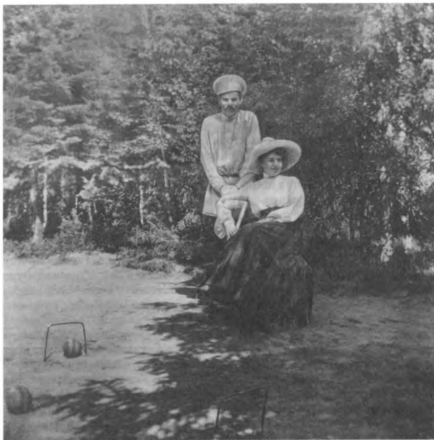
М. Горький и М.Ф. Андреева. Финляндия. Куоккала. Лето 1904 г.

– на станции Бильдерлингсгоф 3 , Риго-Туккумской дороги, но пишите: Рига, Коммерческая гостиница, на имя Маруси. Чуете?