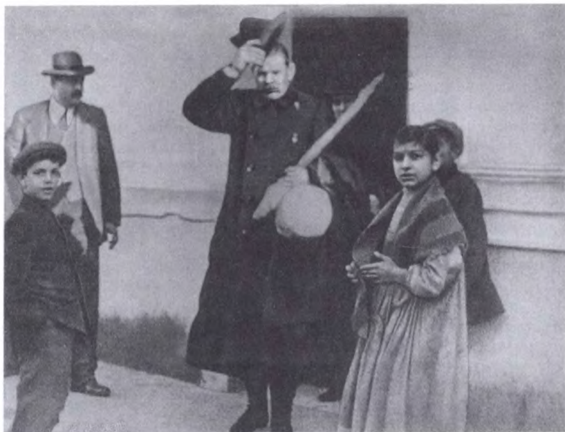
Приезд М. Горького на Капри. Горький стоит у входа на причал. 1906 г. Съемка А.О. Дранкова