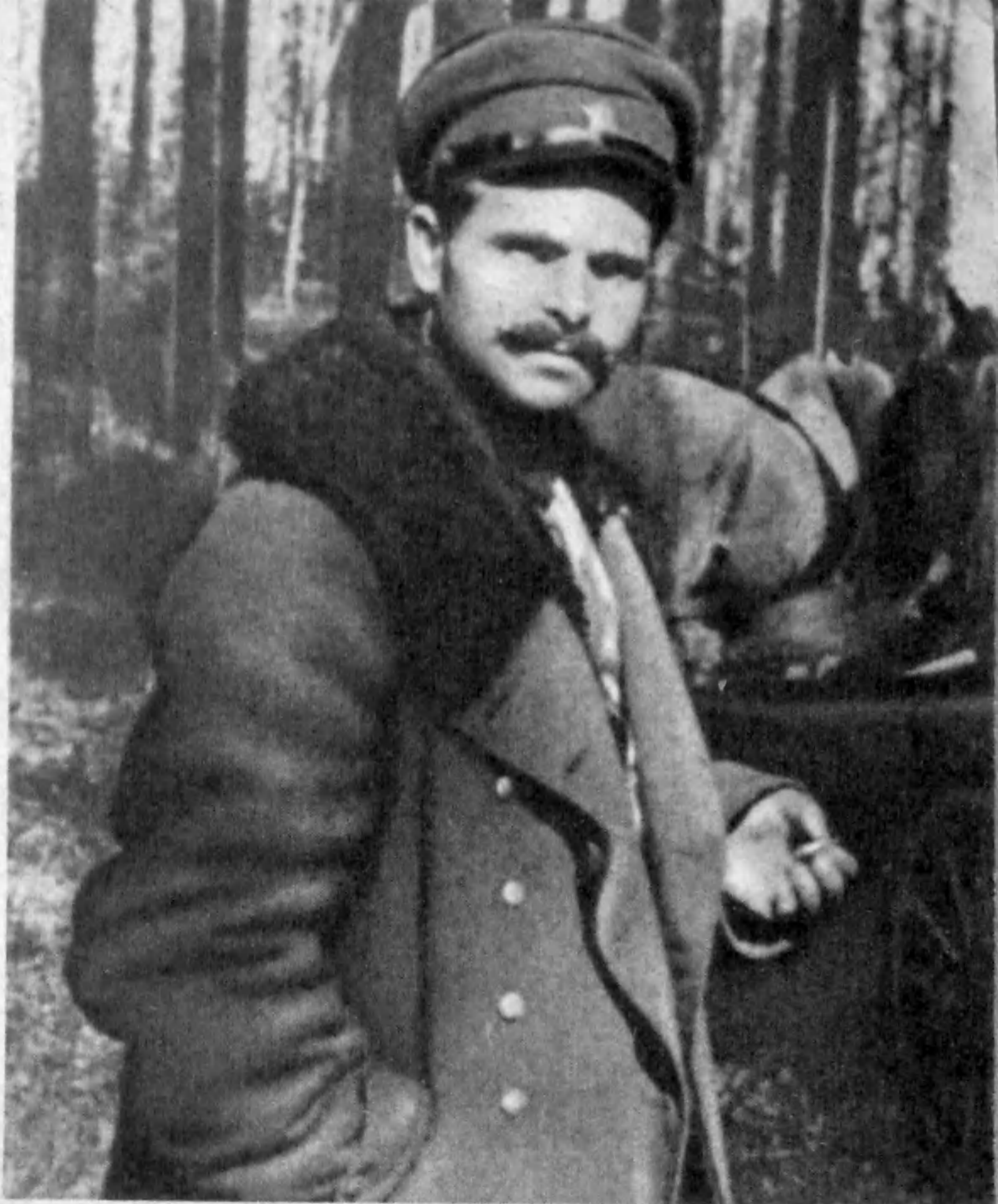
Комиссар соединения Герой Советского Союза С. В. Руднев