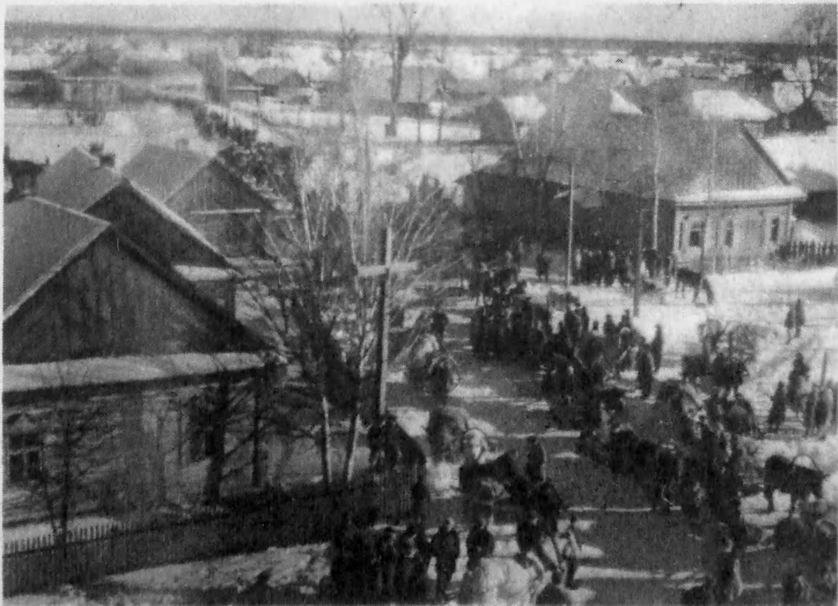
Ковпаковцы в западнобелорусском селе Чолонец