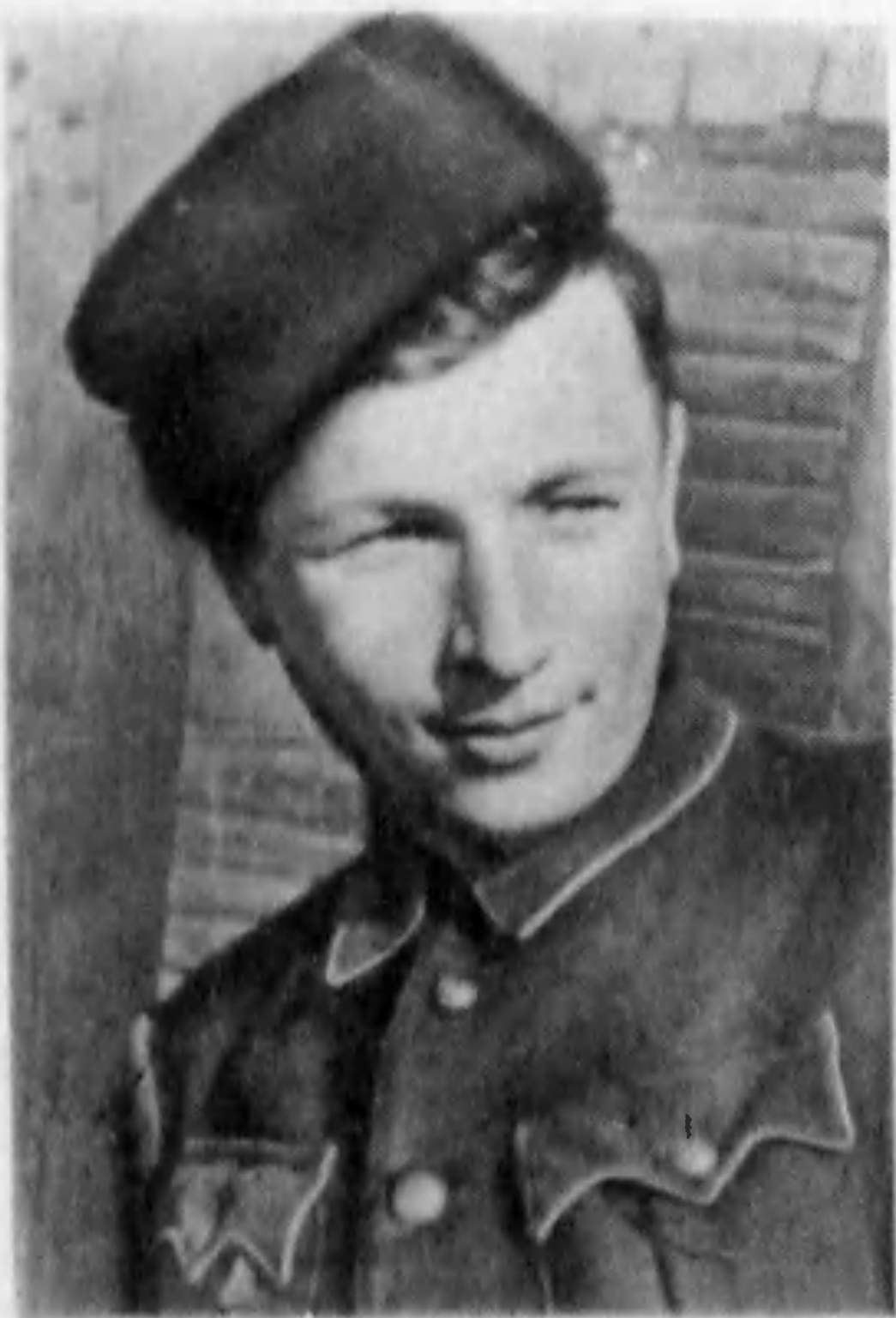
Разведчик Владимир Лапин