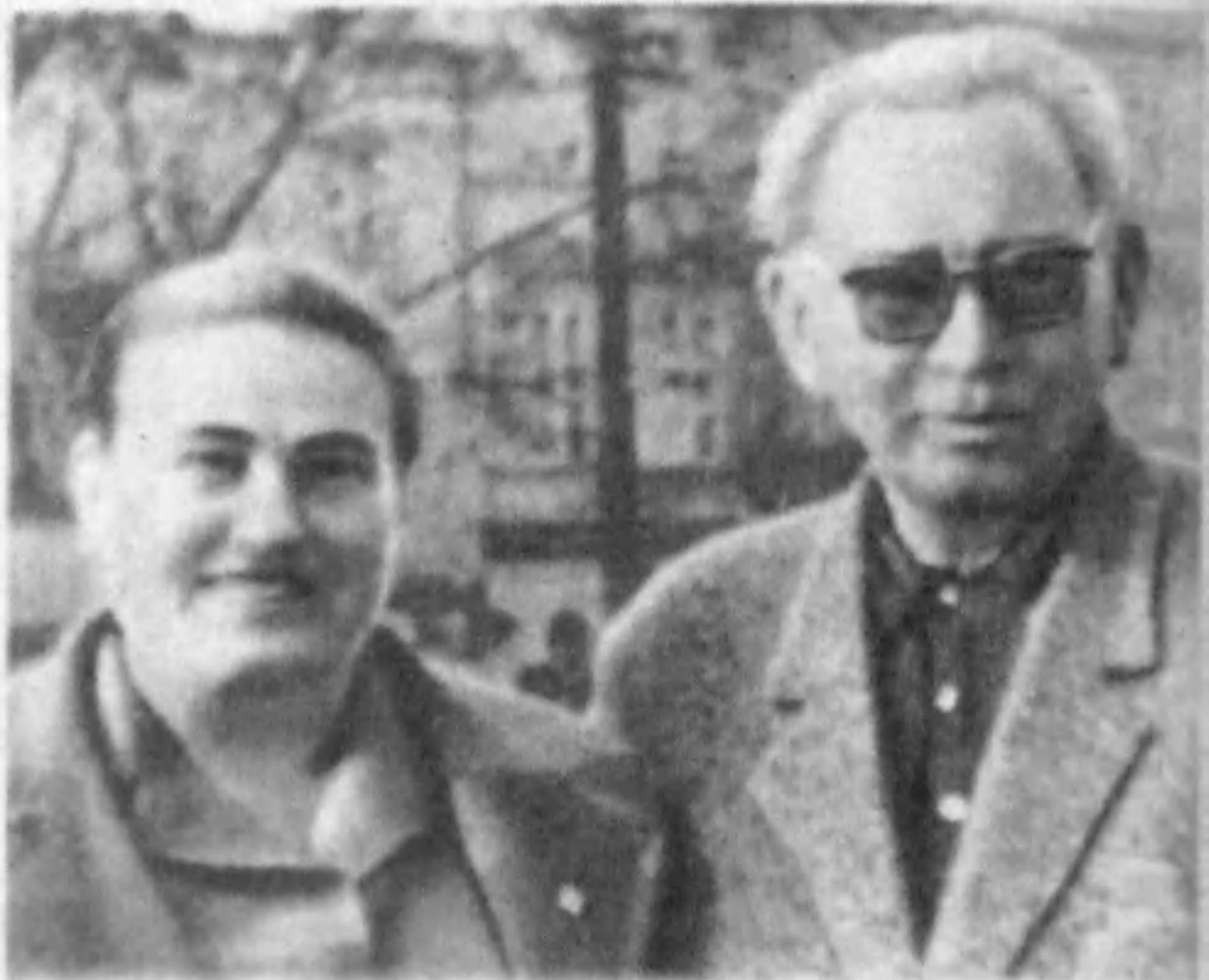
С. А. Ковпак на сессии Верховного Совета СССР в Кремле