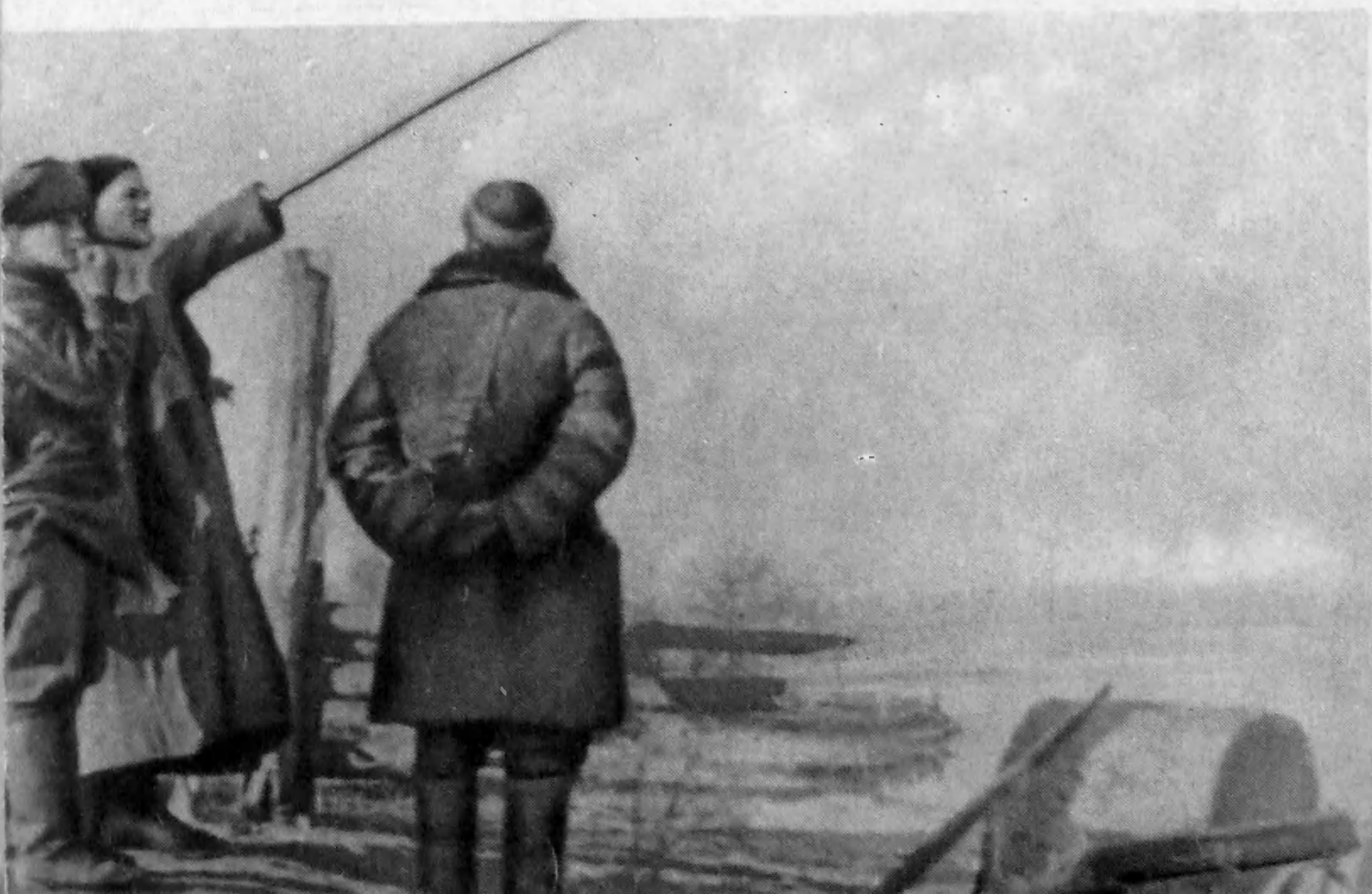
Командный пункт боя у реки Тетерев