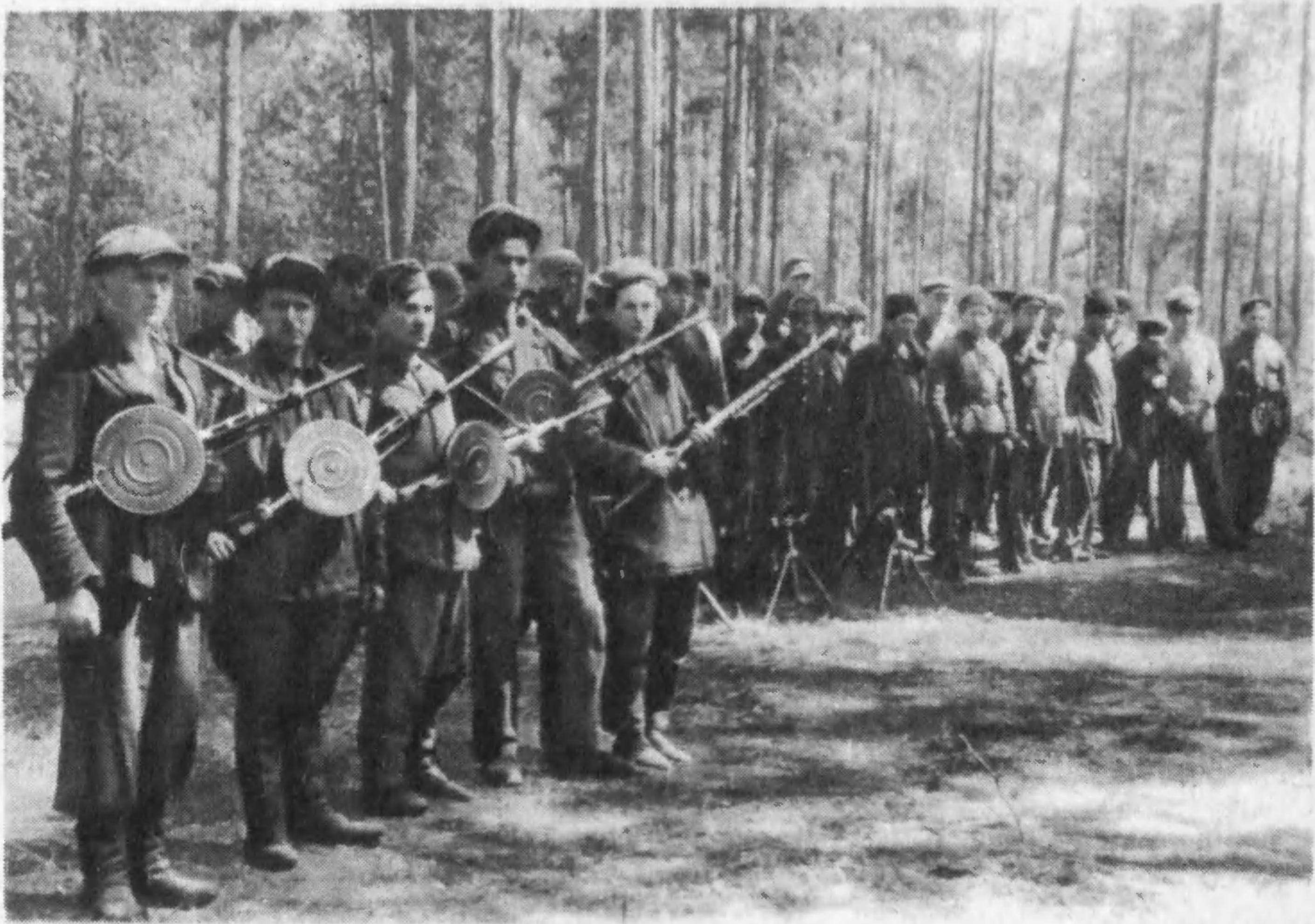
Выход диверсионной группы на железную дорогу Житомир — Киев